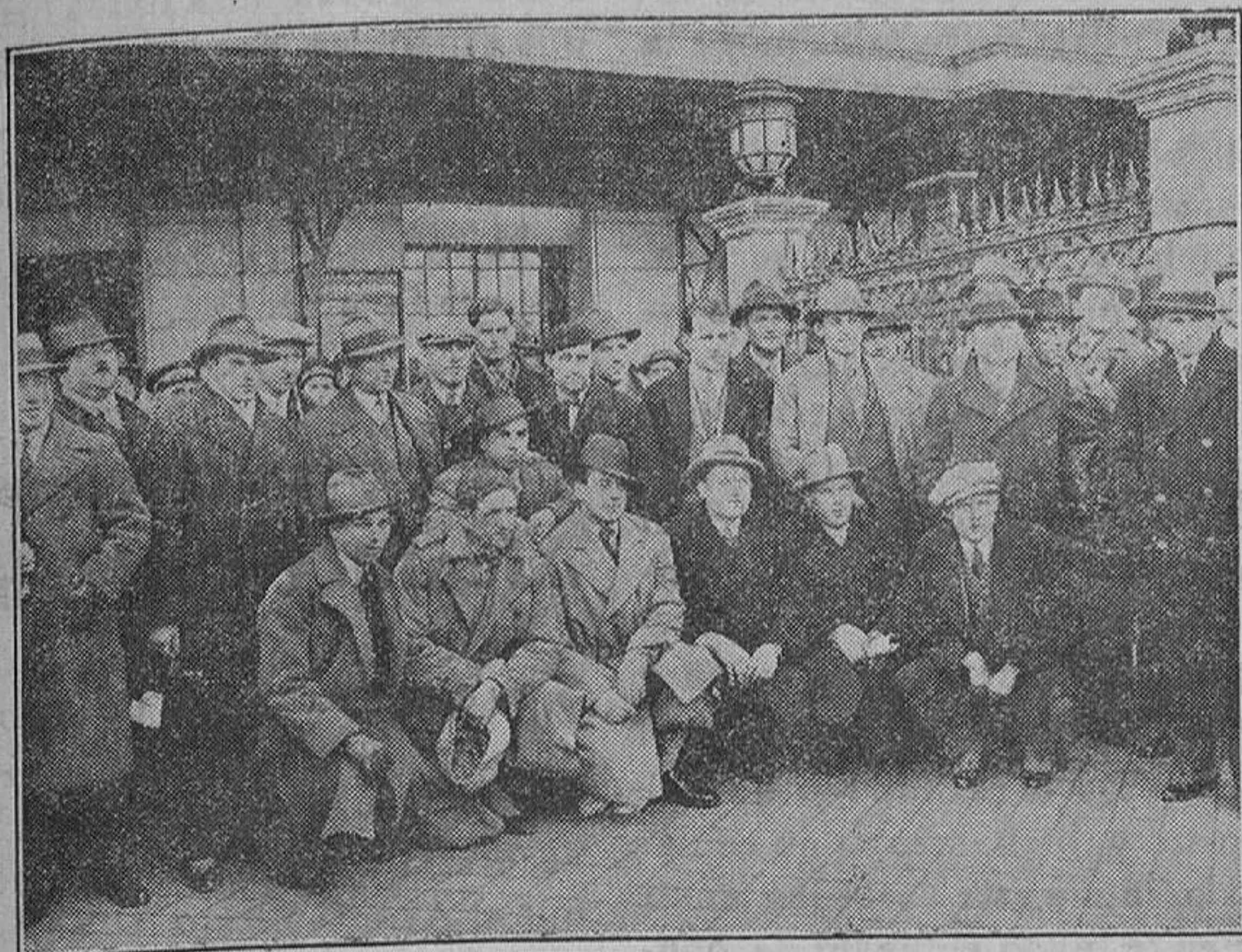
BARCELONA. — Interesante grupo formado por el equipo checo-eslavo