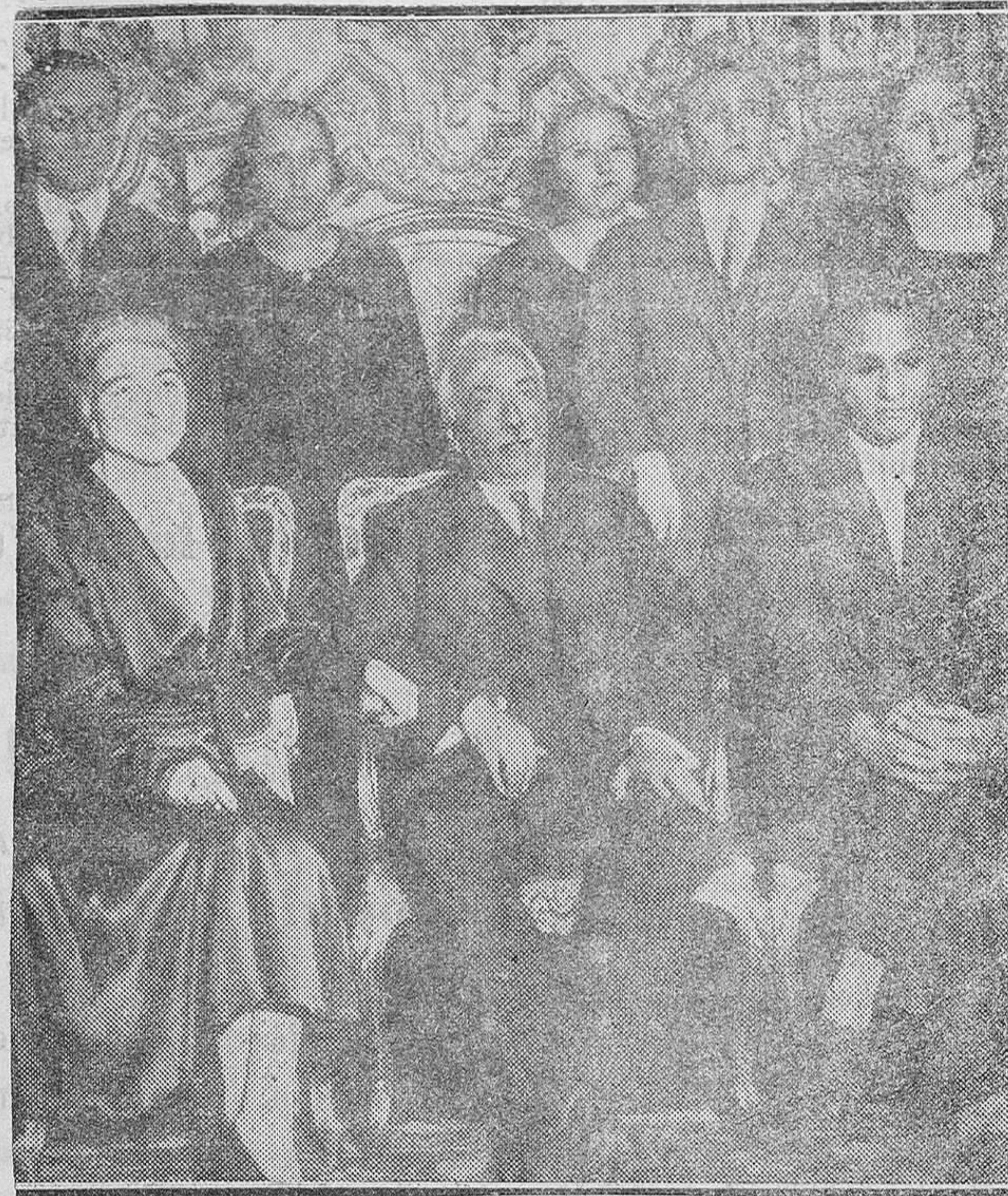
EL NUEVO JEFE DE ESTADO. — El Presidente de la República, don Niceto Alcalá Zamora, formando grupo con su esposa y sus hijos