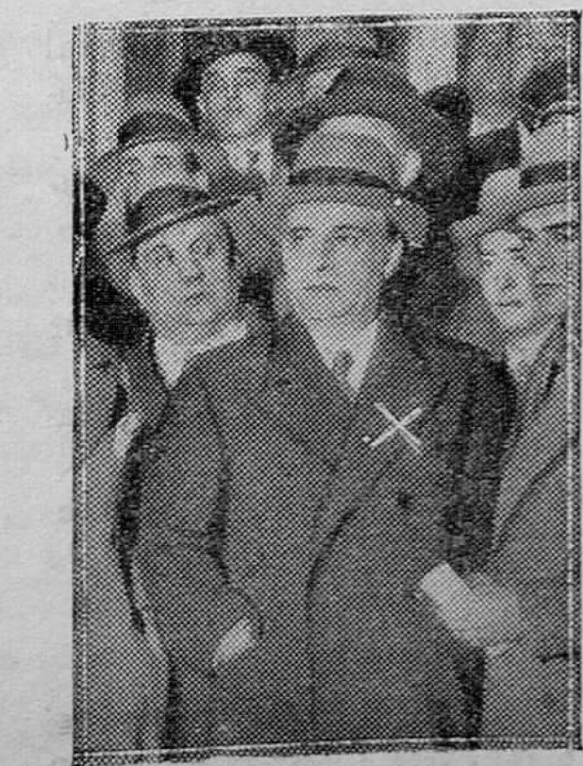
MADRID. — Don José Ortega Gasset, saliendo de Palacio, después de ser consultado

—Vulgaridad, vulgaridad, espantosa vulgaridad. Hasta ahora no ha aparecido ningún genio. Los cambios de Gobierno—éste es el segundo del régimen—semejaban un rigodón bailado en un piso tercero de la calle de la Ruda. Con absoluto respeto para las personas, la danza se desarrolla con la inhabilidad de los neófitos. Hay que buscar un maestro. No puedo olvidar la frase del señor Companys, ex gobernador de Barcelona, que exclamó desde su cargo oficial: «Me espanta la falta de hombres que veo en la República.» Ni aquella otra que publicaba «El Liberal» en un editorial del 29 de octubre último: «Pero la