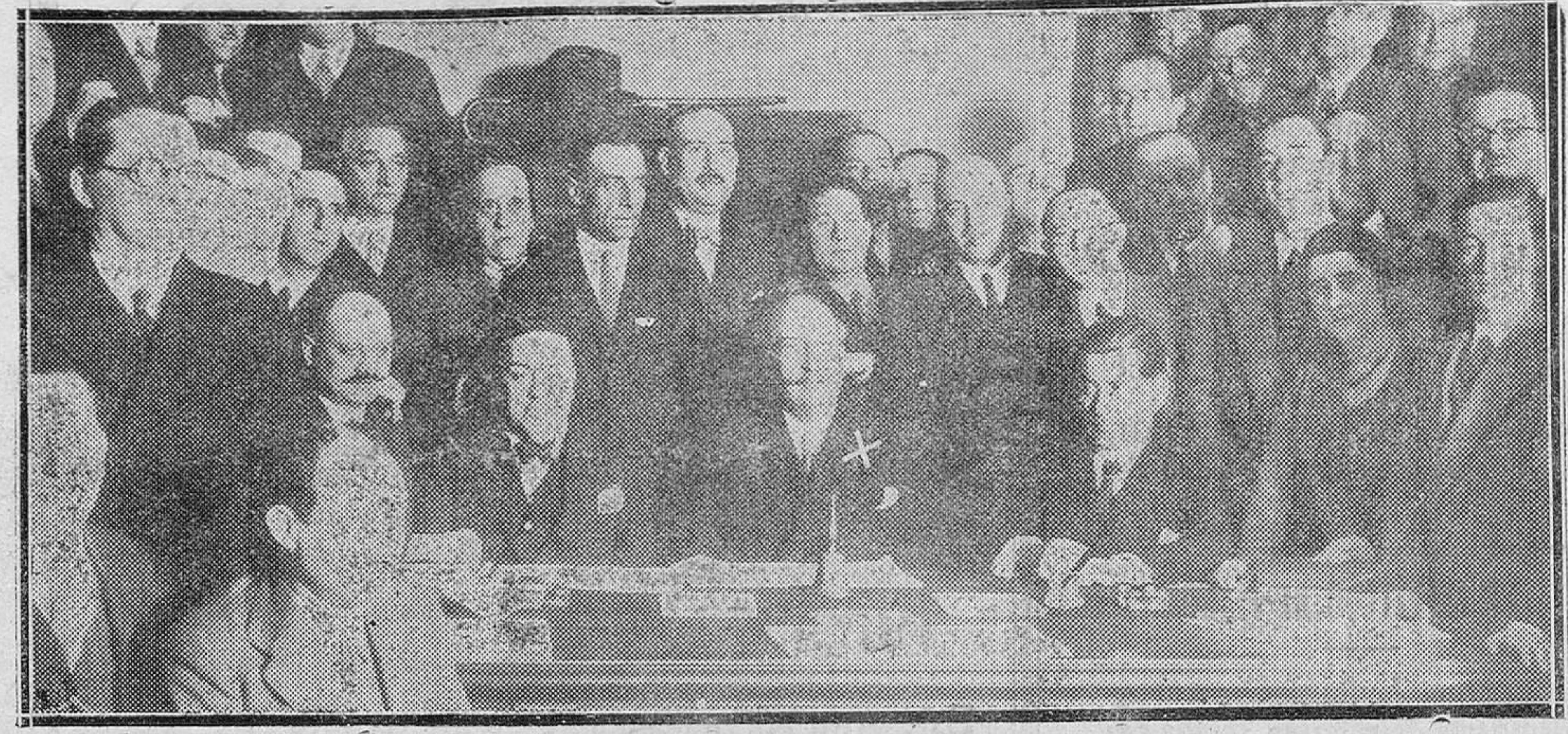
MADRID.—La minoría radical reunida en el Congreso para tomar acuerdos, bajo la presidencia del señor Lerroux

Por otra parte, si no se exigen suficientes garantías a los nuevos propietarios parcelarios, sucederá que los más enagenarán lo repartido, volviendo el terreno a poder de