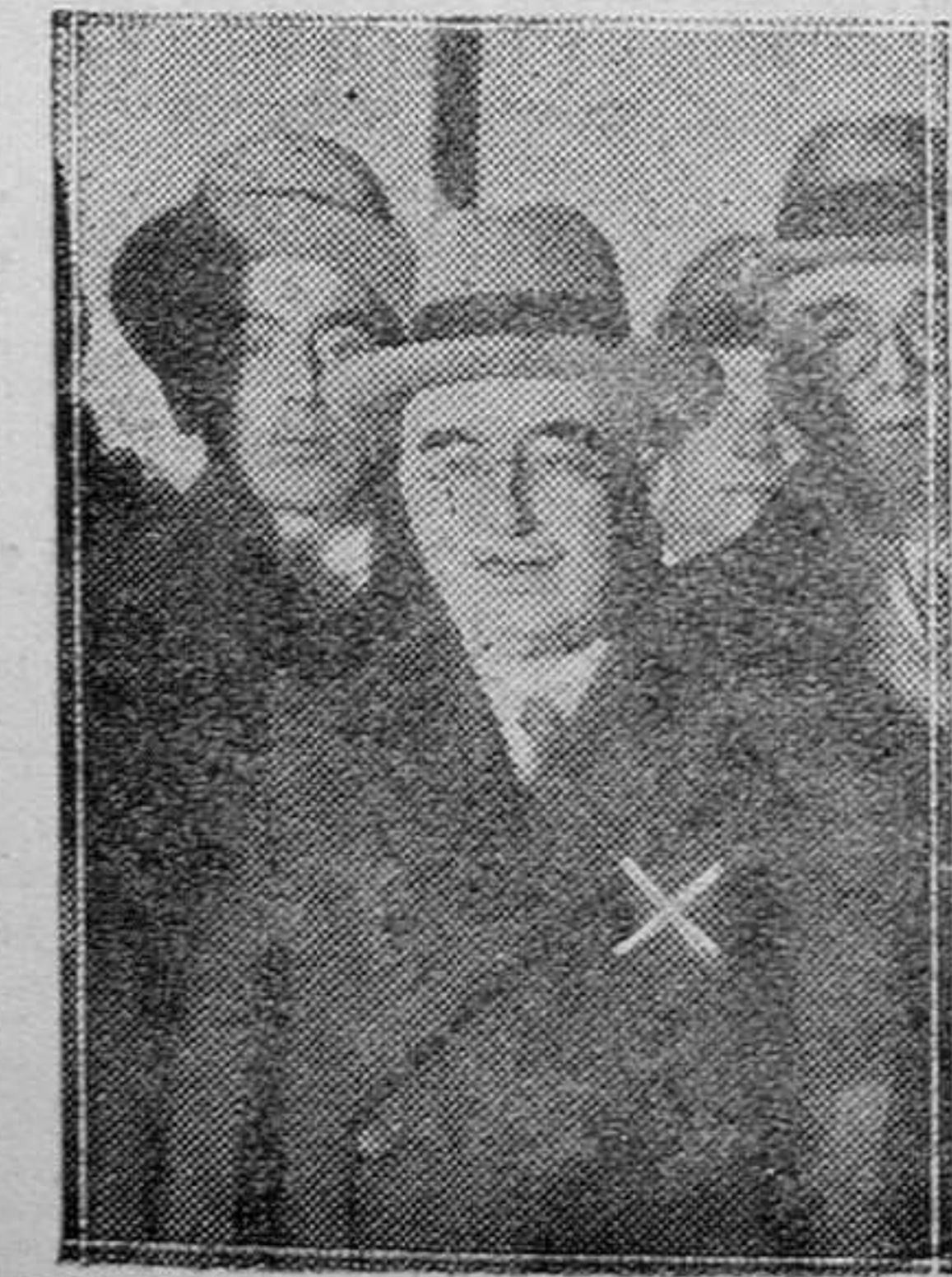
MADRID.—El general Blanco al salir de Palacio