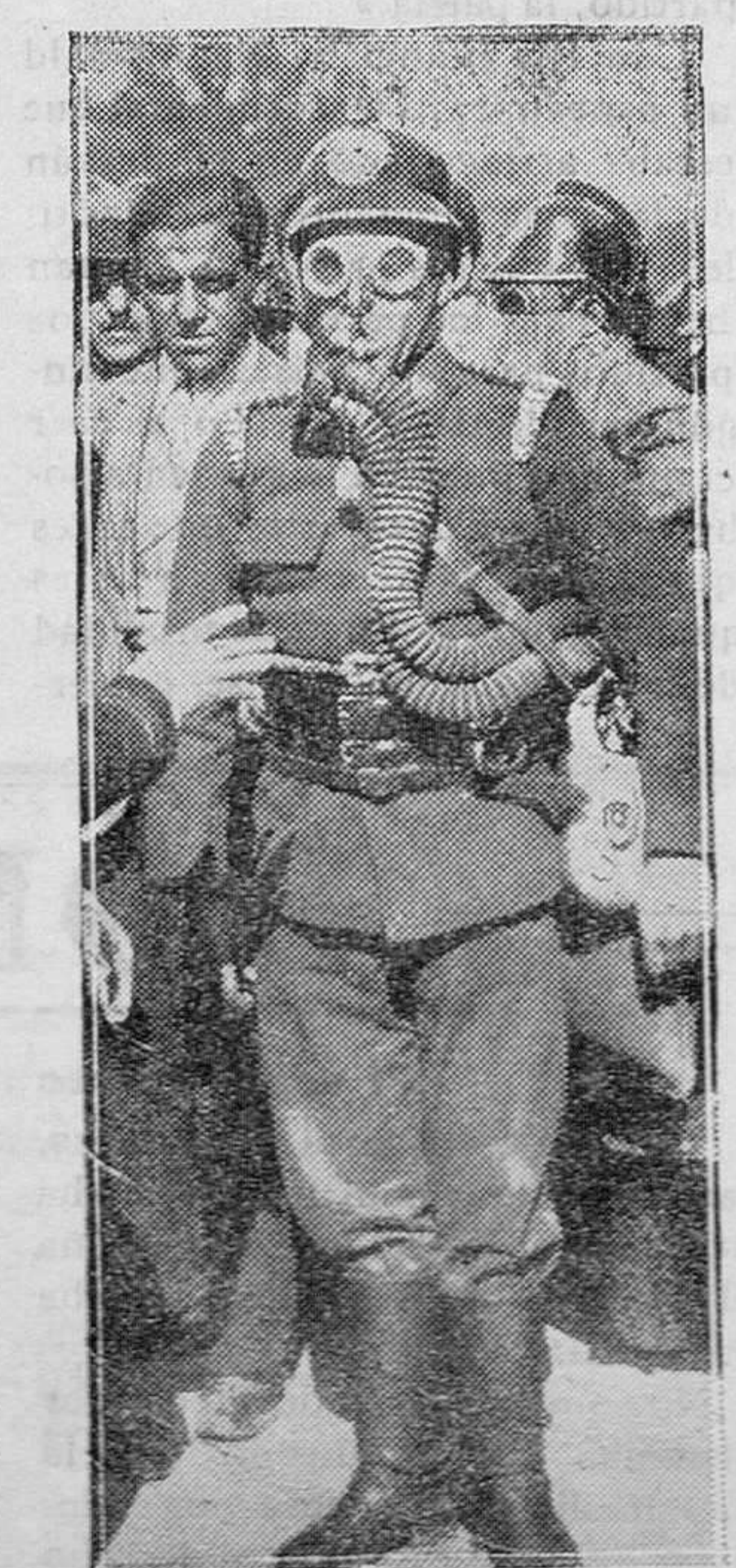
MADRID.—Con motivo del Congreso municipalista que se viene celebrando en Madrid, los bomberos han efectuado un simulacro en el Parque del Retiro

Otro comentarista perspicaz: el señor Sánchez Albornoz, de Acción Republicana (partido que, por cierto, también arde ahora en el mismo amor que los otros; y esto ya va a ser un verdadero lío). Según él, lo que ha hecho Inglaterra es comparable al pequeño retroceso de un atleta antes de dar un salto.