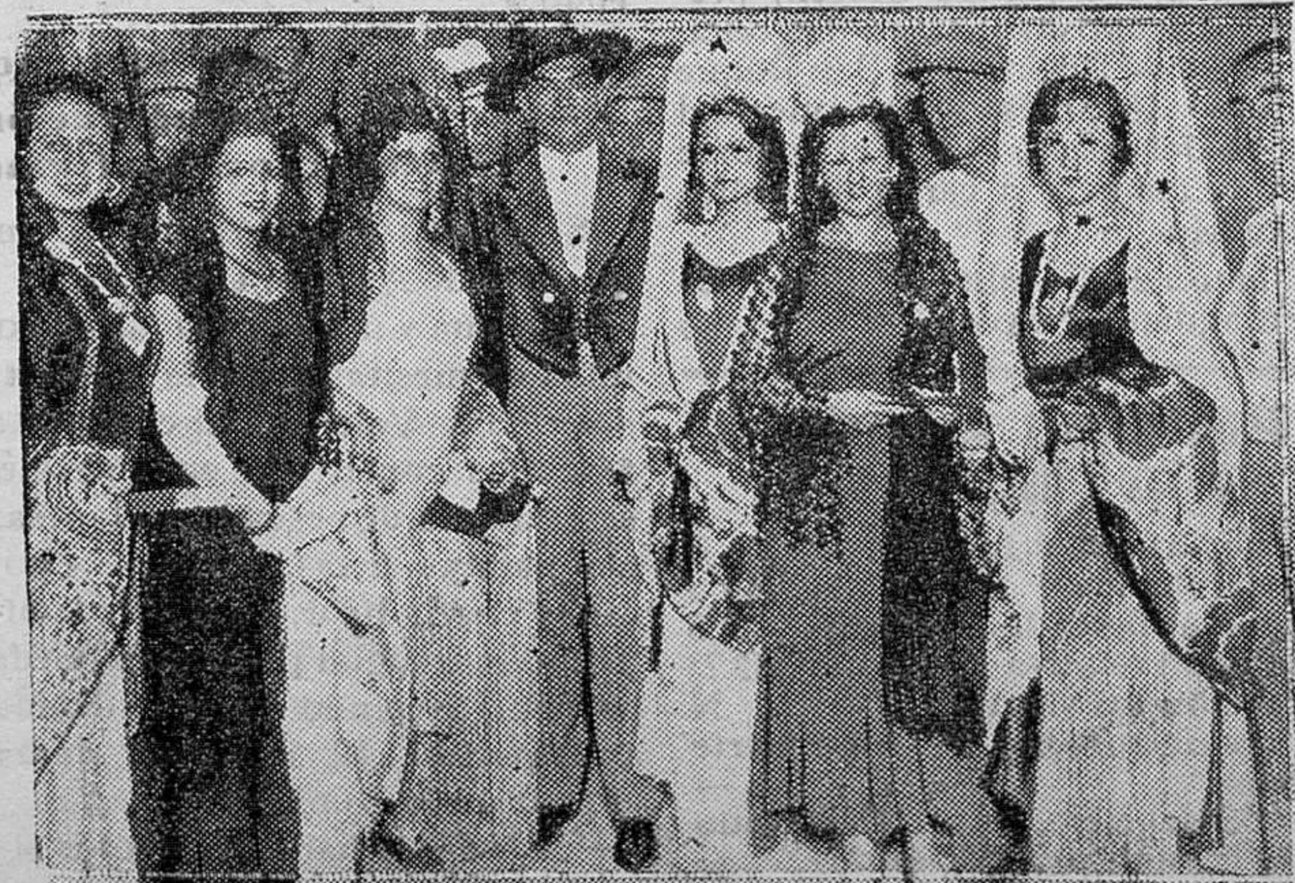
MADRID.—Las lindas artistas que presidieron el festival taurino celebrado en la Plaza de Toros de Madrid a beneficio de los hijos del infortunado «Sotillo». En el centro el matador de toros Cagancho