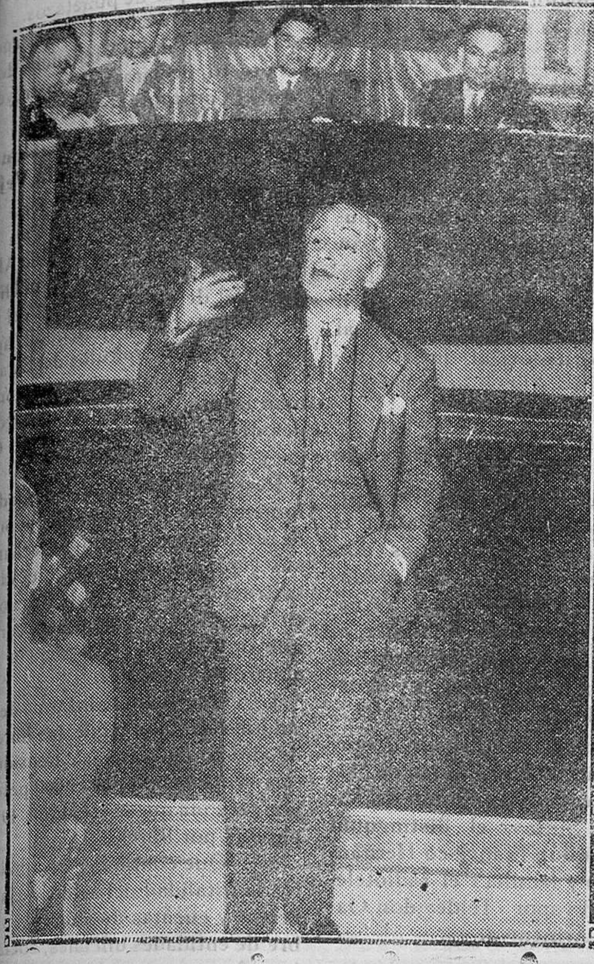
El ministro de Fomento al pronunciar un discurso en la accidentada reunión que celebró el partido radical socialista

Ante el significado de esos hechos, que deben enlazarse con aquellos otros genéricos relativos a la modificación de Ayuntamientos, constitución de Diputaciones provinciales, nombramientos de jueces municipales y demás medidas de Gobierno incompatibles con la expresión electoral de nuestras ideas, es impracticable toda lucha eficaz. A pesar de ello y de todo lo que aún es de temer, abrigamos la esperanza de que, sin organización, que es ya imposible; sin propaganda, que es de escasa utilidad; sin reflexiones criminales, y sin garantías de ningún linaje, la hondaraigambre del sentimiento monárquico español conseguirá en las Cortes