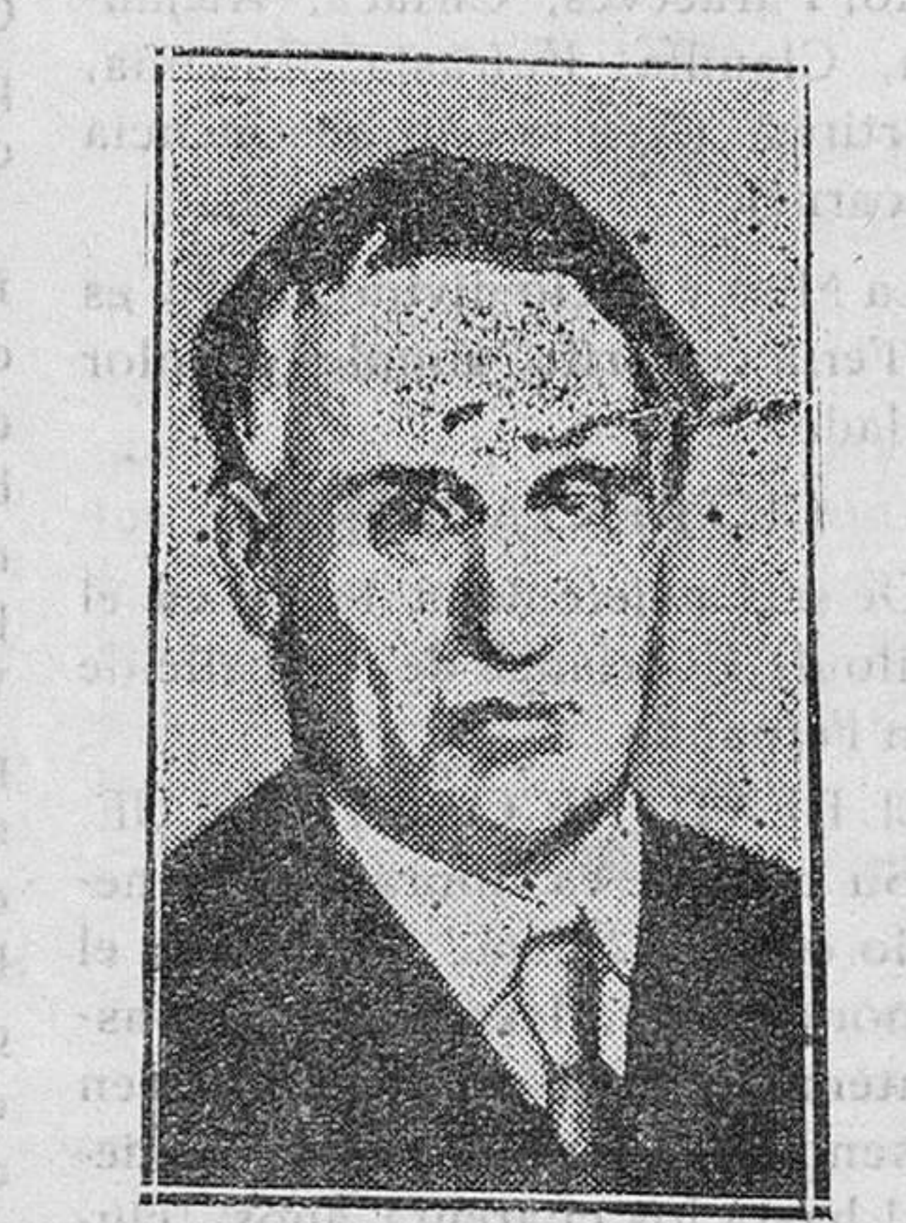
Sir Carlos Teveylan, ministro de Instrucción Pública del Gobierno laborista, que anunció su propósito de abandonar el Gabinete Mac-Donald, ante la imposibilidad de desarrollar su vasto plan educativo

OSCAR PEREZ SOLIS (Del «Diario de Barcelona»).