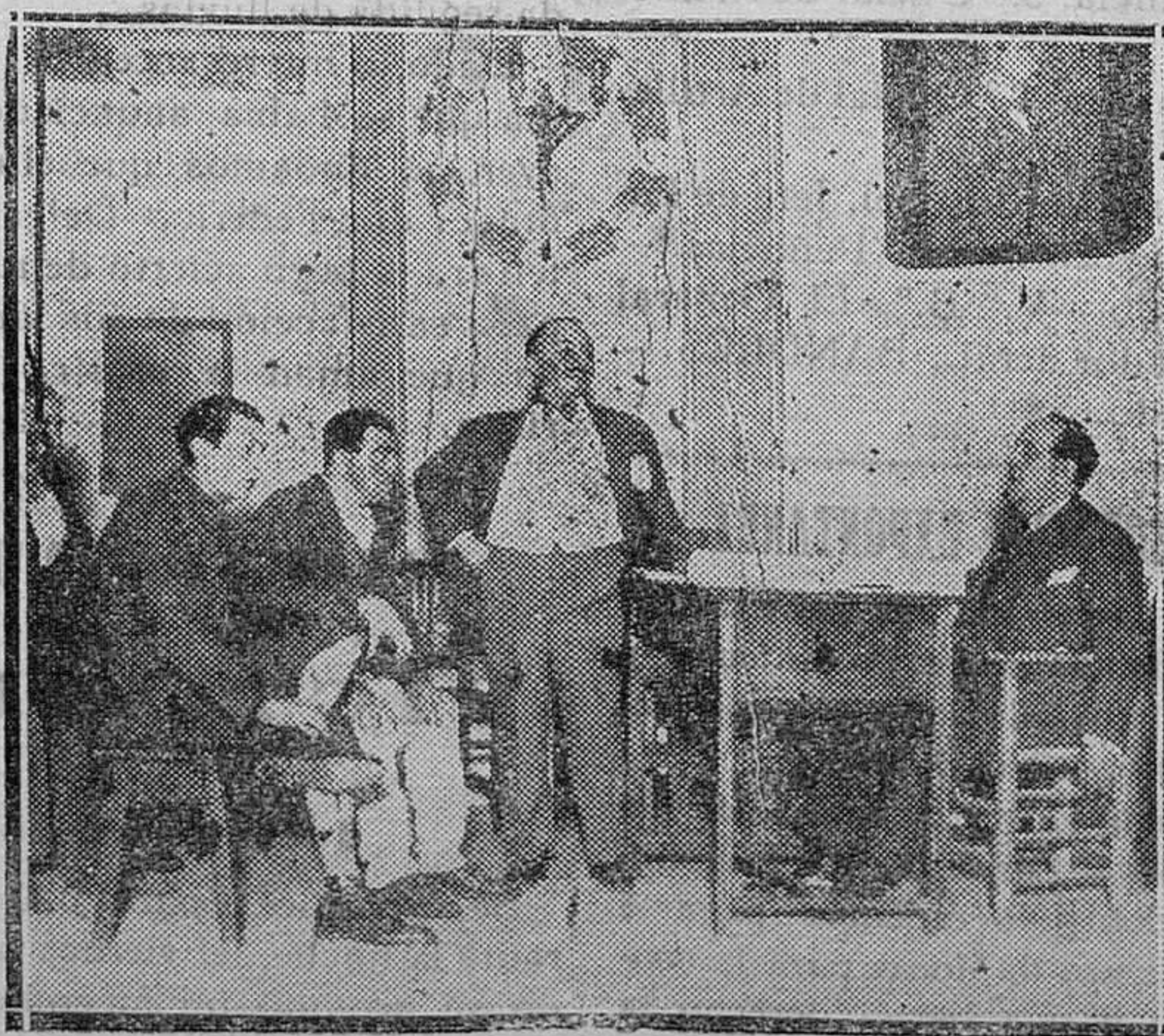
MADRID.—Una escena de la obra «La Academia», estrenada con gran éxito en el Teatro Cómico