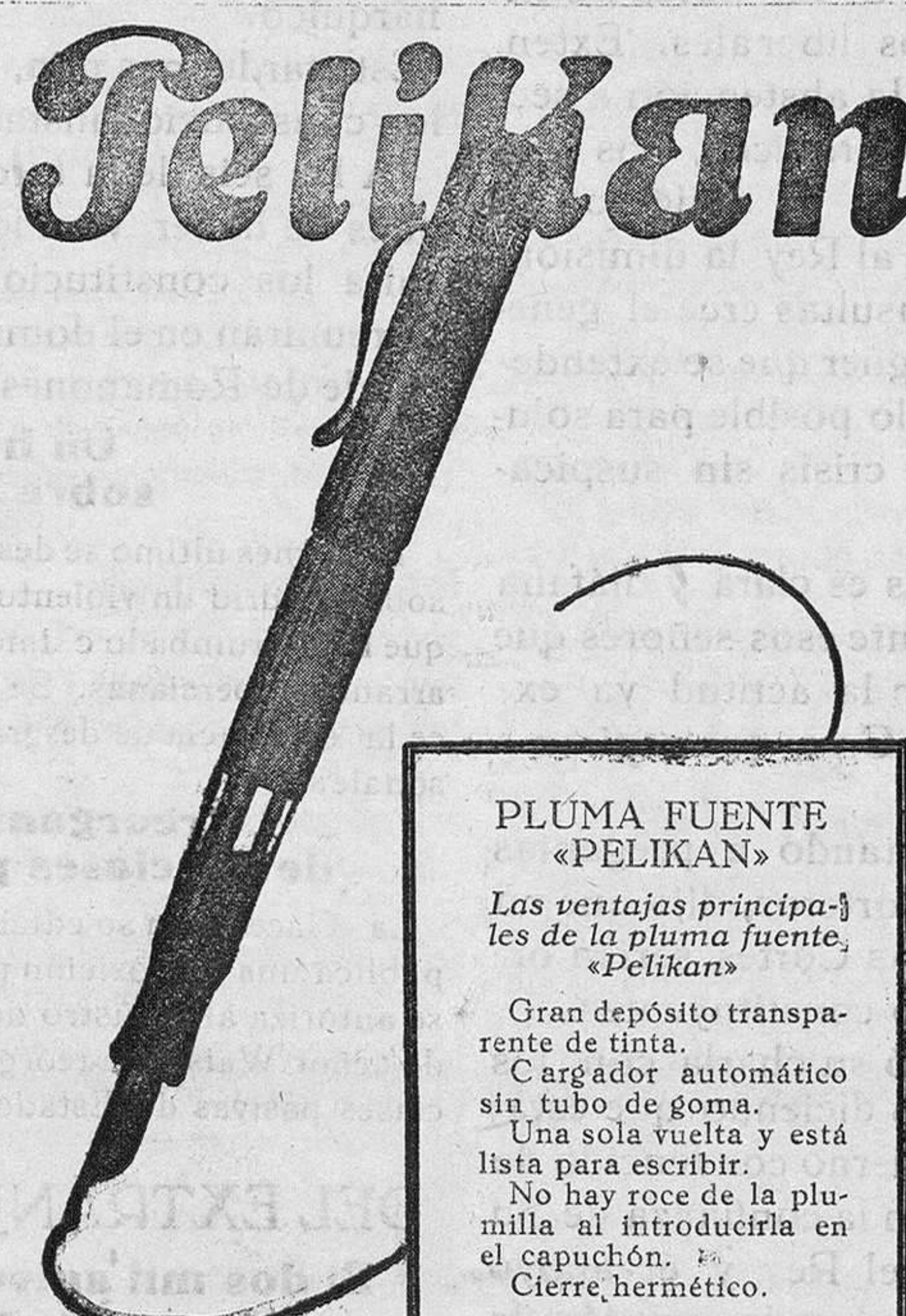
GANTHER WAGNER · HANNOVER UND WIEN