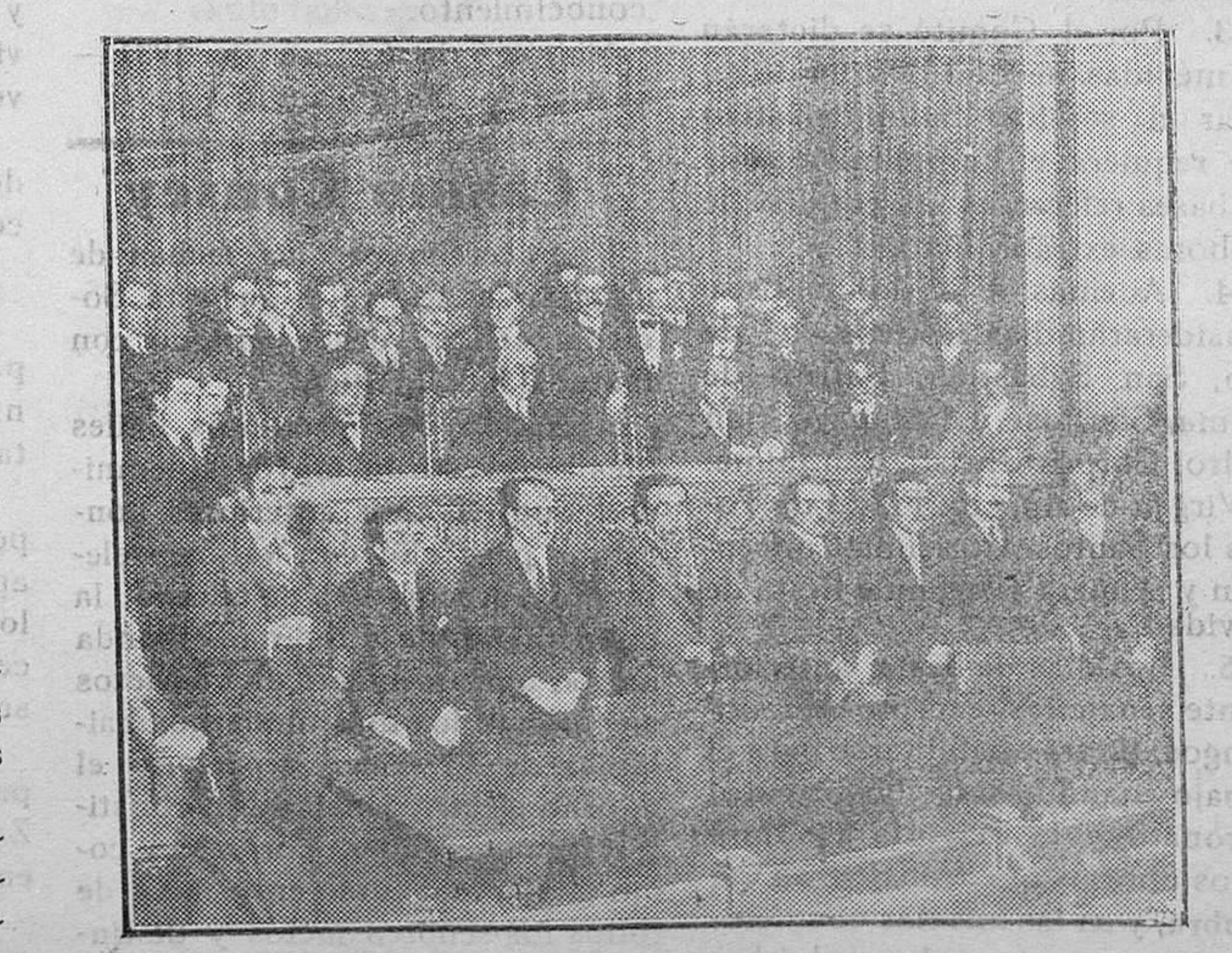
LA ACADEMIA IBEROAMERICANA DE HISTORIA POSTAL En el salón de actos de la Dirección de Comunicaciones celebró su primera sesión la recién constituida Academia Iberoamericana de Historia Postal

Capítulo 2.º Retribución 4.º Los salarios mínimos por jornada ordinaria de ocho horas serán los siguientes: Personal de Albañilería: Oficiales de 1.ª 8'00 pesetas, Oficiales de 2.ª 7'50, Oficiales de 3.ª 7'00, Peones 6'00.