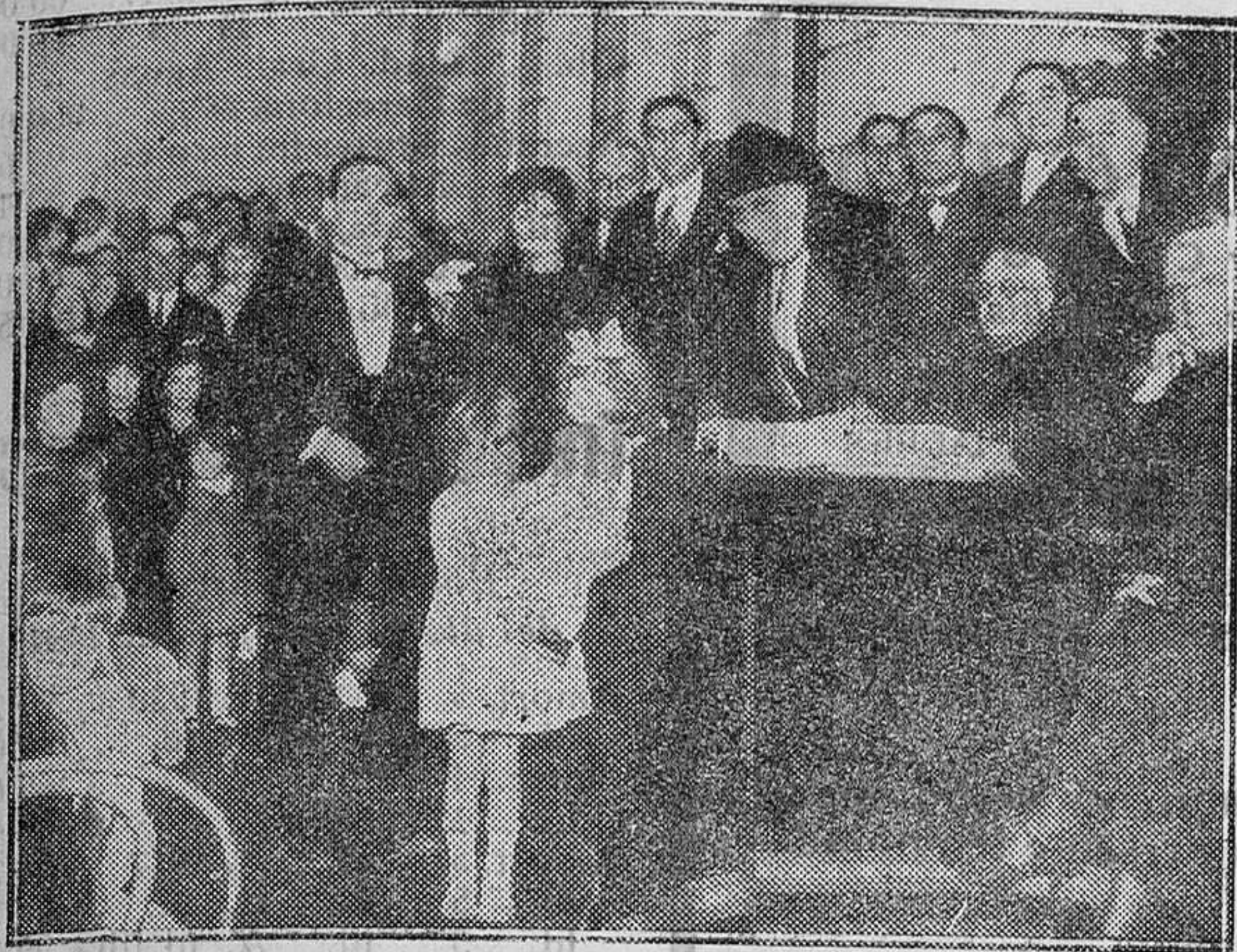
MADRID. — La fiesta pro Infancia. — Su Alteza la Infanta Doña María Luisa haciendo entrega de muñecas y juguetes a los niños