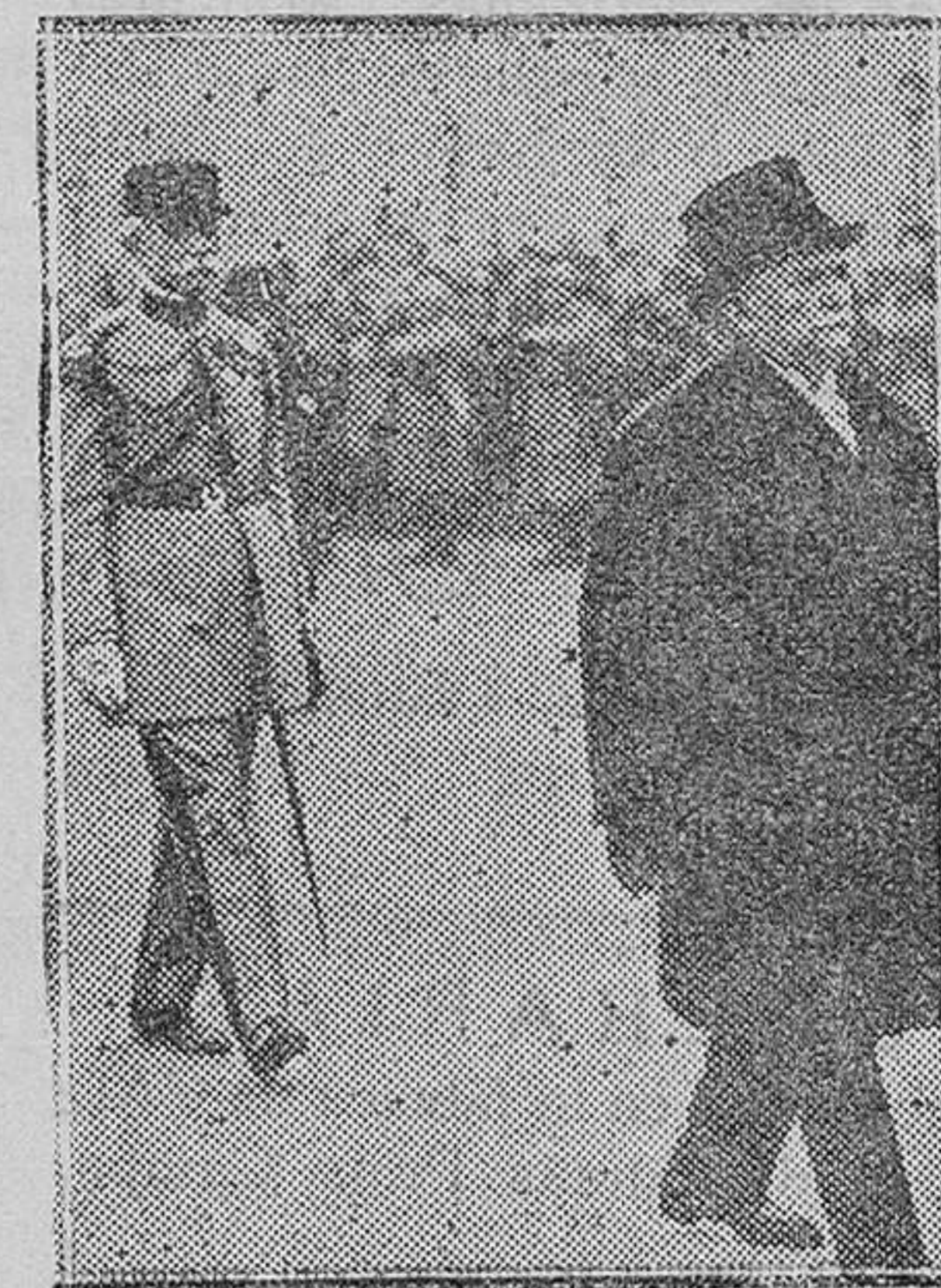
PARIS. — Entierro del Mariscal Joffre. — El señor Doumergue, en la presidencia del duelo, seguido del general Jefe de su Casa Militar y del Secretario General de la Presidencia

Ahora Mussolini, en vista del gran prestigio cobrado por Balbo en su vuelo de Italia a Brasil, y de las condiciones sanas de patriotismo, valor y disciplina, demostradas por Balbo, le va a confiar dos Ministerios, asociándole íntima y directamente a su obra política. Balbo irá en ese periodo de colaboración formándose como hombre de gobierno, y llegará día en que Mussolini, próximo a la década de ejercicio del mando, pueda traspasar a las manos de Balbo las riendas del país.