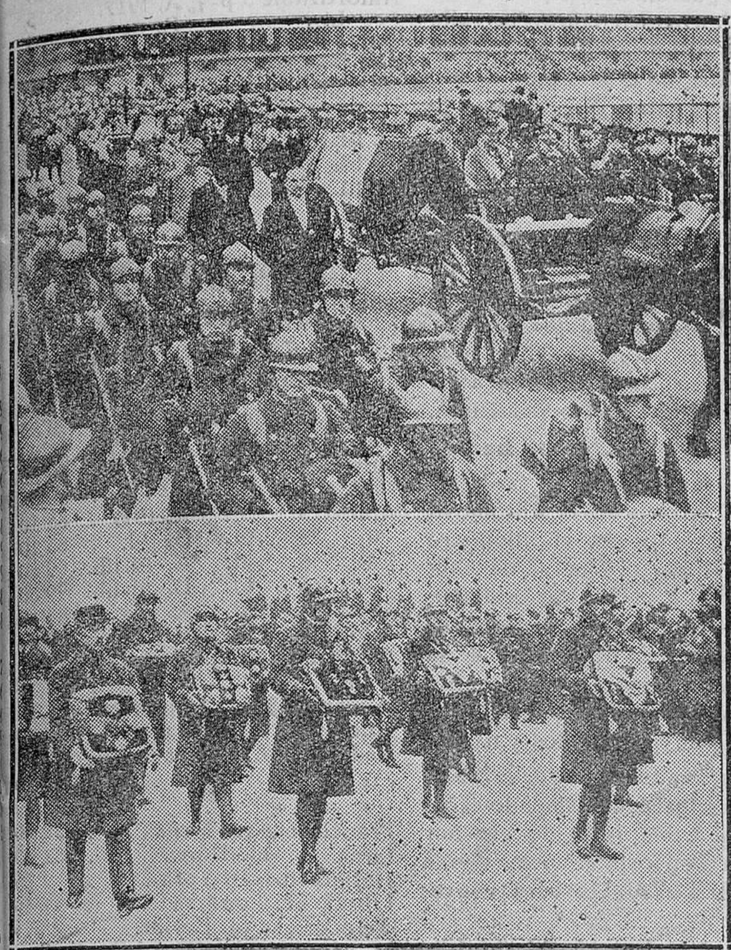
PARIS. — Entierro del mariscal Joffre, viéndose el ataúd en un armón de Artillería, delante de la Explanada de los Inválidos. — Abajo: soldados siendo portadores de las decoraciones del insigne caudillo