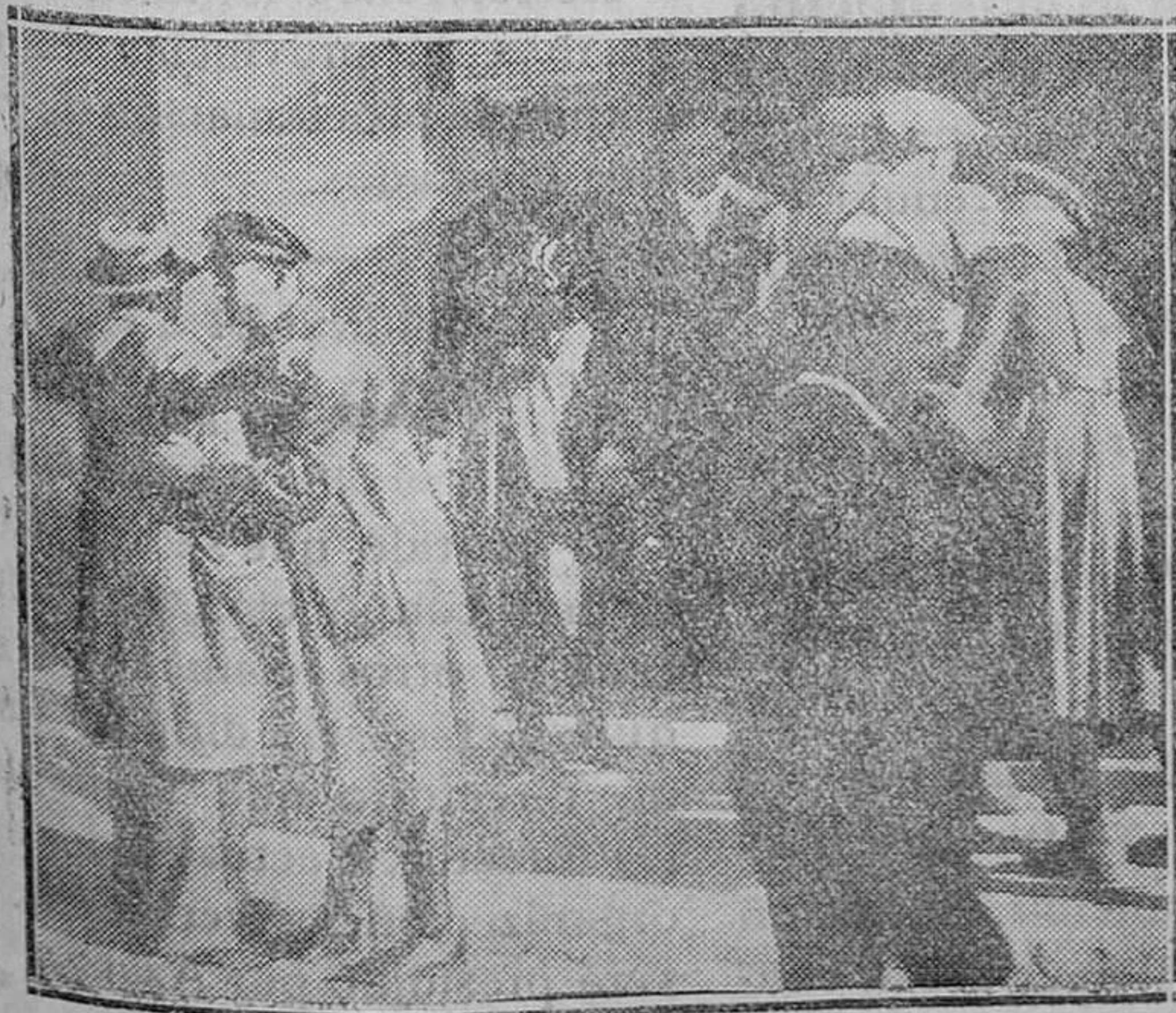
LA HUELGA DE DEPENDIENTES EN BARCELONA Los guardias de Asalto cachean al público en lugares peligrosos