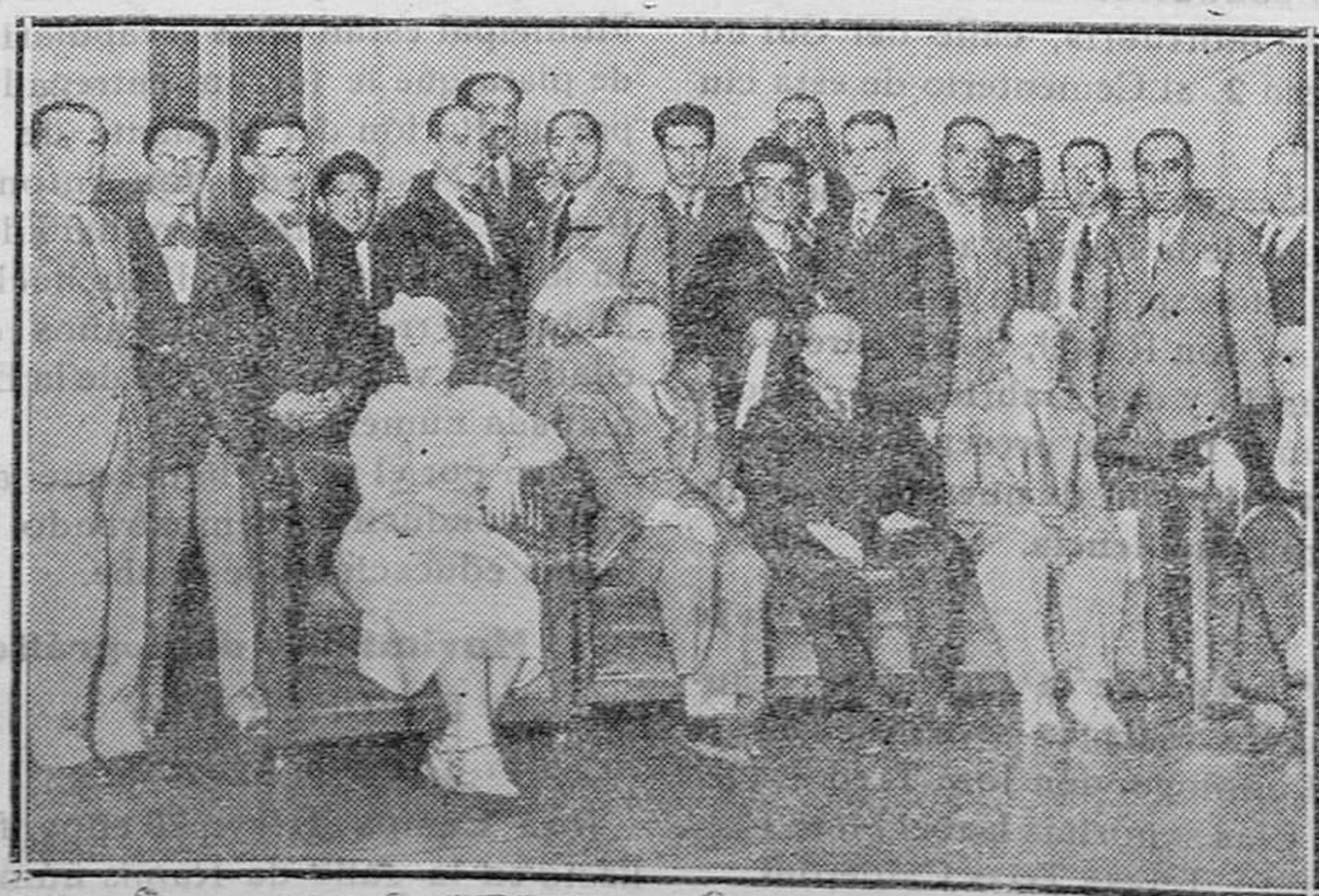
MADRID.—Grupo de asistentes al acto inaugural de la Asamblea de Conservatorios de Música y Declamación de España, que ha tenido lugar en el local de la Junta Nacional de Música.