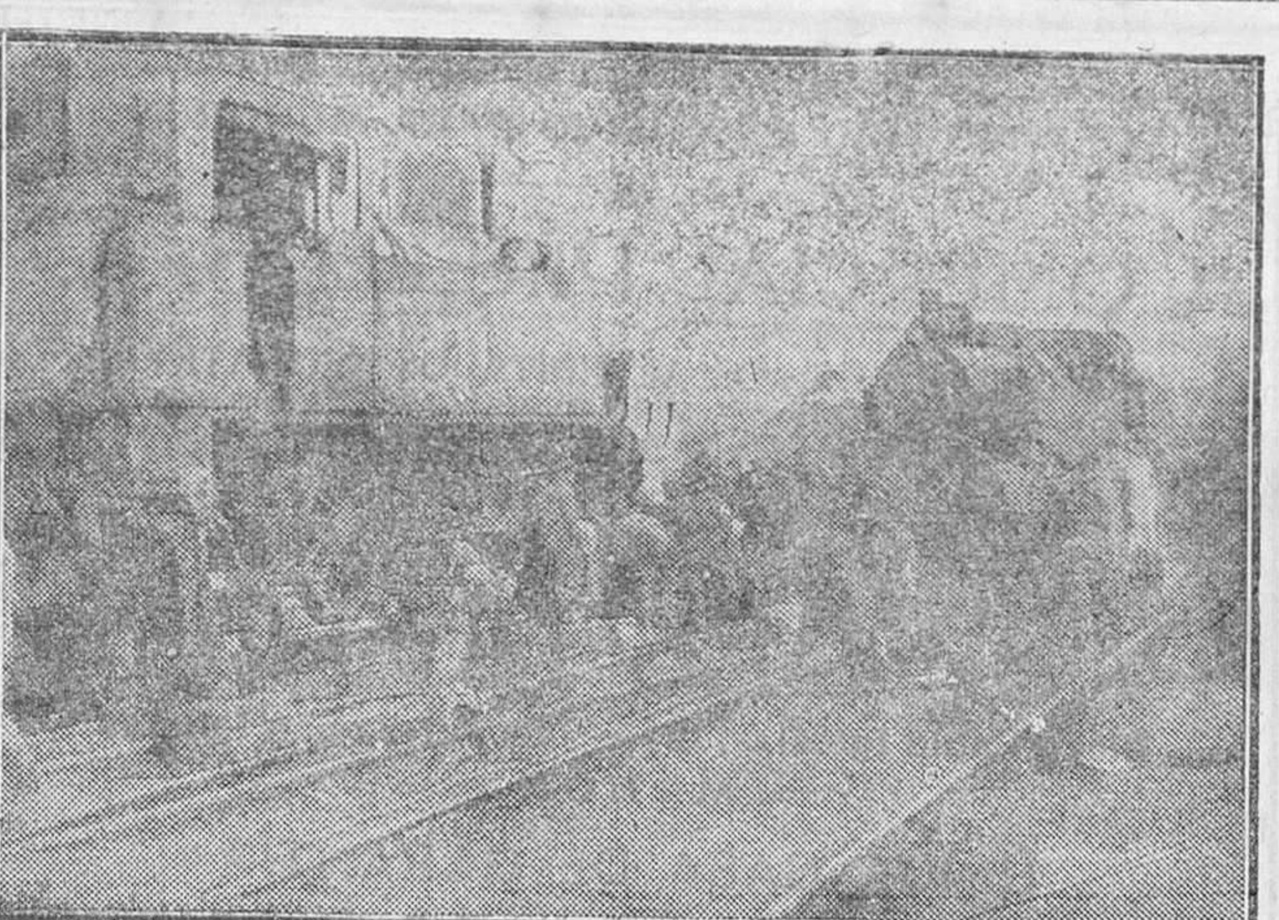
MADRID.—Grave accidente ferroviario.—El tren omnibus de Toledo y el tranvía de Getafe chocaron en un cruce, resultando un muerto y varios heridos. Estado de las máquinas después del accidente.