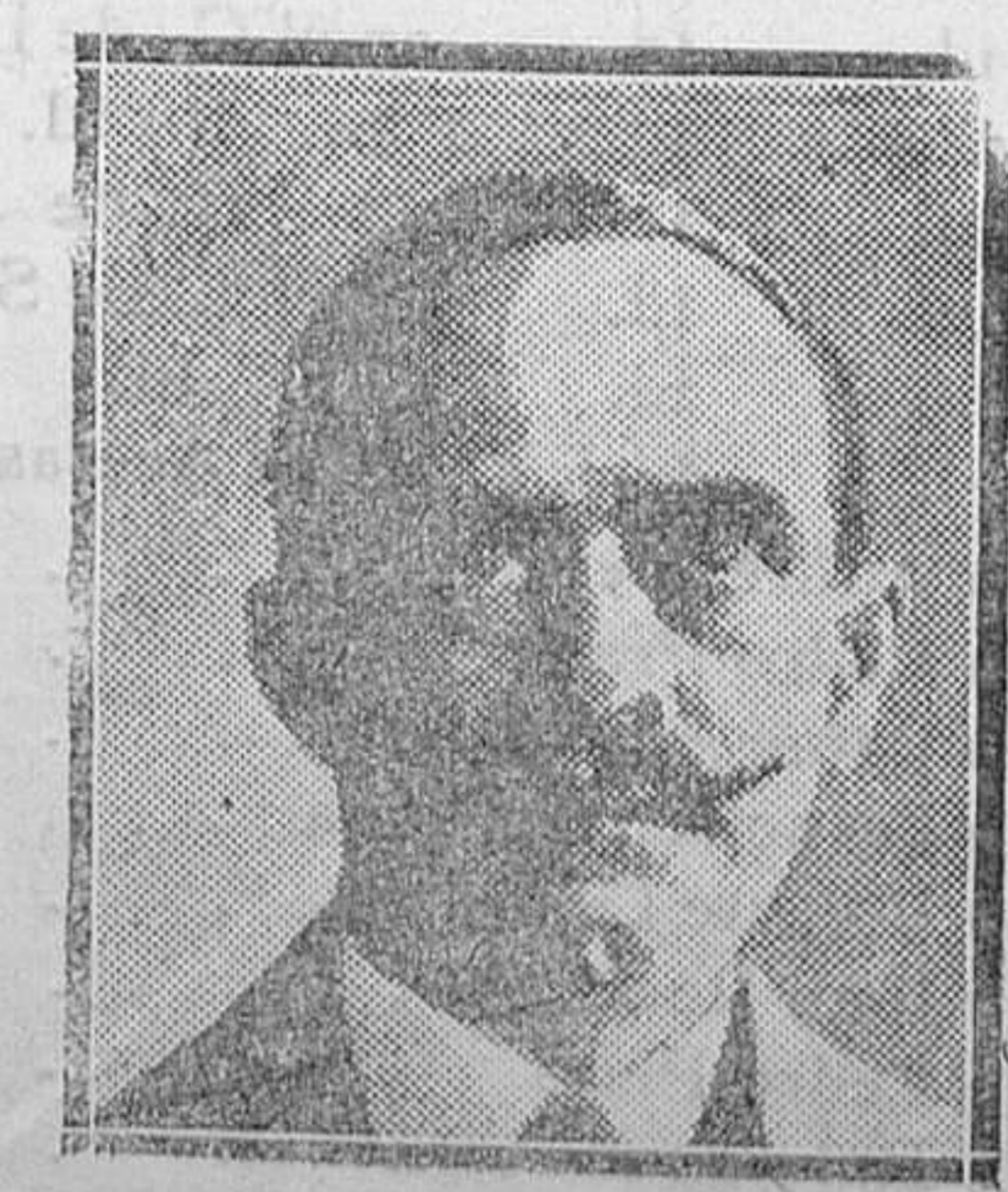
EXTRANJERO.—El republicano general Plastras, que destruyó al rey Constantino, ordenó el fusilamiento de un general y 6 ex ministros y proclamó la Dictadura militar en Grecia.

No vamos a hacer aquí la biografía del ilustre novelista. La vida de Alarcón está en la memoria de todos los españoles de hoy, por ser una de las figuras más simpáticas de nuestra historia literaria contemporánea. Gran parte de su vida está reflejada por el novelista