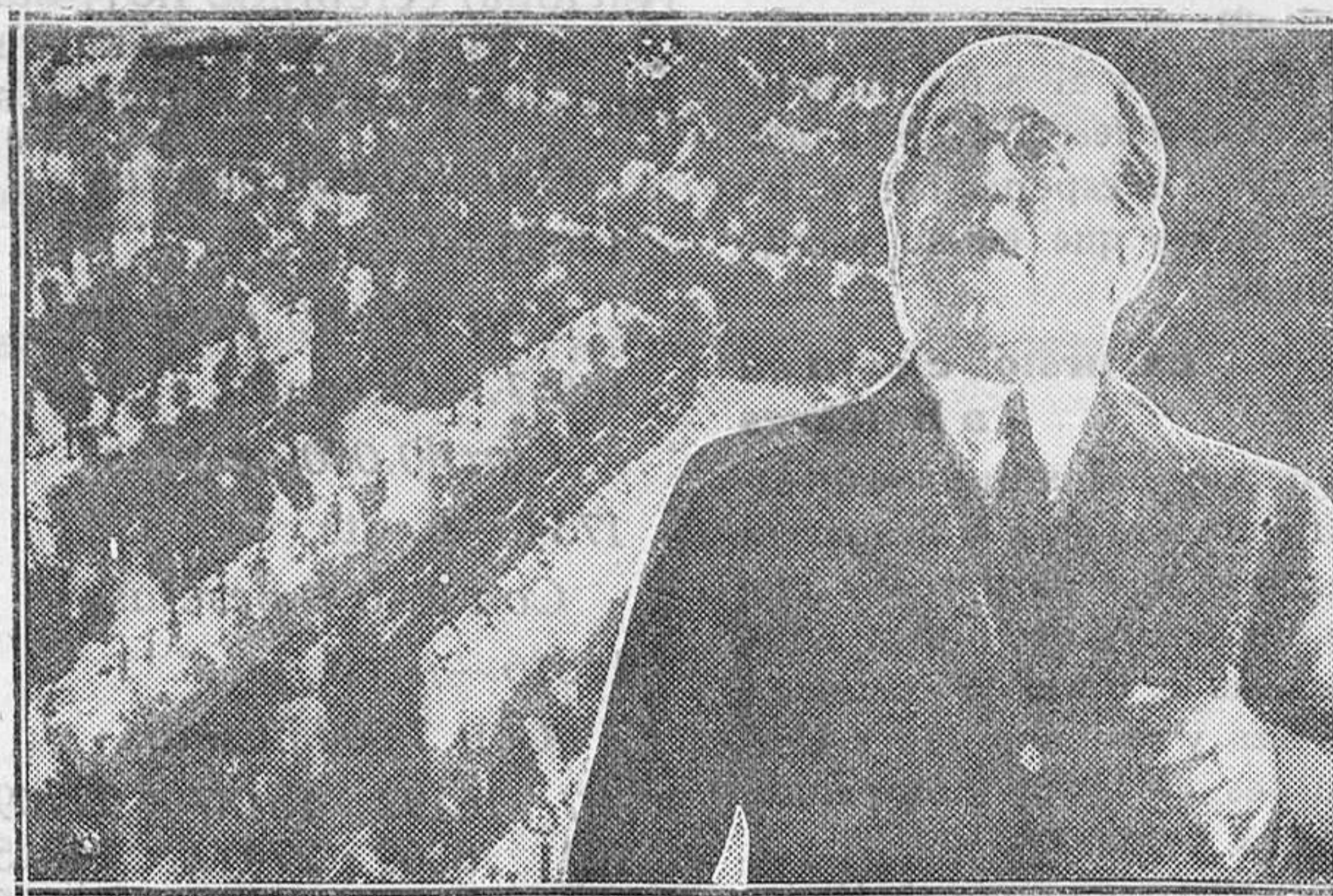
El banquete a don Manuel Azaña, celebrado en el Frontón Central. En el fondo de la foto un aspecto del salón y en silueta Azaña en un momento de su discurso