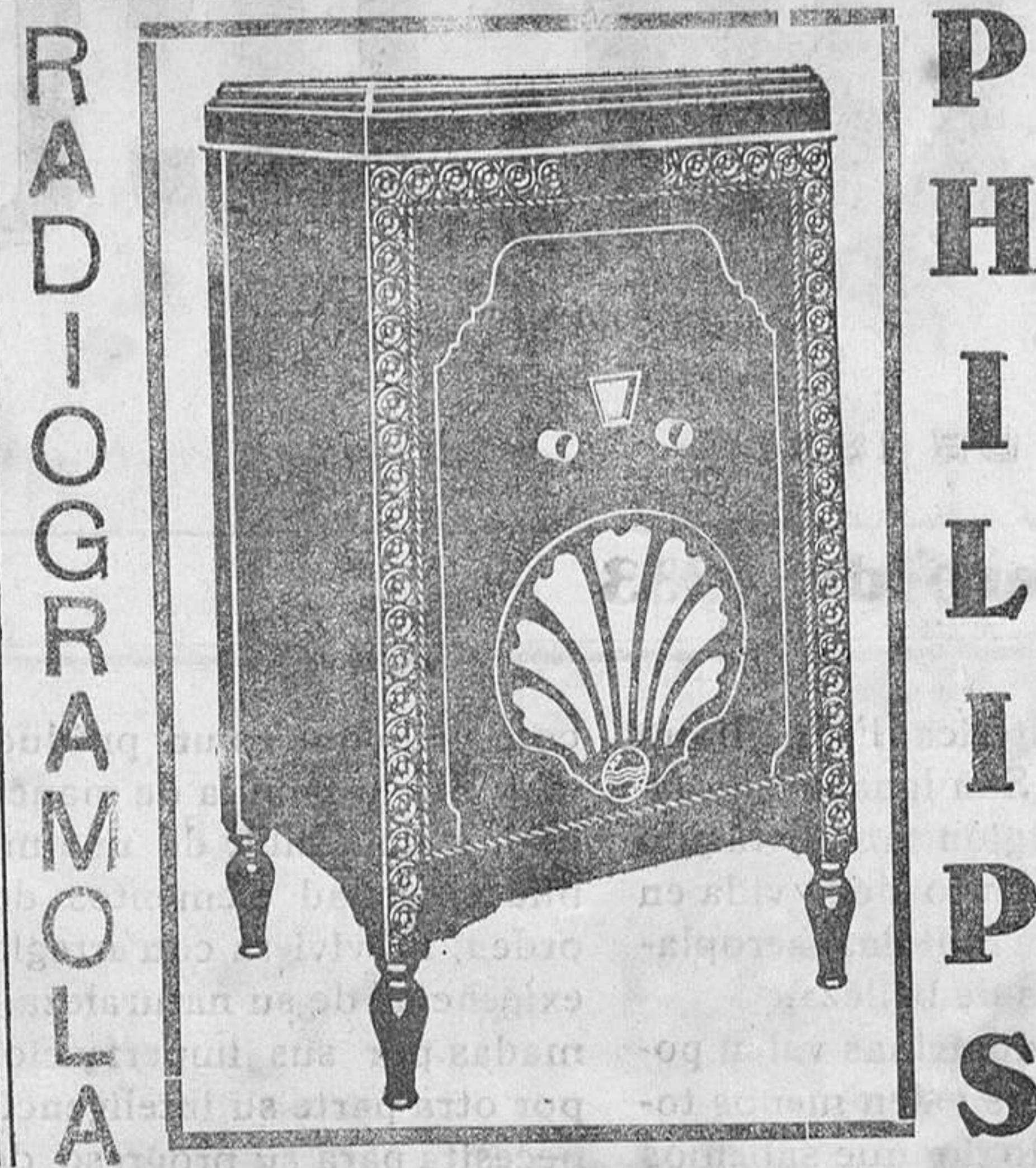
NUEVO MODELO 870-A y C

También pagamos los cupones de otros valores, siempre que su importe líquido nos sea conocido.