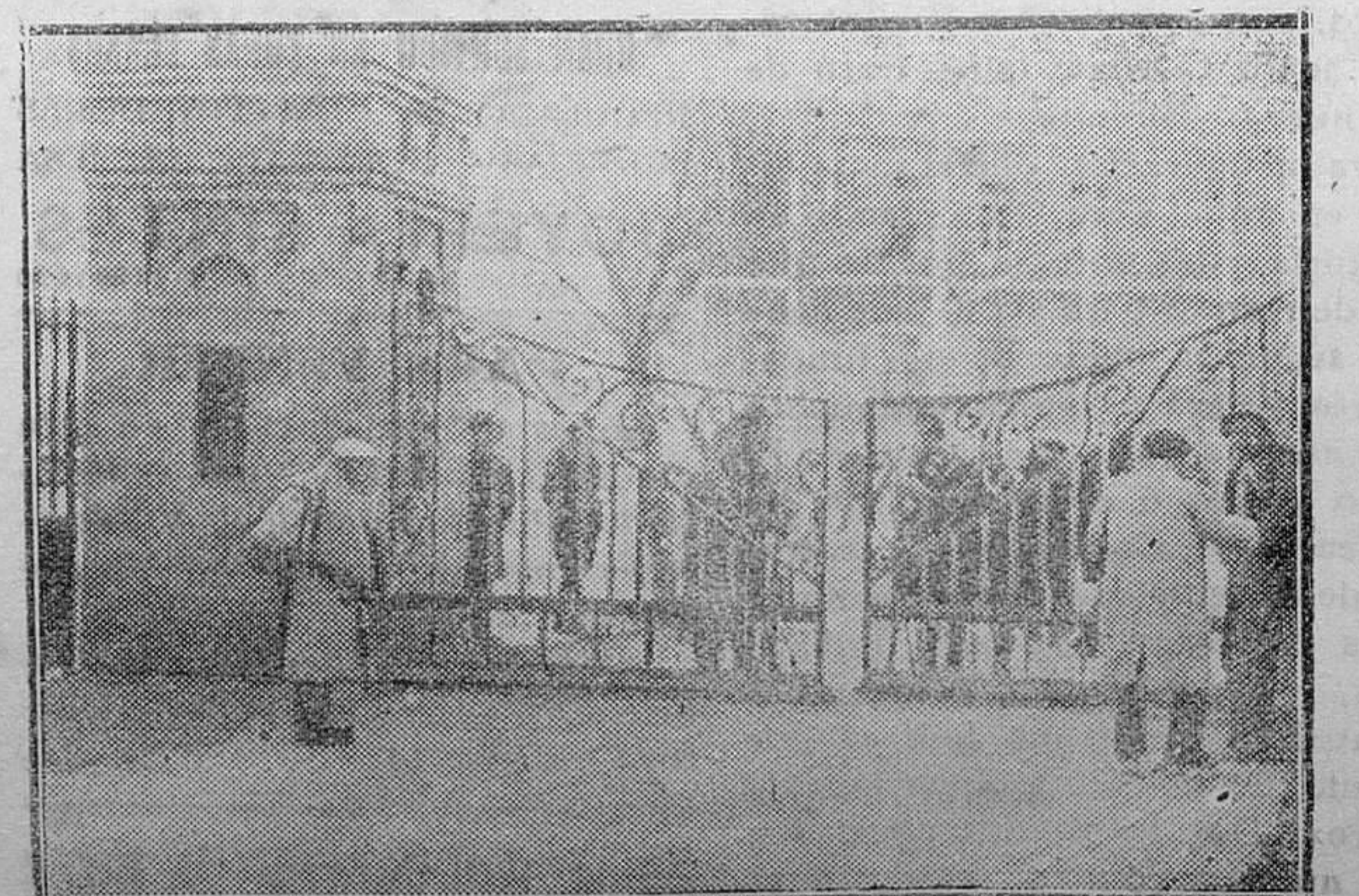
MADRID.— La entrada al aeródromo de Cuatro Vientos, donde llegaron tiroteando los comunistas

Nos parece ocioso declarar que la F. A. I. es una organización peligrosísima. De la rebeldía, de la lucha abierta, no sólo contra la Re-