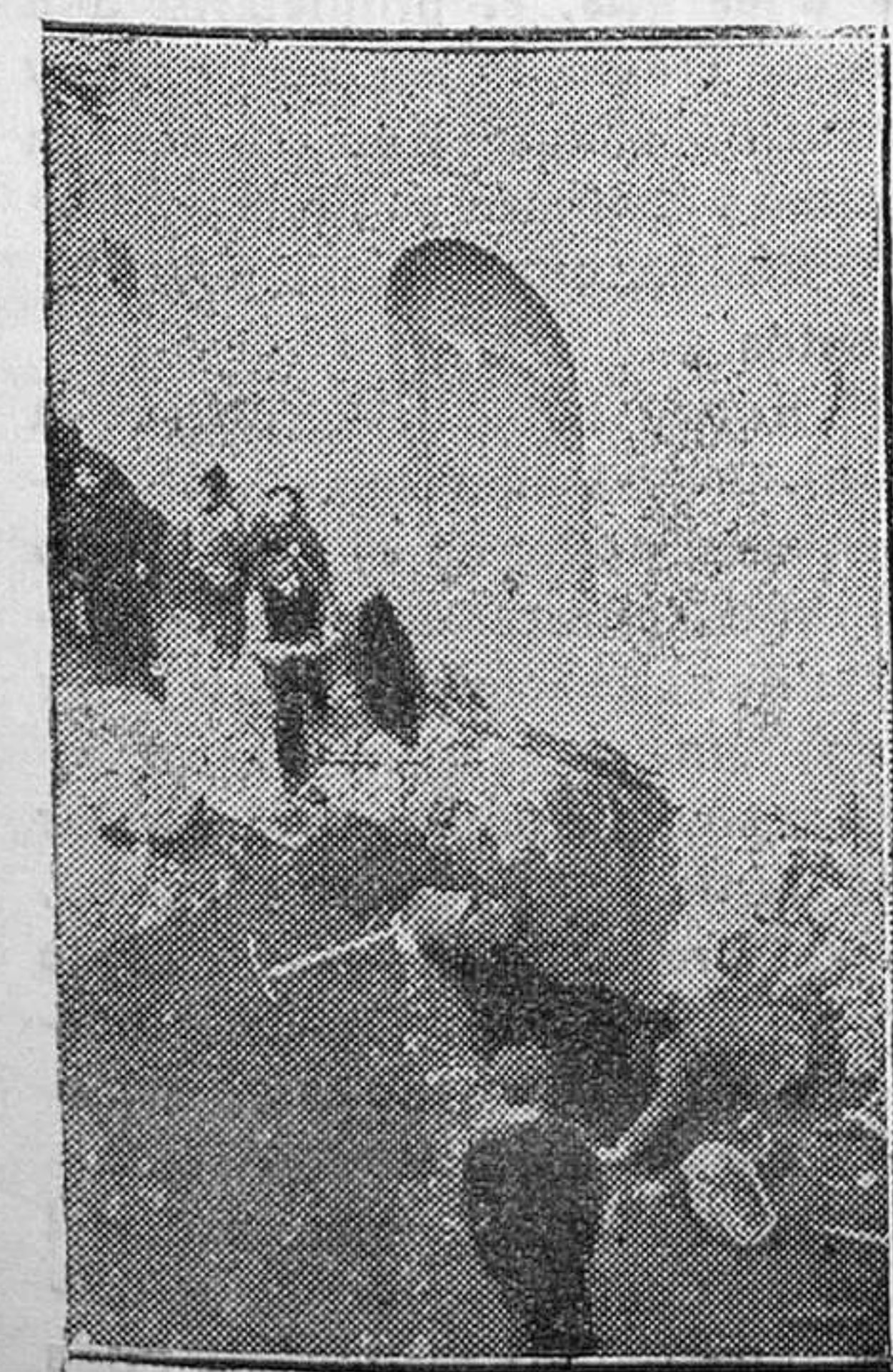
Destrozos causados por una bomba en la fábrica del Gas de Barcelona

sus anuncios de volver a esclavizarlo, de restaurar la terrible odisea de los encarcelamientos, de las deportaciones, de la ejecución cruel sin formación de sumaria, del engaño de tantas y tantas criaturas como esperaban mayor bienestar y cayeron de pronto en la locura que produce la falta de trabajo, el hambre y el espíritu de destrucción, con ausencia de todo sentimiento fraternal. ¡Reconquistar la República! Lo que quieren reconquistar es el manantial milagroso, aunque laico, de donde salen todos los provechos que permiten una vida terrenal fastuosa y tranquila, aunque para ello sea necesario adormecer los gritos de la conciencia.