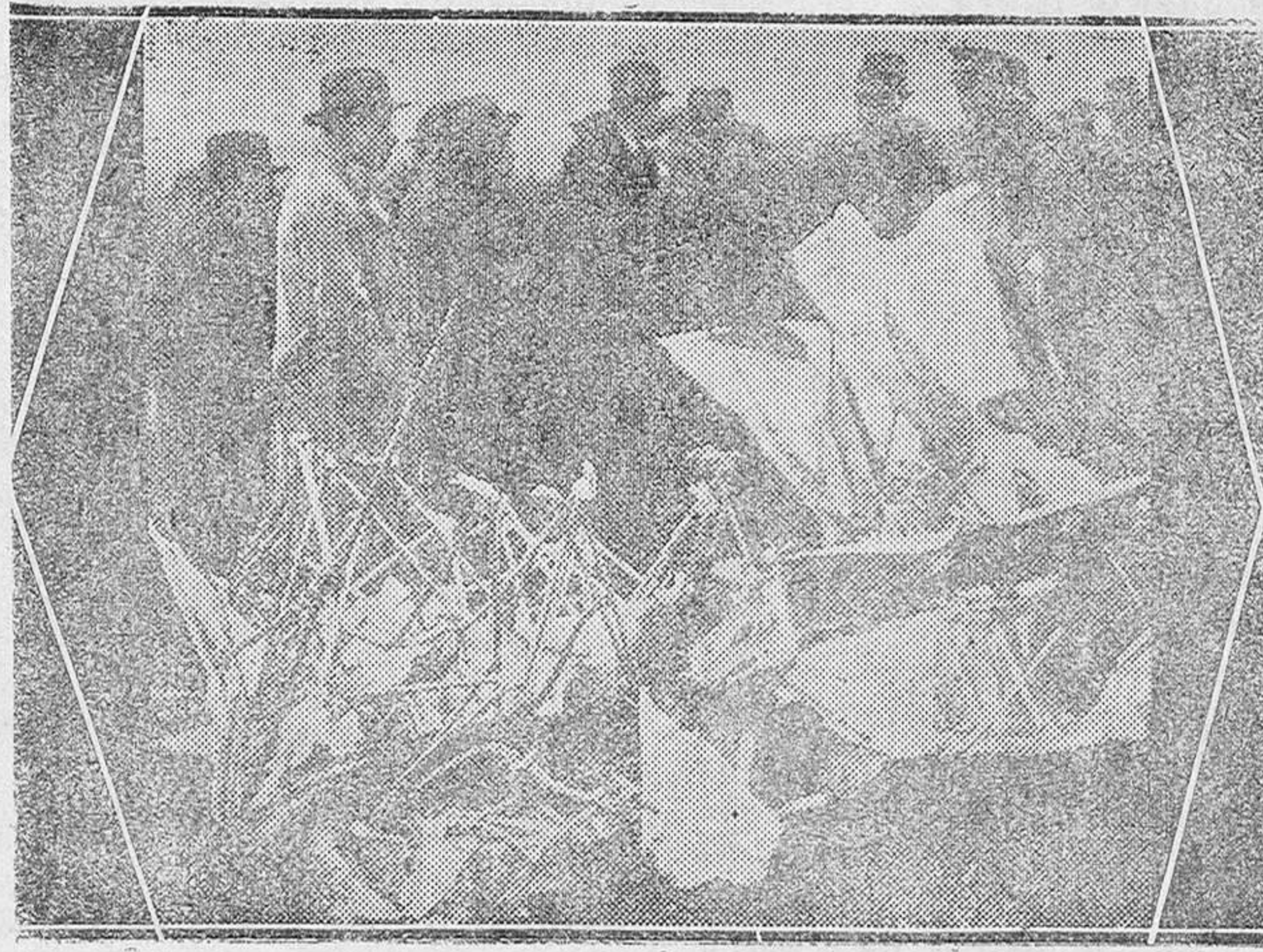
CATÁSTROFE DEL «EMERAUDE». — Estado en que quedó el trimotor