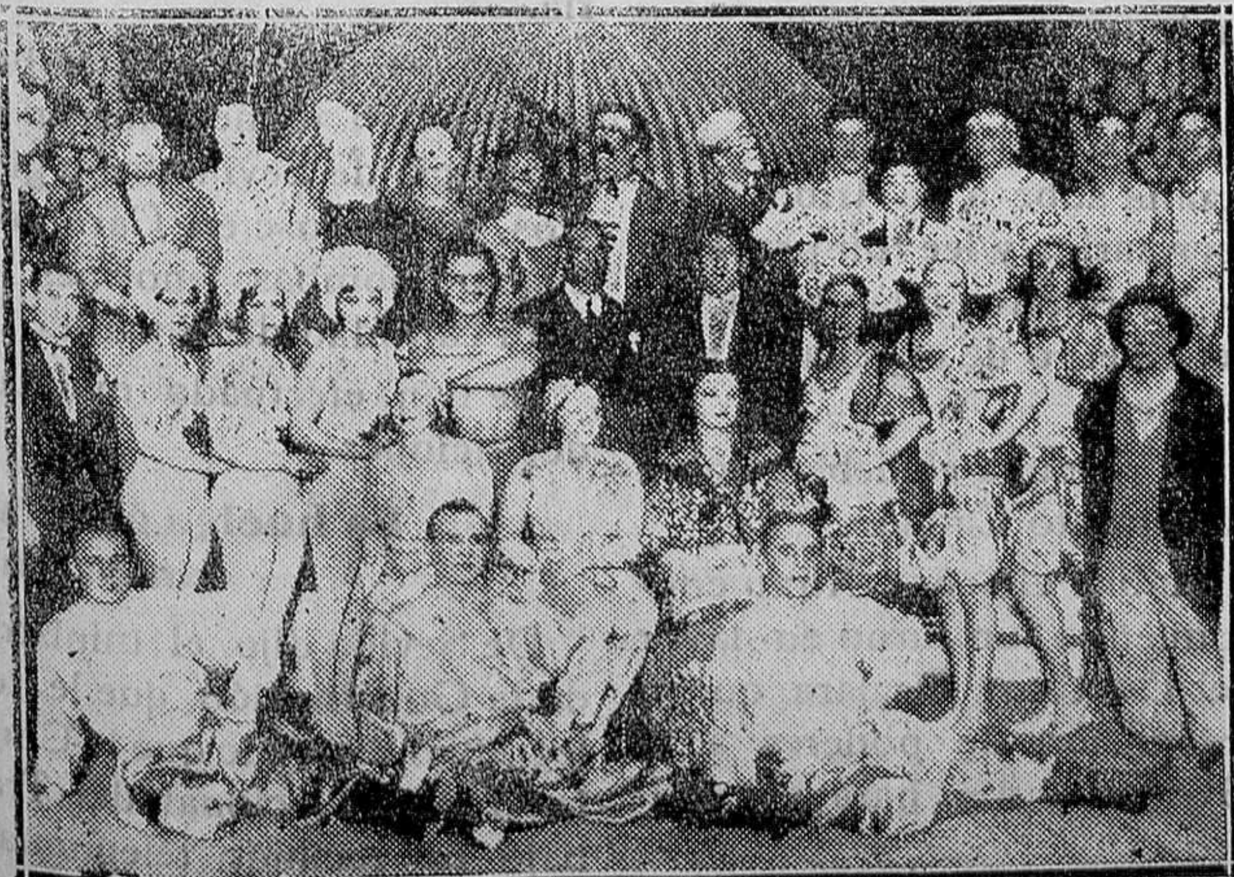
MADRID.—La nueva compañía de circo presentada en el Circo Price, que ha sido recibida por el público con grandes aplausos por su notable y entretenido trabajo

2.º Que para las operaciones agrícolas cuya realización requiera de los obreros una práctica y conocimientos especiales, de manera que sin éstos pueda sobrevenir perjuicio en la cosecha, solamente serán preferidos los obreros de la vecindad sobre los forasteros cuando aquéllos tengan la necesaria aptitud.