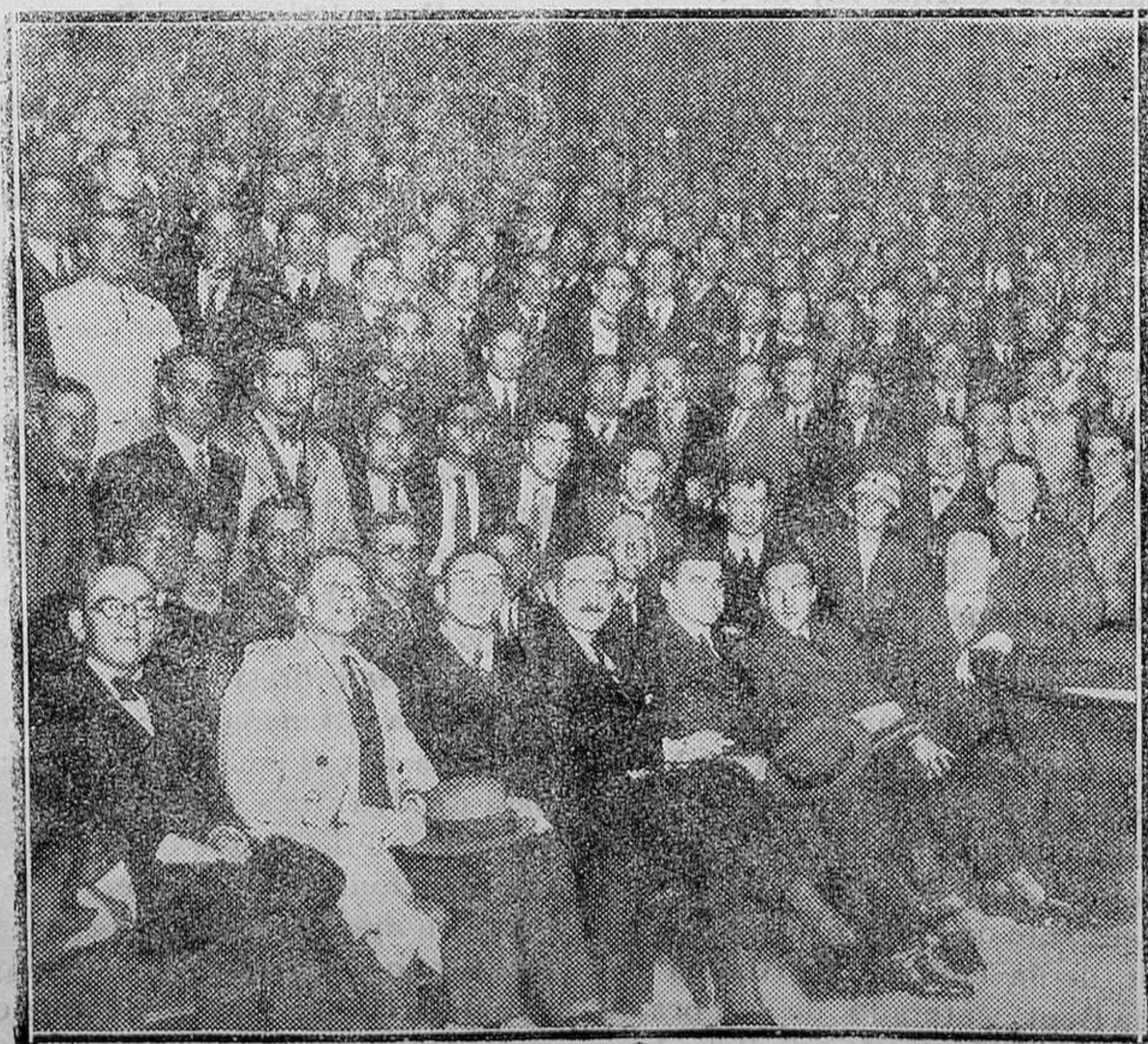
MADRID.—Sesión celebrada con motivo del IX Congreso Internacional de Cirugía

Otra nota de actualidad es el viaje a la capital de la provincia del Alcalde y Secretario del Ayuntamiento de Ferrerías llamados por el señor Gobernador.