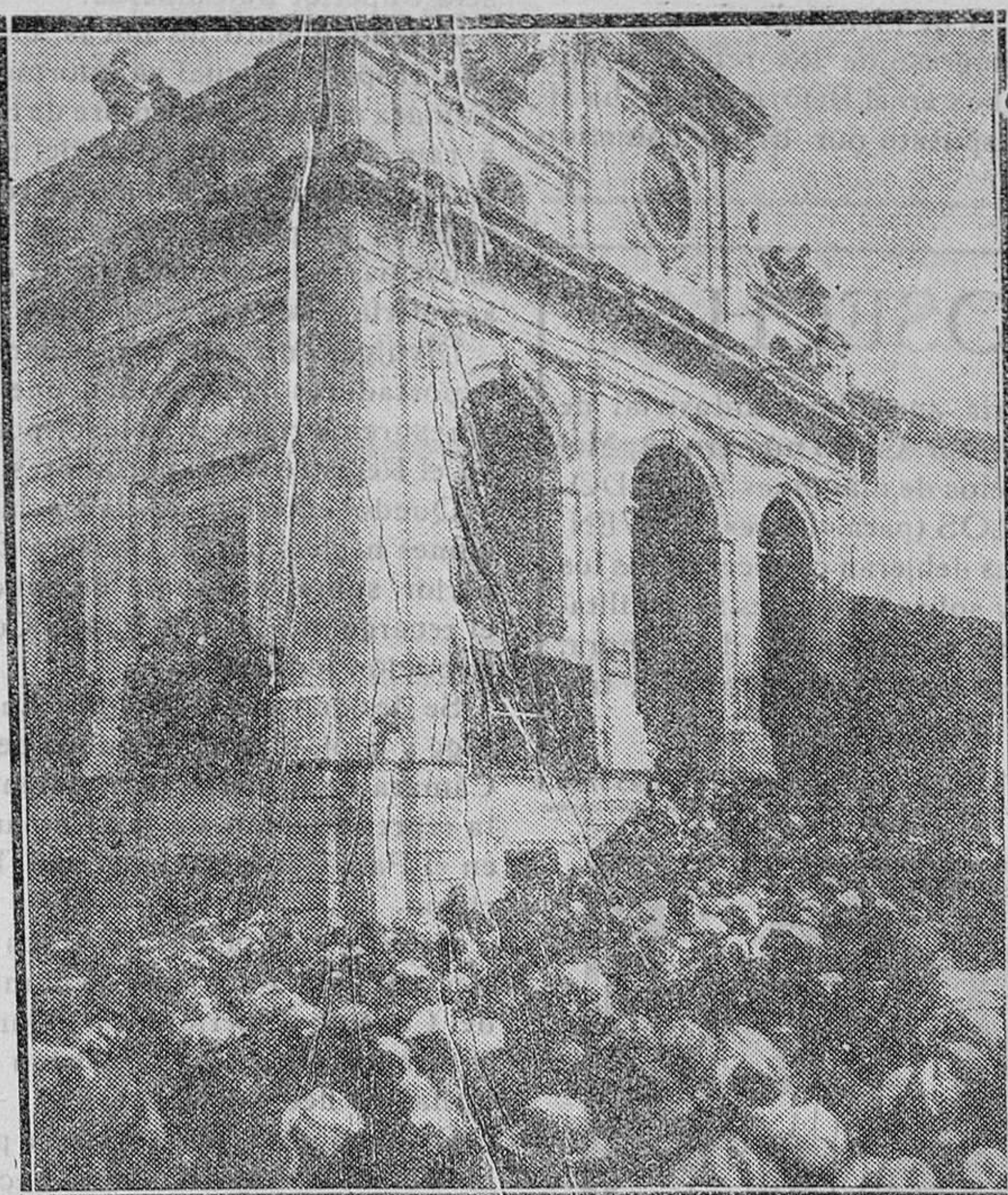
DEL VIAJE PRESIDENCIAL.—El excelentísimo señor Presidente de la República, con las señoritas premios de belleza, en el balcón del Ayuntamiento de esta ciudad

La Misa y oficio divino de hoy es de la Infracitava de San José, Esposo de la Santísima Virgen, con rito semidoble y color blanco.