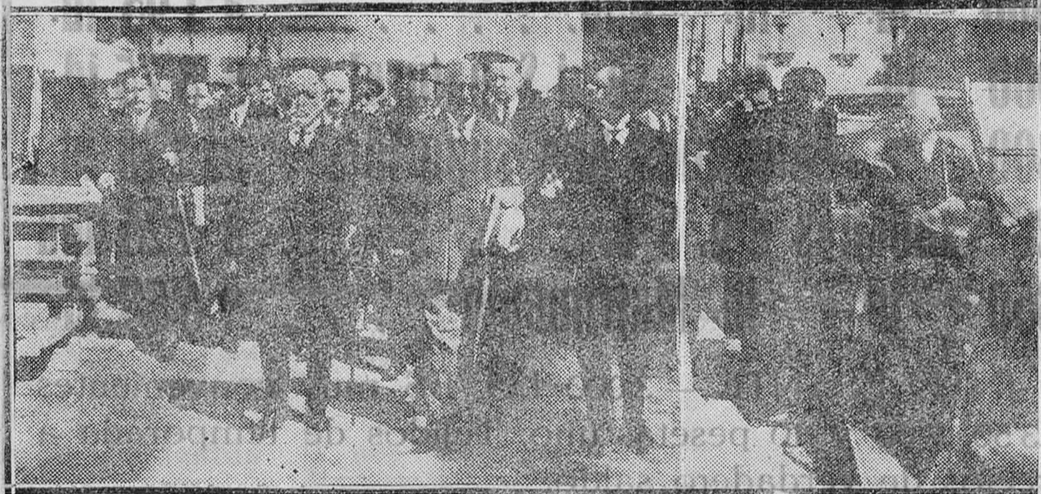
CARTAGENA.—Visita del Presidente. En primer término el Presidente de la República, los ministros de Obras Públicas y Marina y las autoridades, durante la visita al puerto. A la derecha el ministro de Agricultura, despidiendo al señor Alcalá Zamora al marchar éste al muelle para embarcar con rumbo a Baleares.