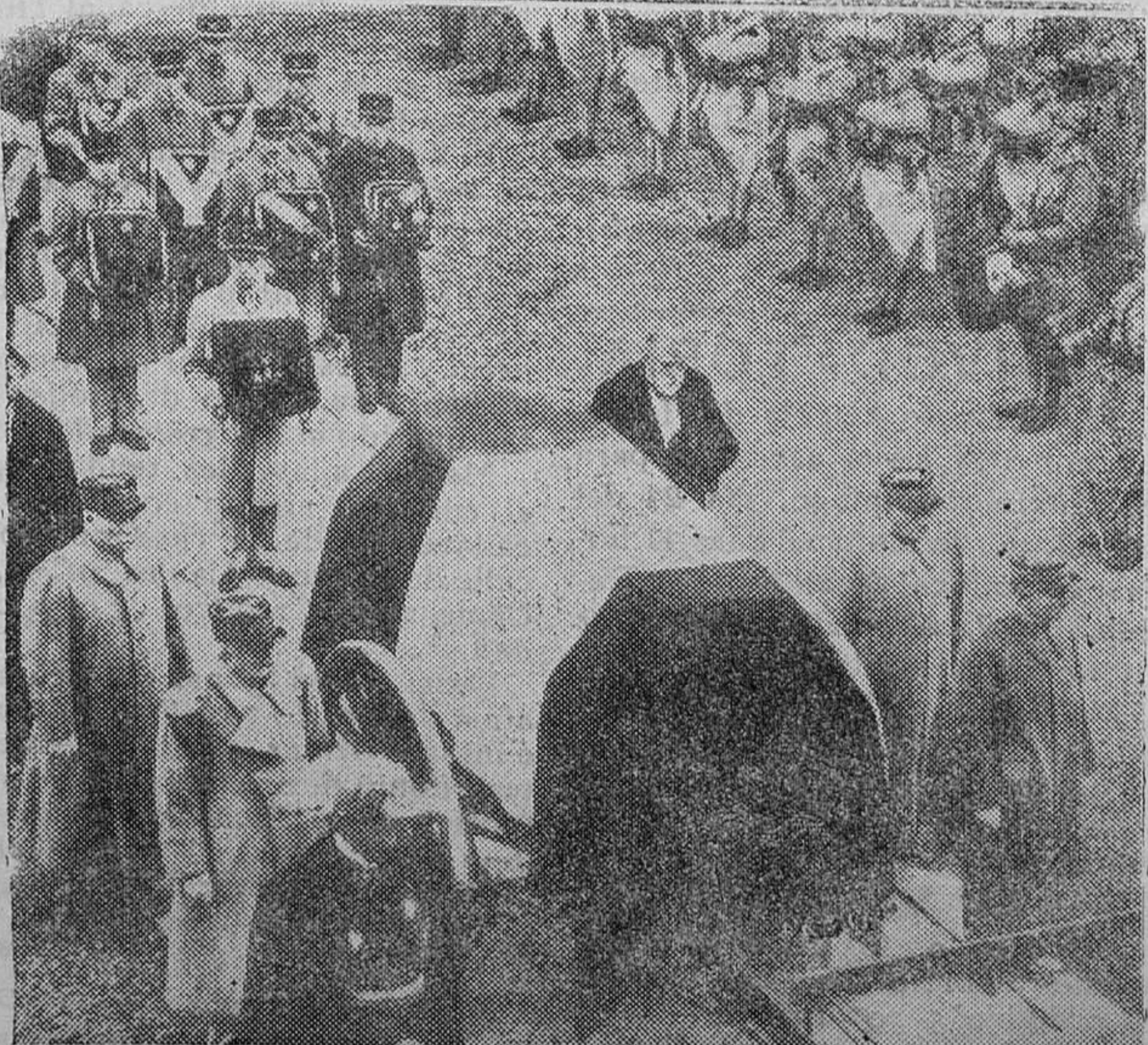
PARIS.—Entierro del ministro de la Guerra francés M. Maginot

Trata el conferenciante de la Enseñanza, otra de las bases del partido de derechas, y expresa el sentir de que en esta materia, si res-