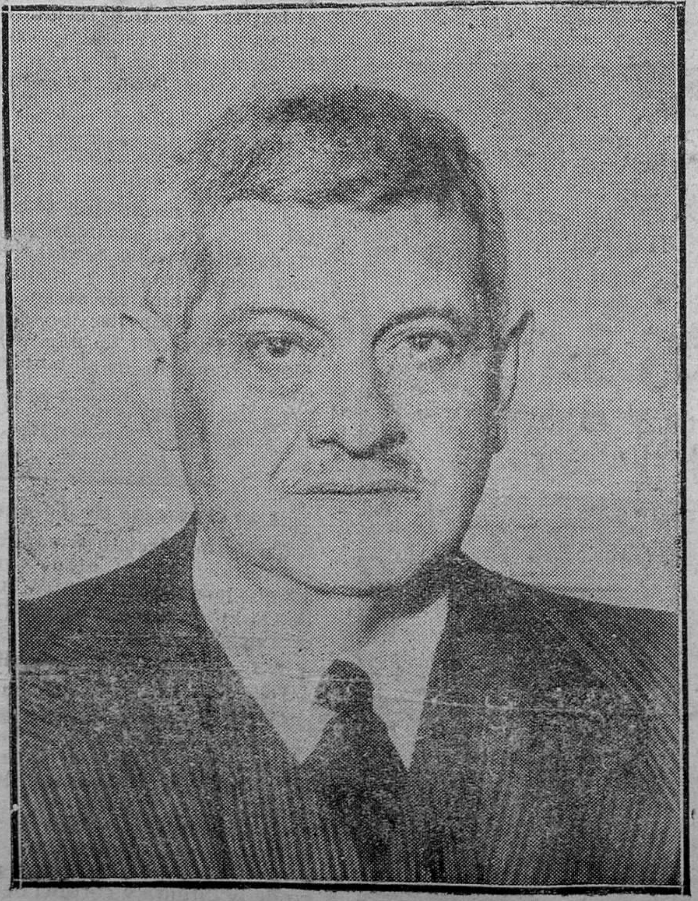
Don Jaime Carner, nuevo ministro de Hacienda