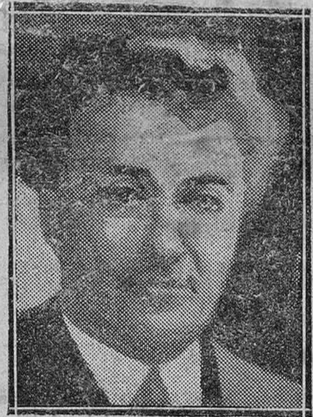
Mister Lyons, jefe del partido nacionalista australiano, llamado a formar Gobierno en sustitución del Gabinete laborista