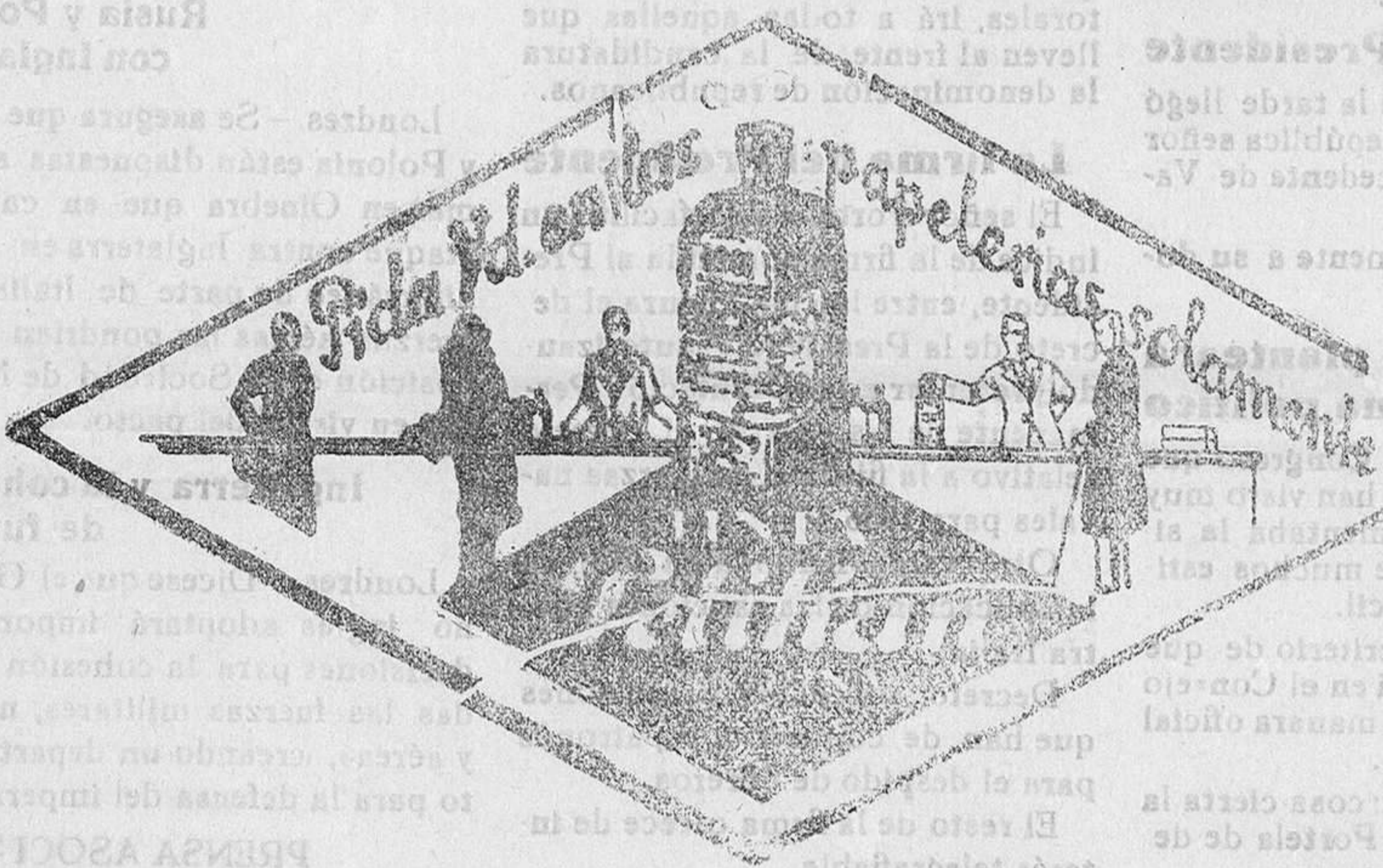
De venta en la Librería de MANUEL SINTES ROTGER, plaza de Pablo Iglesias, 17, Mahón.

DE VENTA EN ESTA IMPRENTA Imp. de M. Sintes Rotger, - Mahón