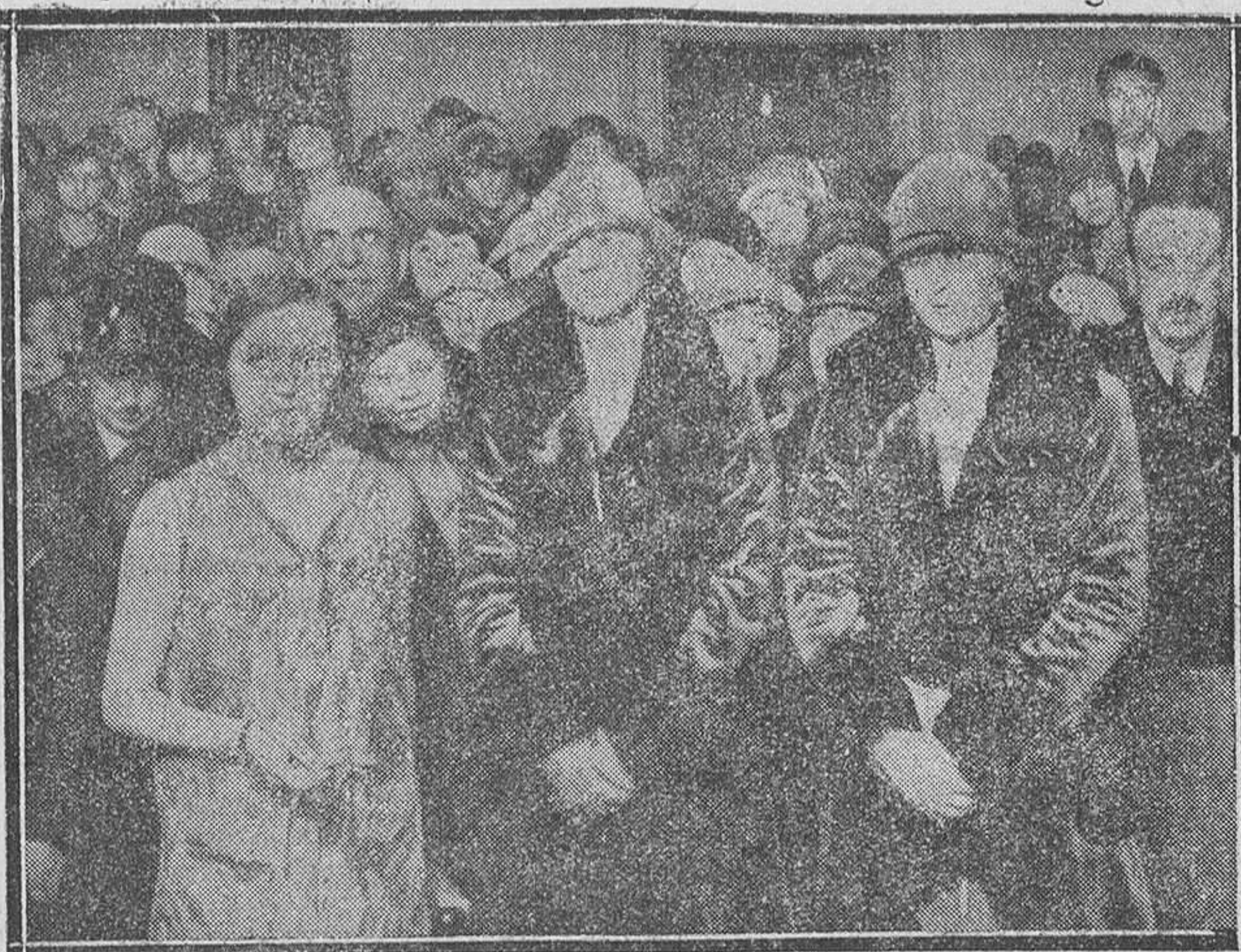
Sus Altezas Reales las Infantas Doña Beatriz y Doña Cristina, con la artista Berta Singerman, después del festival celebrado en el «Centro de la Acción Católica de la Mujer»