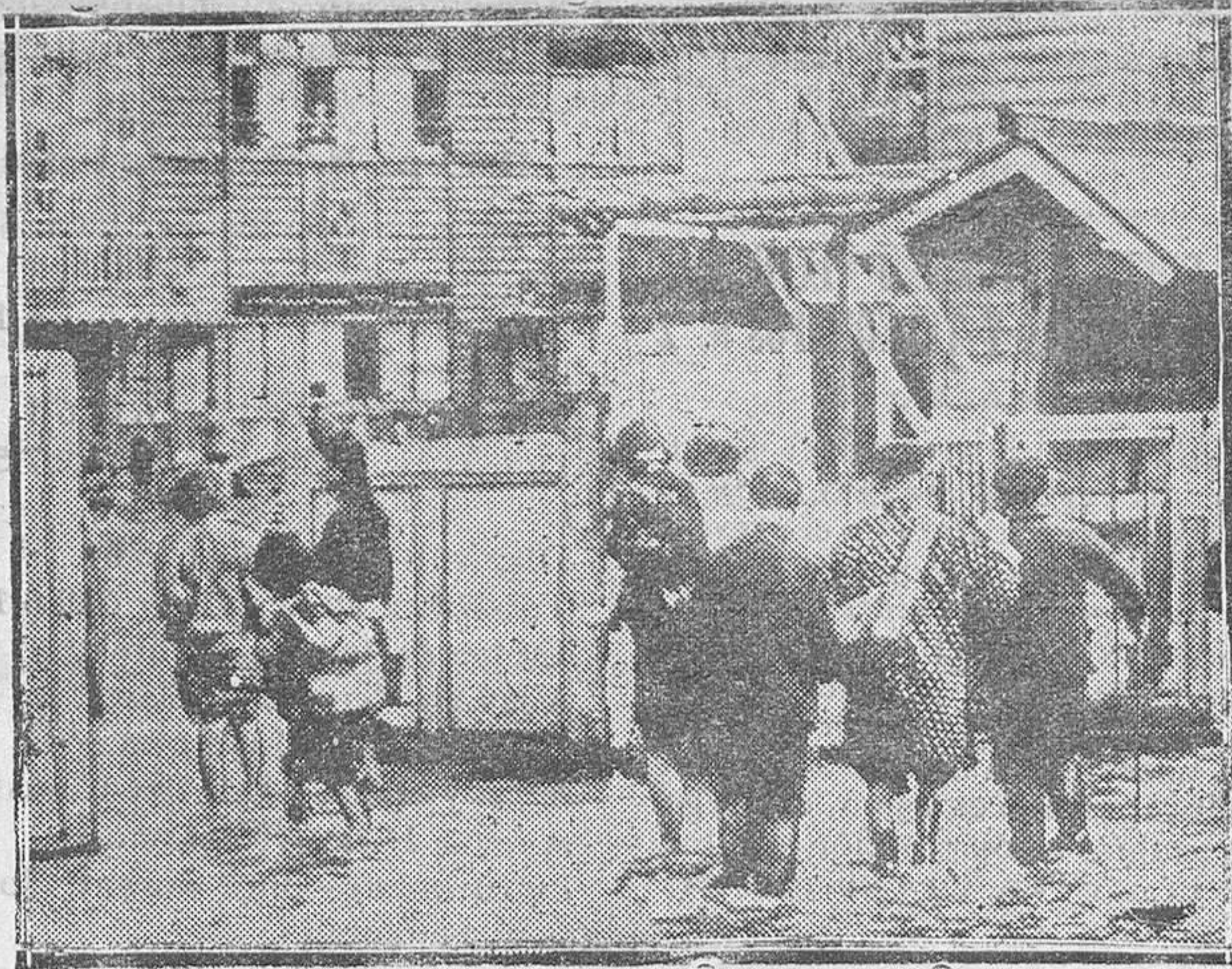
Aspecto de una calle de Tokio durante el terrible ciclón desencadenado recientemente en la capital japonesa, que alcanzó a toda su costa norte, causando grandes estragos