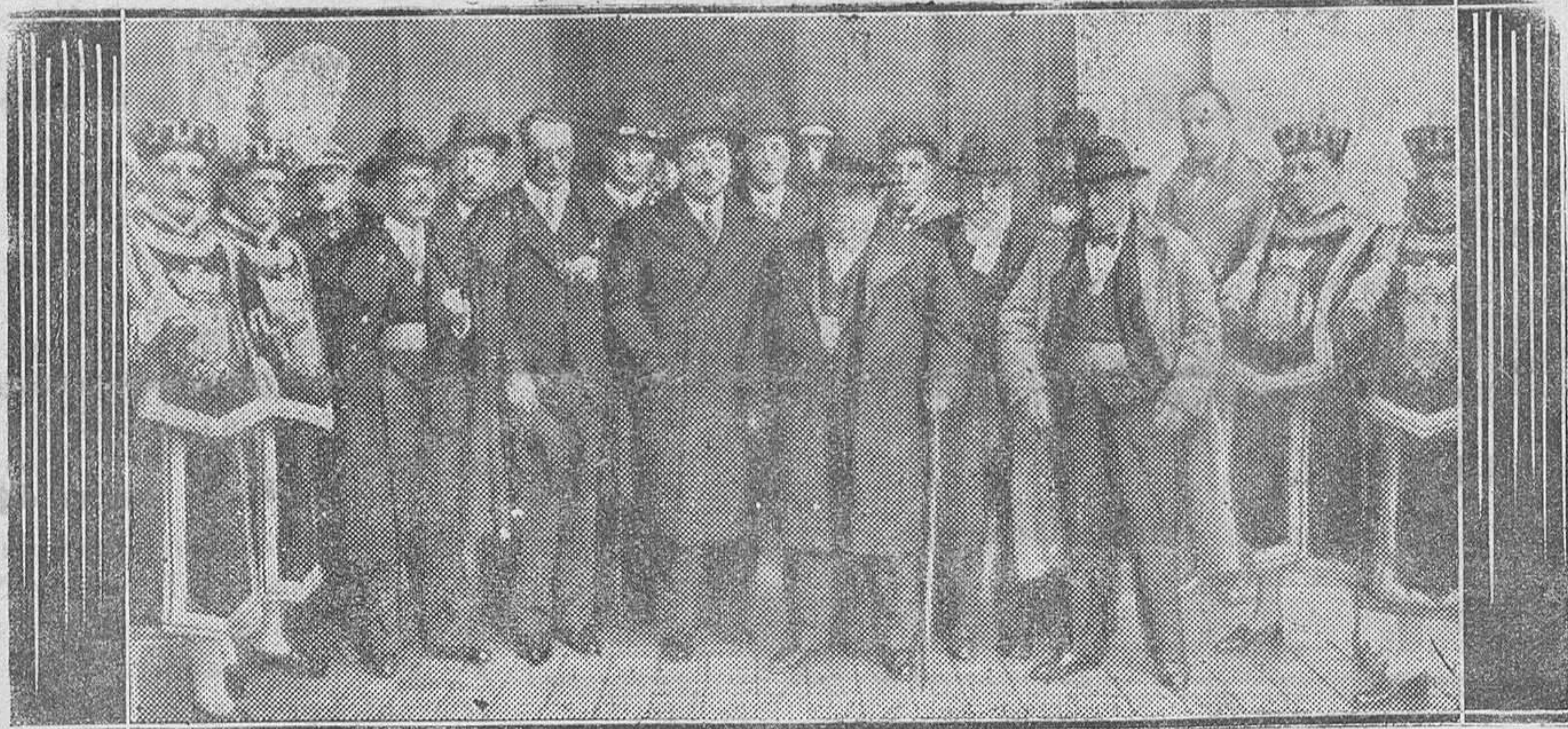
MADRID.—El Ayuntamiento saliendo del Palacio Nacional después de su felicitación al Jefe del Estado por el aniversario de la promesa