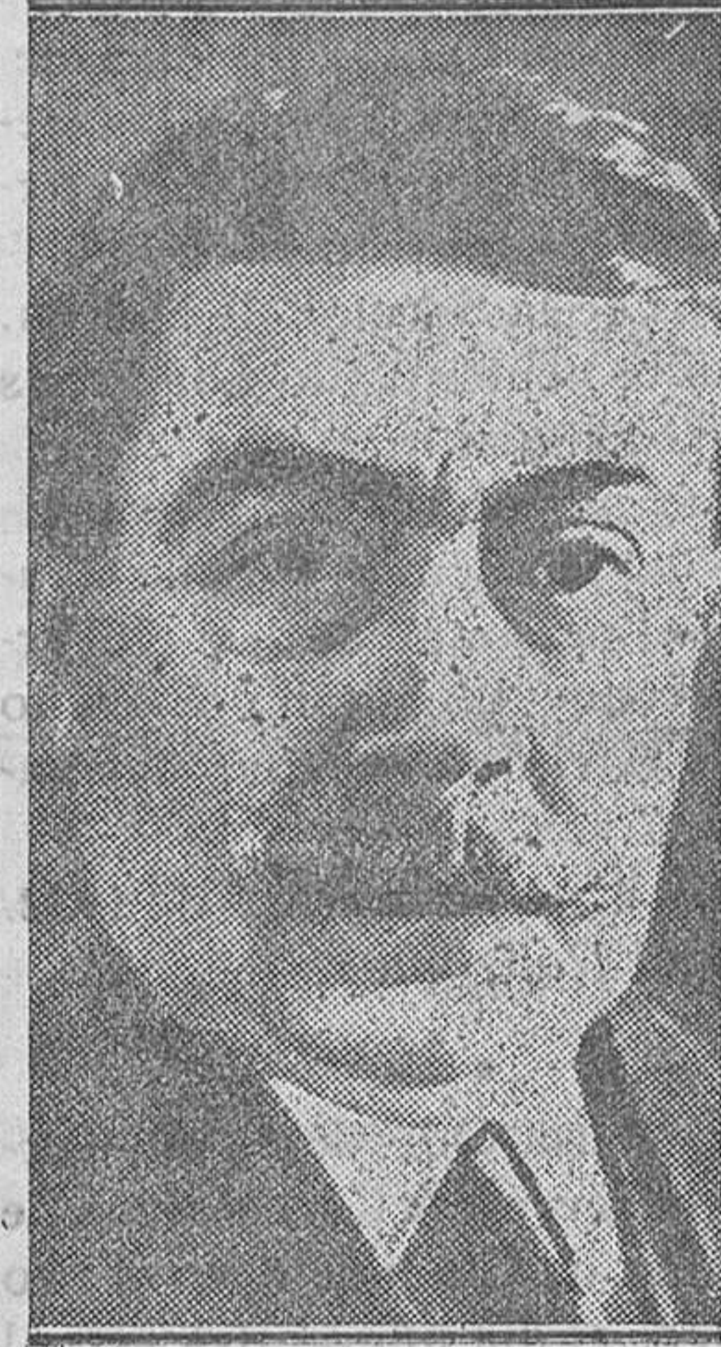
El Jefe del Gobierno francés Mr. Herriot que llegó a Madrid