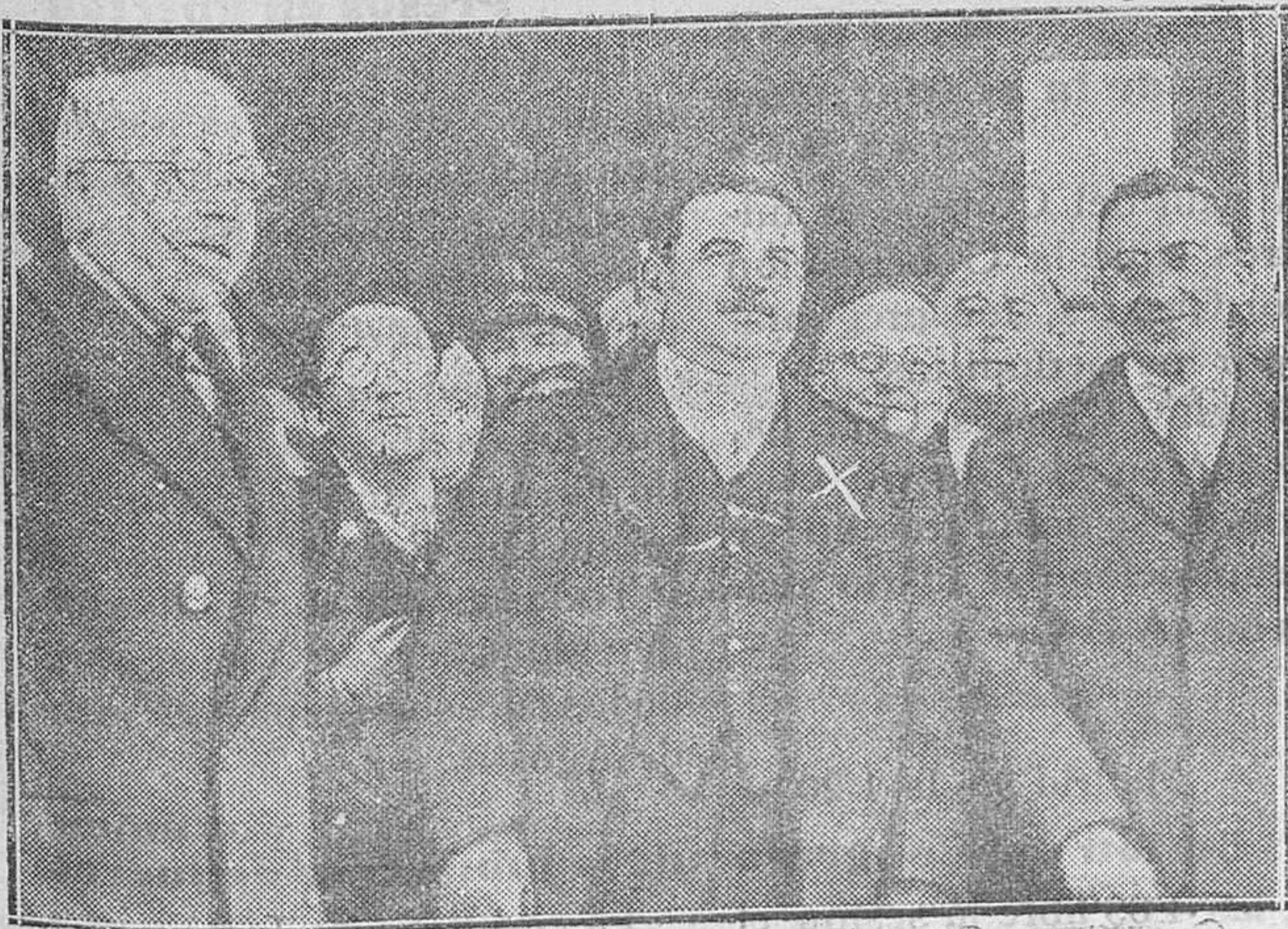
MADRID. — El señor Herriot acompañado del Presidente del Consejo de ministros don Manuel Azaña y varias personalidades que fueron a recibirle a su llegada a la estación