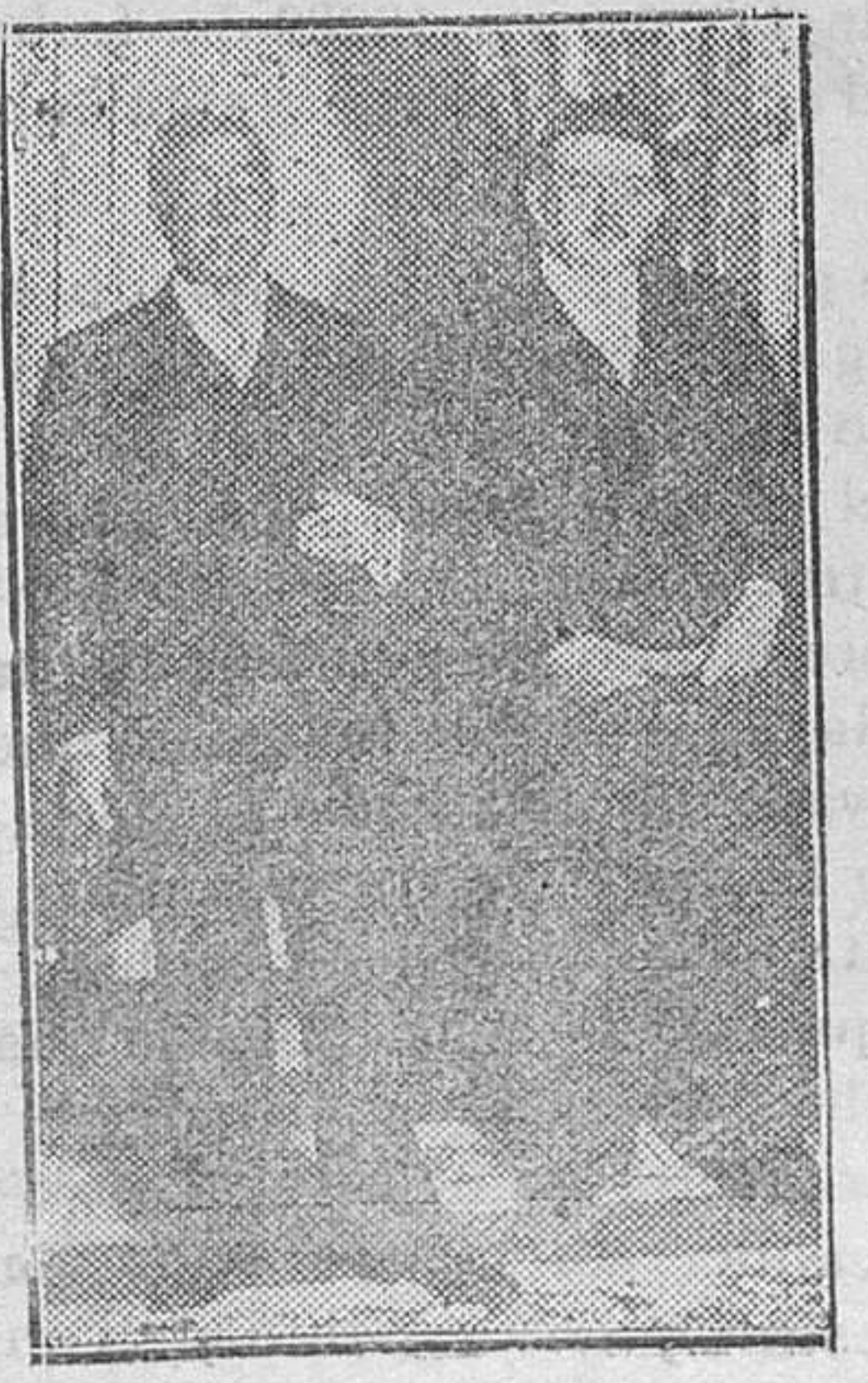
MADRID. — El señor Herriot en su visita al Presidente de la República española señor Alcalá Zamora

Lunes. — Misas rezadas, todos los días a las seis y media, siete y media y ocho y media. A iguales