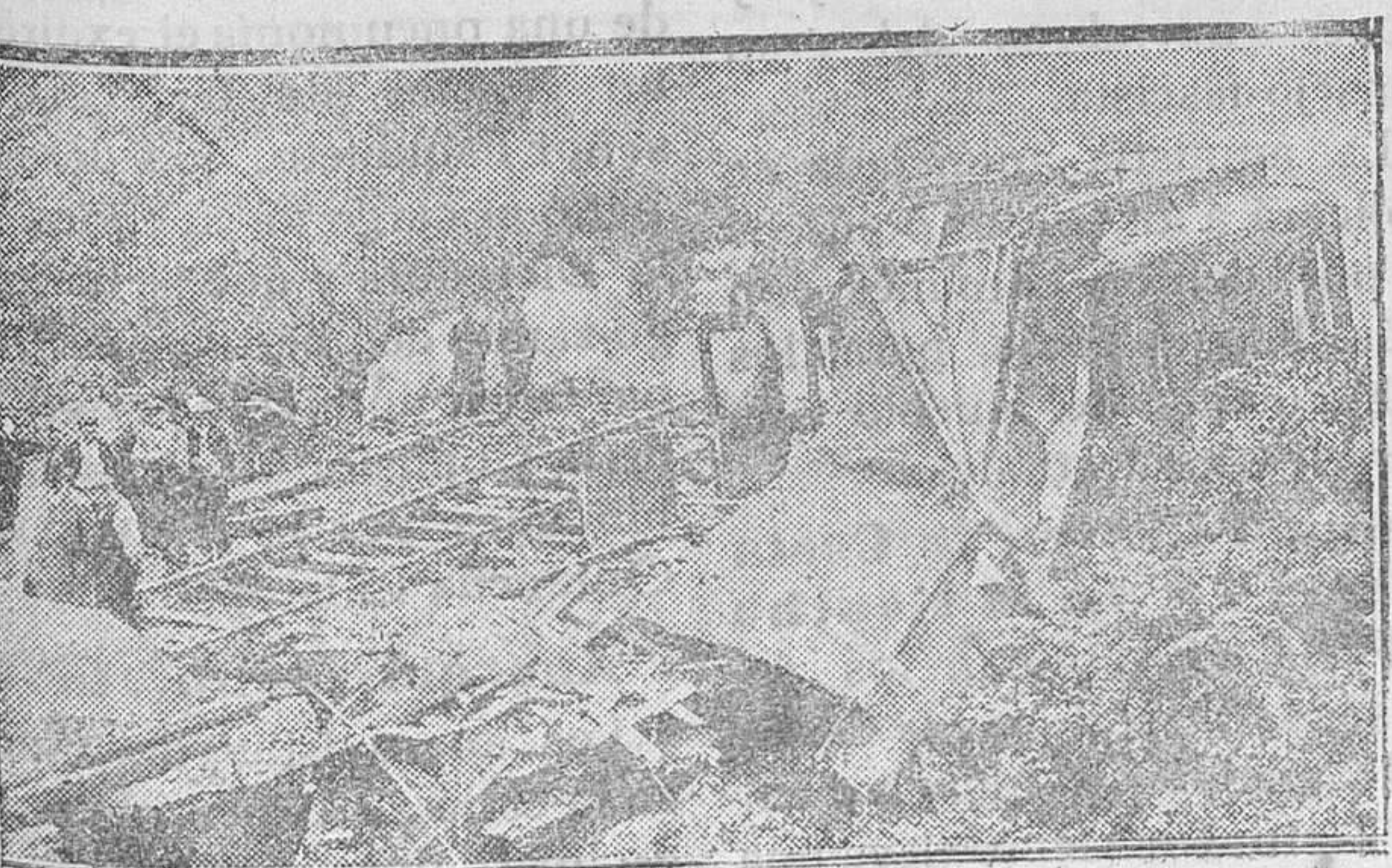
FRANCIA.—En Cerones (Mancha) ocurrió un terrible choque de trenes entre un expreso y un mercancías, resultando 8 muertos y 20 heridos. Aspecto de la vía minutos después de la catástrofe