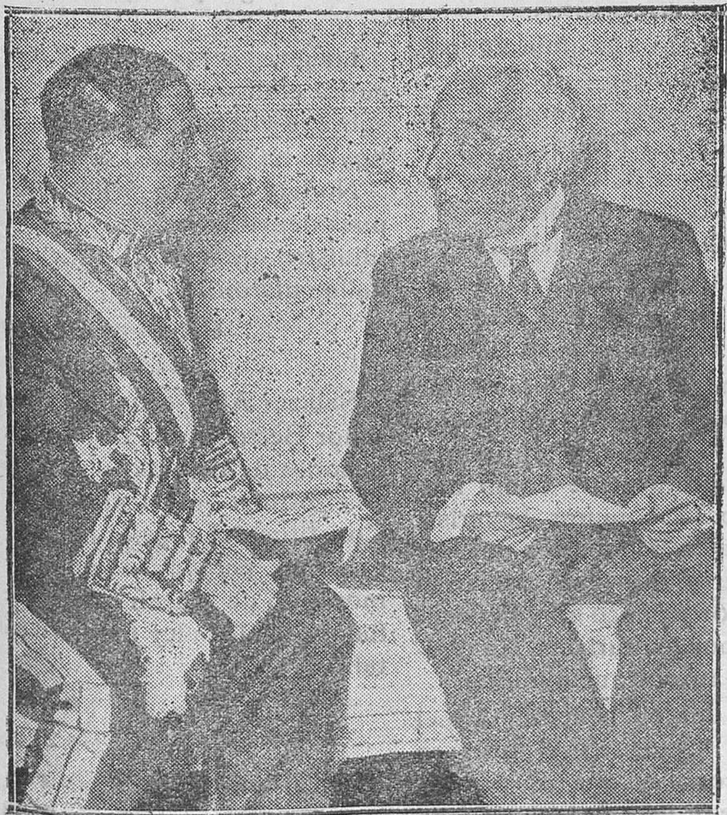
MADRID.—El Presidente de la República señor Alcalá Zamora con el nuevo Embajador de Italia en España Sig. Guariglia, en el Palacio Nacional, después de hacer éste la presentación de las cartas credenciales