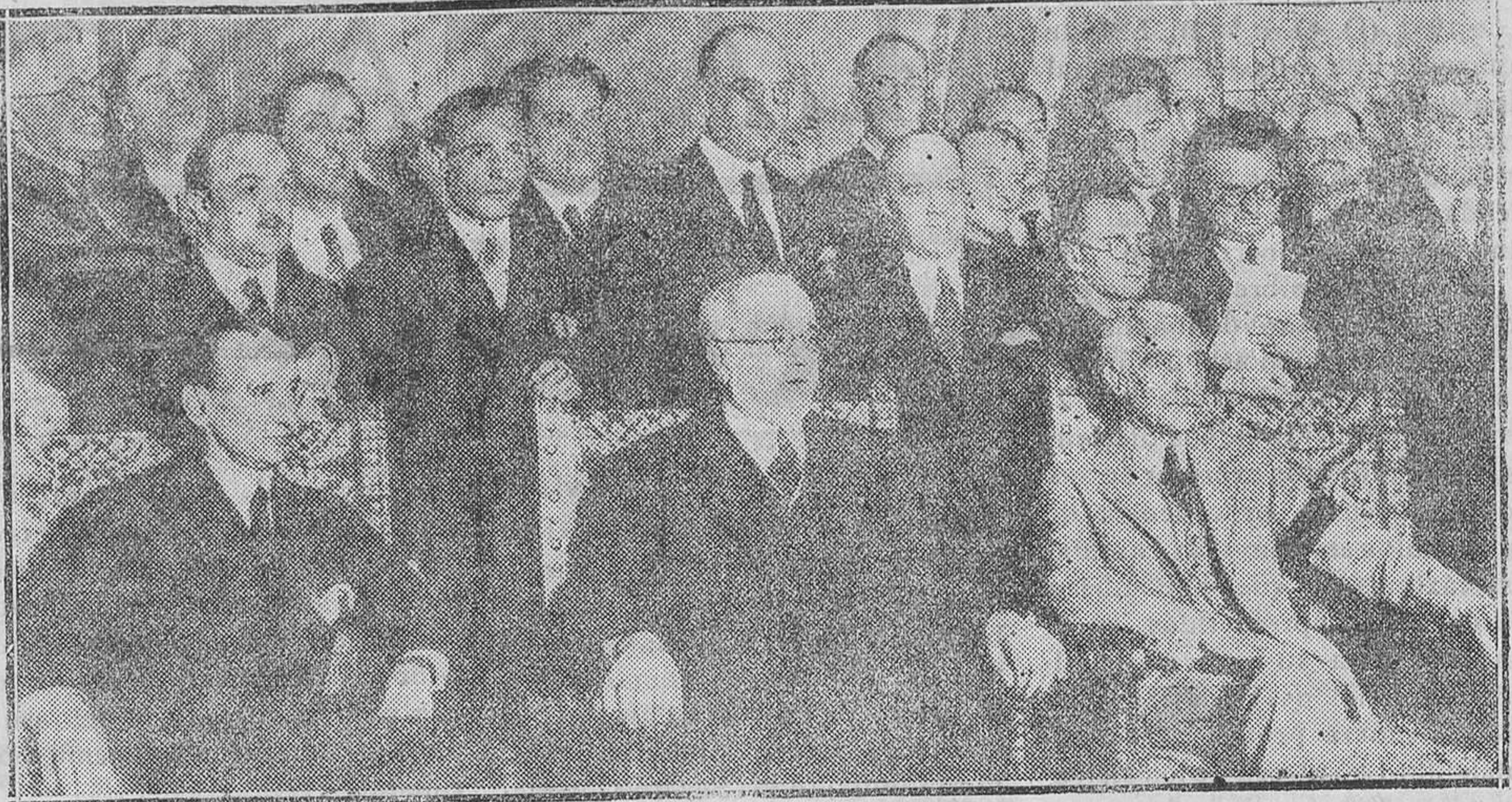
BARCELONA.—El Jefe del Gobierno, el ministro de la Gobernación, el presidente de la Generalidad, parlamentarios, autoridades y personalidades de Barcelona y Madrid, en el palacio de la Generalidad, durante la recepción de representantes de entidades catalanas que habían solicitado saludar al señor Azaña