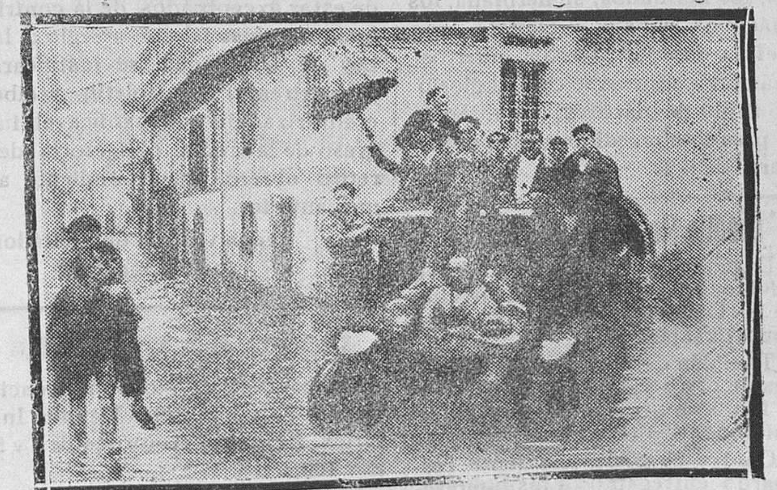
NERIN.—La enorme inundación a causa de las lluvias torrenciales. — Las aguas alcanzaron un alto nivel en el interior de las casas y algunas familias se vieron en grave peligro. — En la foto un automóvil con el Alcalde (x) que con agentes de Policía y vecinos recorren el pueblo prestando auxilio al vecindario

a) Resultados de los análisis químicos y bacteriológico practicados en la Inspección Provincial de Sanidad, de las aguas del pozo de Bimarcabí dando nota de mala calidad.