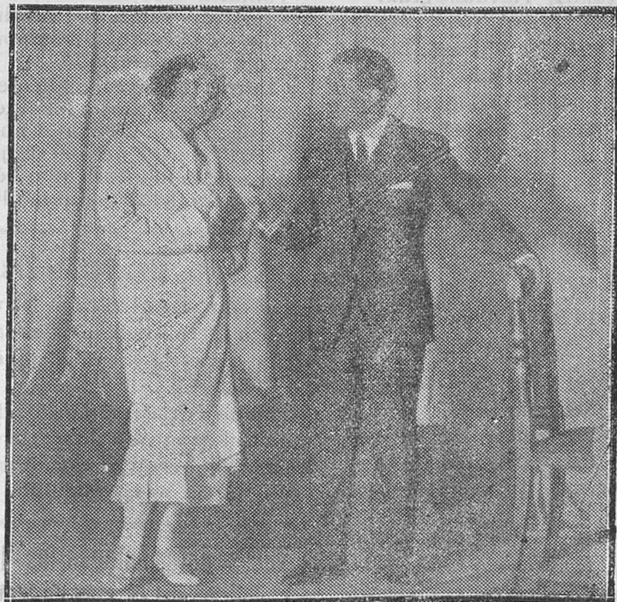
MADRID.—Una escena de la comedia «La señorita mamá», de Verneuil, traducida por Gutiérrez Roig, y estrenada con gran éxito en el teatro Muñoz Seca

Bibretas de alquiler, listas de embarque, altas y bajas para la contribución industrial DE VENTA EN ESTA IMPRENTA