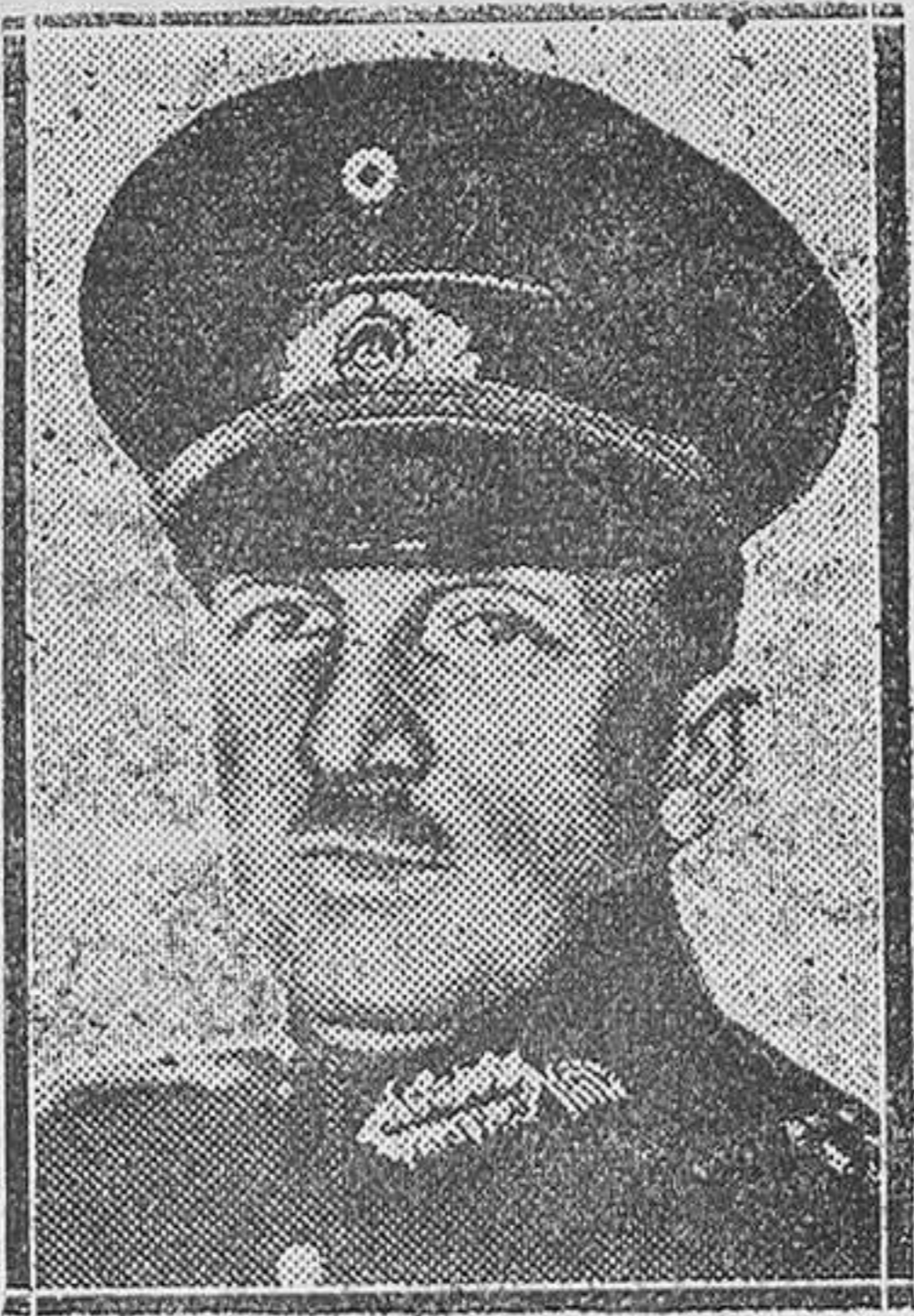
BERLÍN.—El general jefe von Schleider, de la Reichwehr, cuyo discurso pronunciado ha causado una gran sensación en esta capital

Acabamos de leer unas manifestaciones de la U. G. T. y el partido socialista de Sevilla, que nos han hecho temer por la salud espiritual del pueblo español. Piden la destitución de todos los funcionarios judiciales de Sevilla, la revisión de sus actuaciones y cosas así. Era más sencillo que pidiesen que se les entregue a los que ellos reputan culpables. Leyendo lo cual recordamos el aprieto en que nos