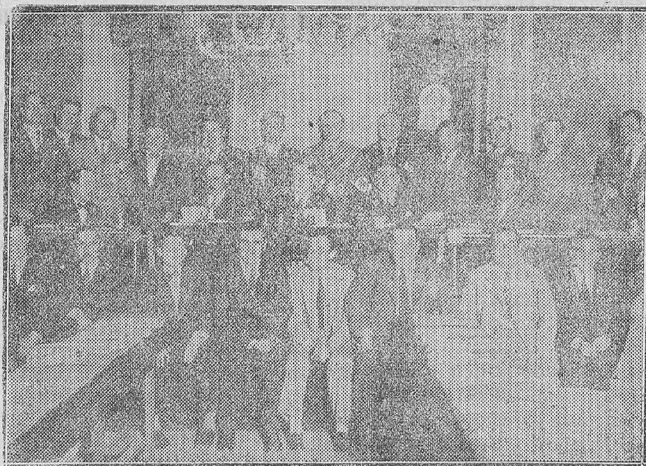
MADRID.—Concurrentes a la Asamblea Nacional de Balompié

concluya por declarar que todo ello es farsa y es mentira»; y protestando contra las dictaduras parlamentarias, rechazaba como corruptela del sistema esa viciosa práctica que trueca la representación en delegación, haciendo que los diputados, una vez elegidos, «se conviertan en amos y señores mientras dura el desempeño de su cargo, desentendiéndose del país, que debe seguir manifestando su voluntad, fuera de las Cortes y aun contra las Cortes, en la Prensa y en las reuniones públicas, porque el Parlamento, según frase de Franqueville, depende de la opinión, la cual ha de manifestarse constantemente, gracias a la liber-