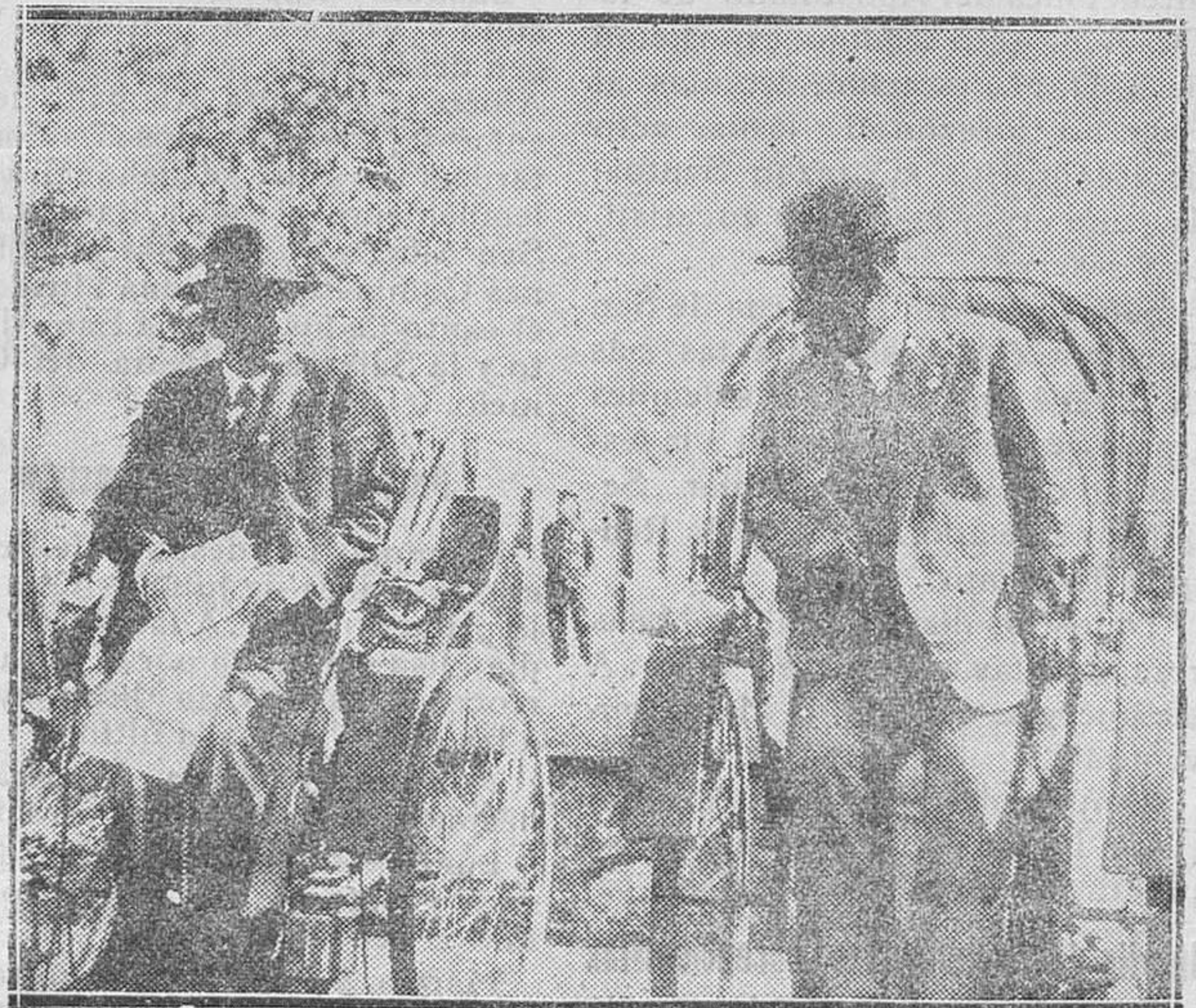
Lord Layton, de la Sociedad de Naciones, que, según las noticias que se reciben, se halla enfermo de algún cuidado, con el doctor Schhnee

dad de la Prensa y al derecho de reunión, para que no se recuerden aquellas palabras de Voltaire: «Prefiero ser gobernado por un león de buena raza a serlo por doscientos ratones de mi especie.»