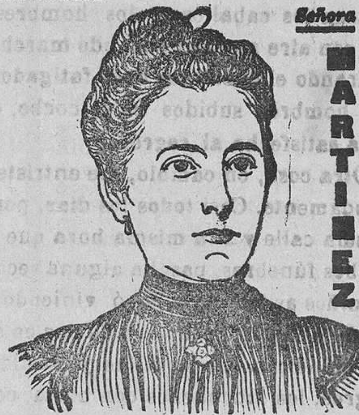
Escorial 17 de Diciembre de 1902.