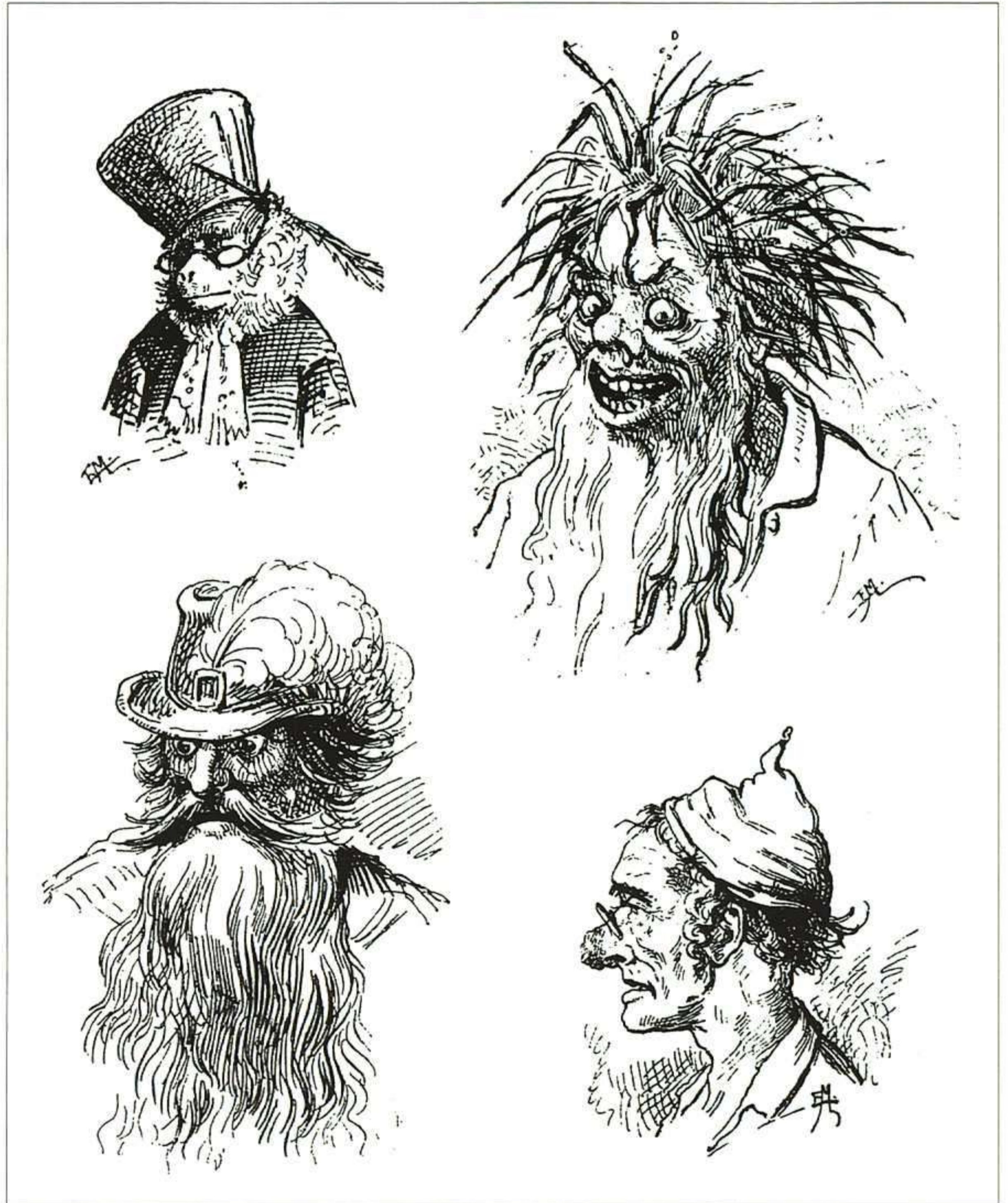
Mazzanti nos presenta una serie de retratos de los personajes principales. Son pequeños grabados con los que se inicia cada capítulo. De arriba abajo, y de izquierda a derecha: el Mono Juez, el pescador, el titiritero Comefuego y Maese Cereza.

Mazzanti nos presenta una serie de retratos de los personajes principales (Maese Cereza, Geppetto, el Grillo), entre los que destaca su célebre Pinocho, según lo concibió para la portada del libro, de pie, con las manos en las caderas y la mirada valiente, dispuesto a hacer fren-