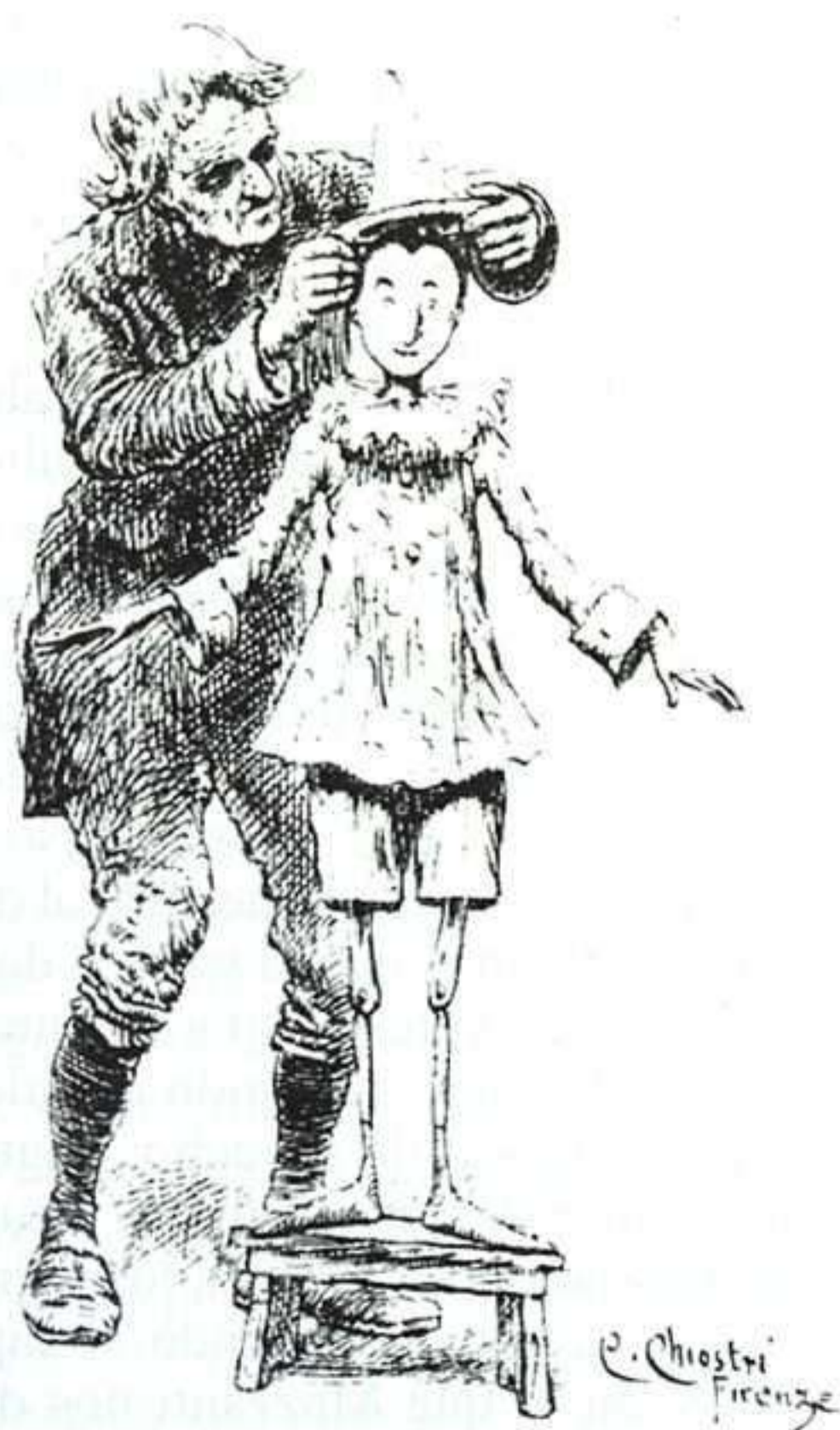
Chioistro capta muy bien la ternura del momento en que Geppetto le coloca un gorrito de miga de pan a Pinocho.