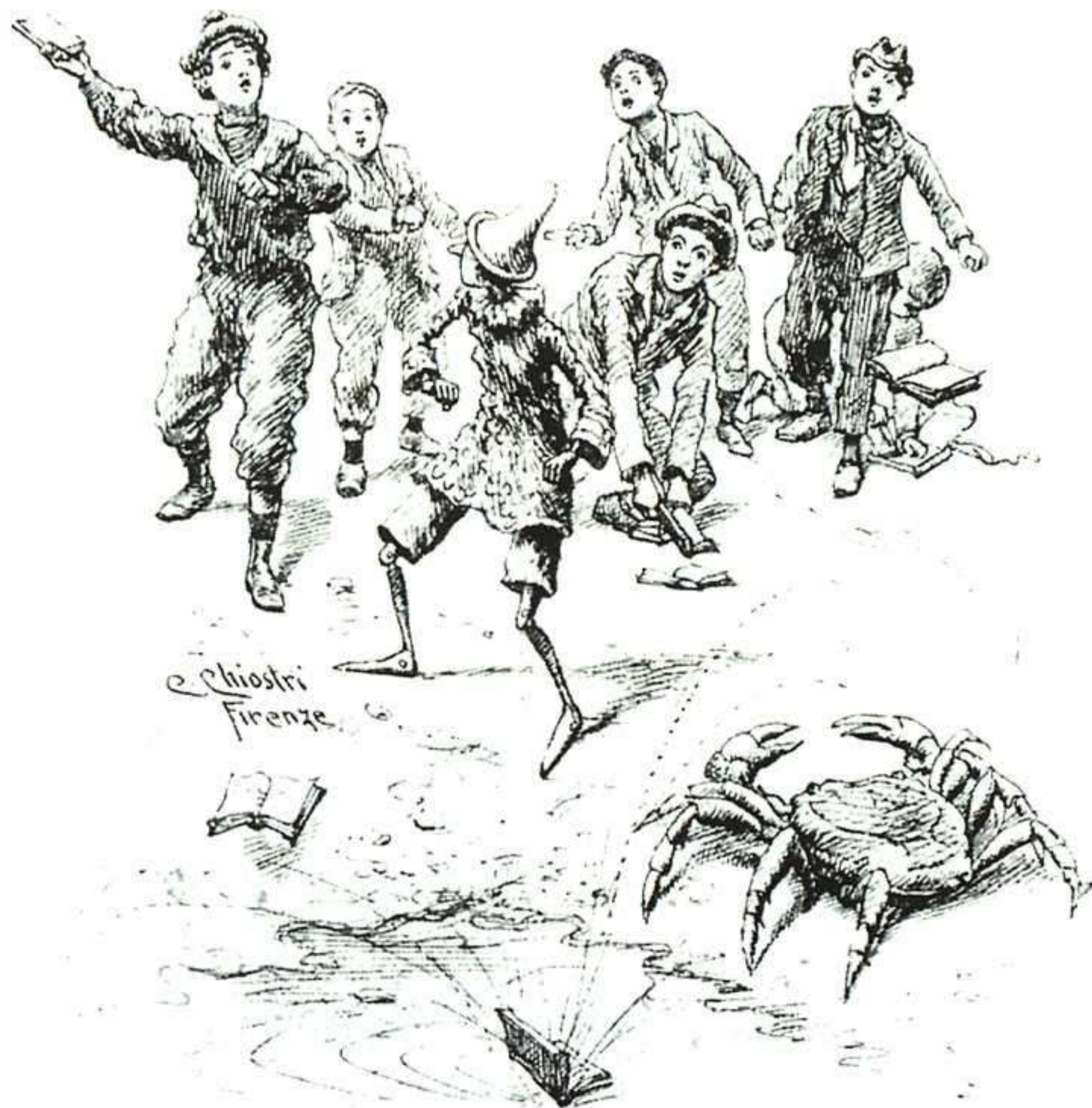
Un acierto de composición y simbolismo es esta escena de Chioistro, con la figura del cangrejo como presagio de la tragedia que se avecina.