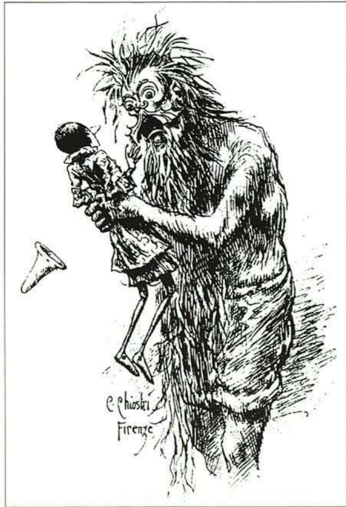
Y de la ternura, Chiostrri pasa a la truculencia visible en la expresión del pescador dispuesto a devorar a Pinocho.