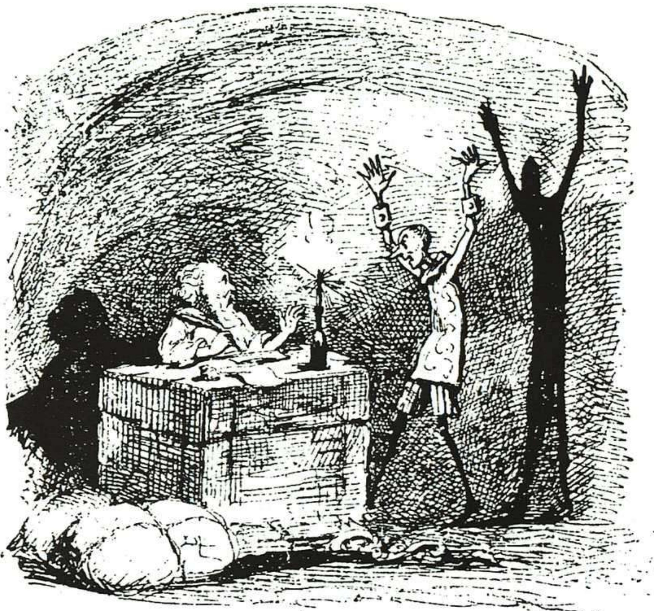
Mazzanti nos obsequia con esta escena de interior que es un perfecto ejemplo de claroscuro de intenso efecto dramático.

Con todo, la obra de Mazzanti abunda en muestras de innegable originalidad y talento expresivo. Nos referimos entre otros al grabado del capítulo XXI, en el que hay que destacar el contraste entre el vigor del cuerpo del campesino, que camina llevando agarrado por el cogote a Pinocho, y el aspecto indefenso de la flácida figurilla del muñeco. O al del capítulo XXII, en el que la tensión del momento viene expresada por la línea diagonal de la soga formando ángulo con el cuerpo rígido de Pinocho, pugnando por escapar de su humillante situación mientras ladra delatando a los ladrones. Y terminaremos remitiendo al capítulo XXXV, en el que Mazzanti nos deleita con una escena de interior que es perfecto ejemplo de claroscuro de intenso efecto dramático.