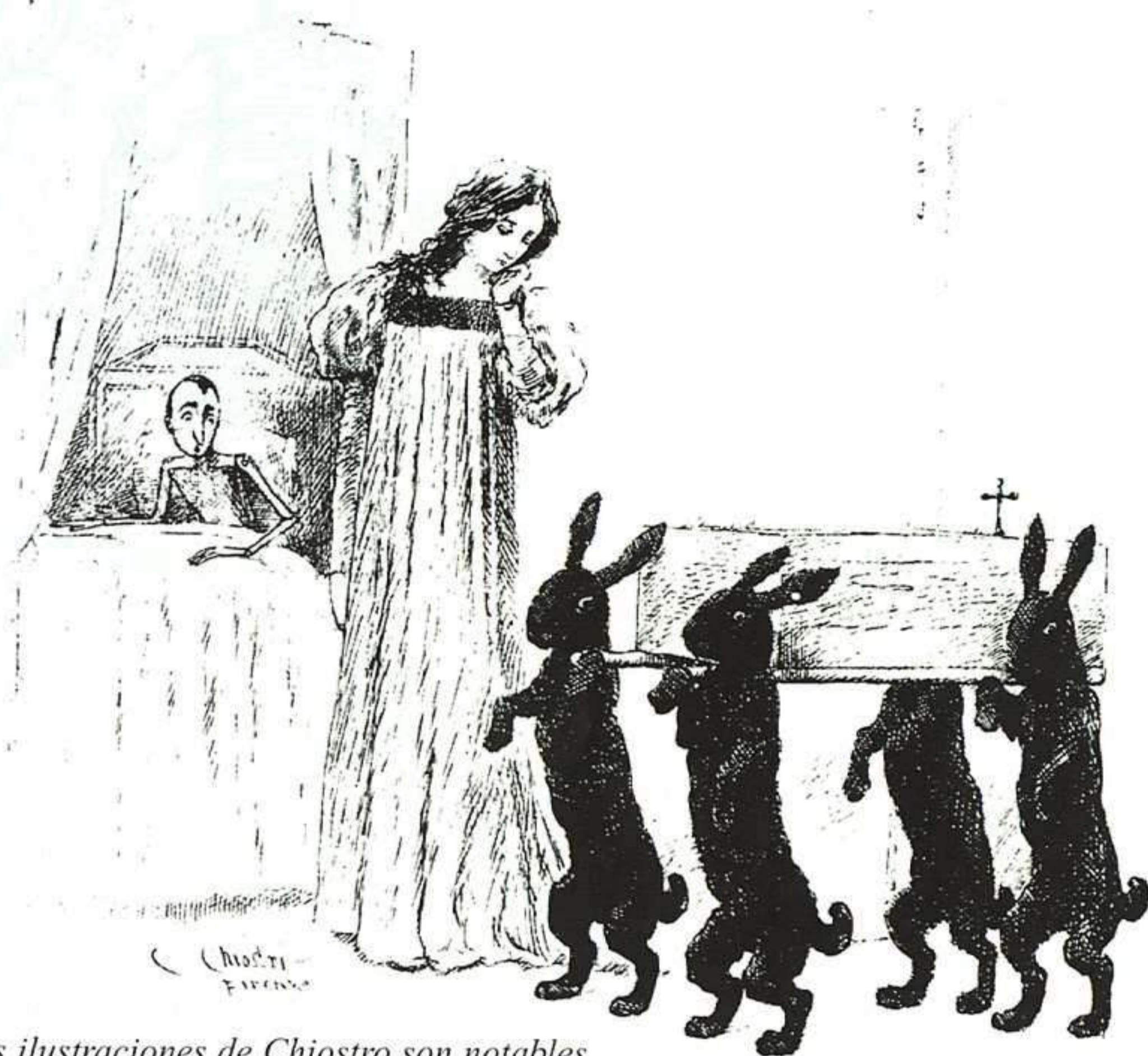
Las ilustraciones de Chioistro son notables por su realismo, pero también por sus detalles surrealistas e inquietantes, como las figuras de los 4 conejos con el ataúd.