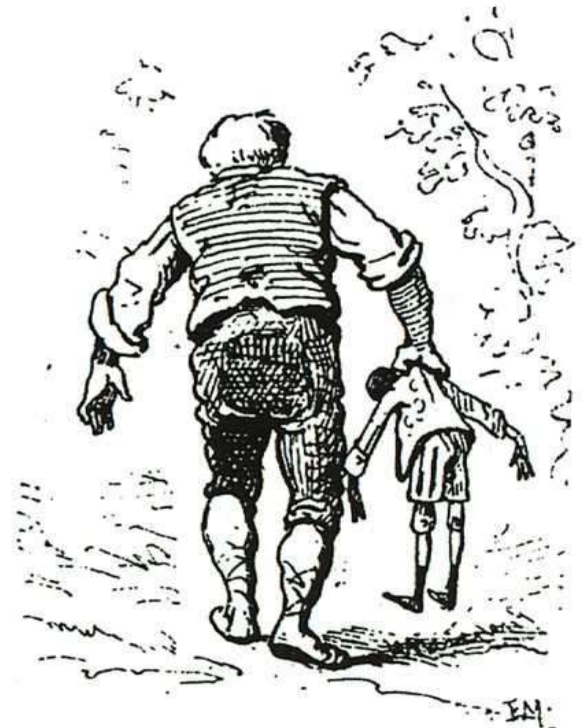
Mazzanti consigue aquí el buscado contraste entre el vigor del cuerpo del campesino y la fragilidad de Pinocho.

pesar de su expresividad, no se ajusta con fidelidad a la descripción que del personaje hace el autor del cuento: «... un hombrón tan feo, que metía miedo sólo con verlo. Tenía una barbaza negra como un borrón de tinta, y tan larga, que le bajaba de la barbilla al suelo».