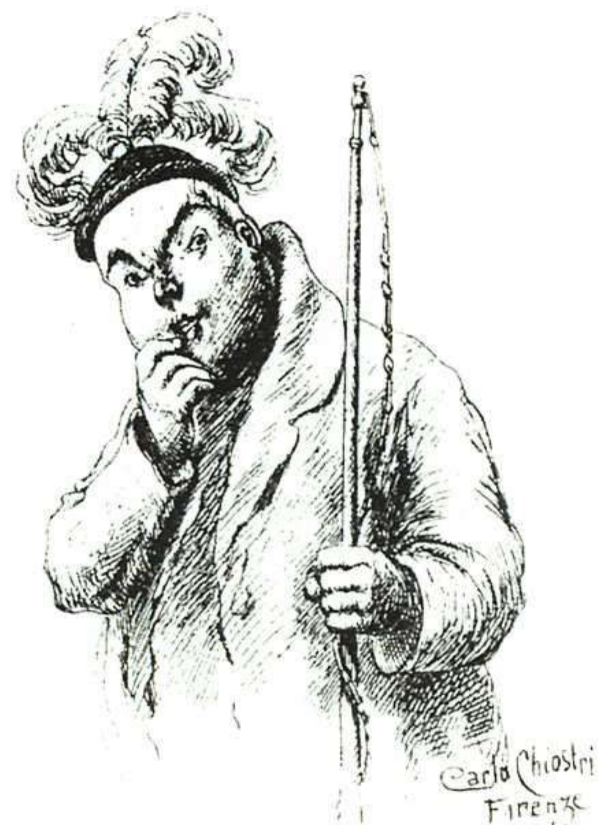
Chioistro es capaz de una innegable sutileza, como lo demuestra la mirada ambivalente del hombre que seduce y se lleva a los niños al País de los Juguetes.