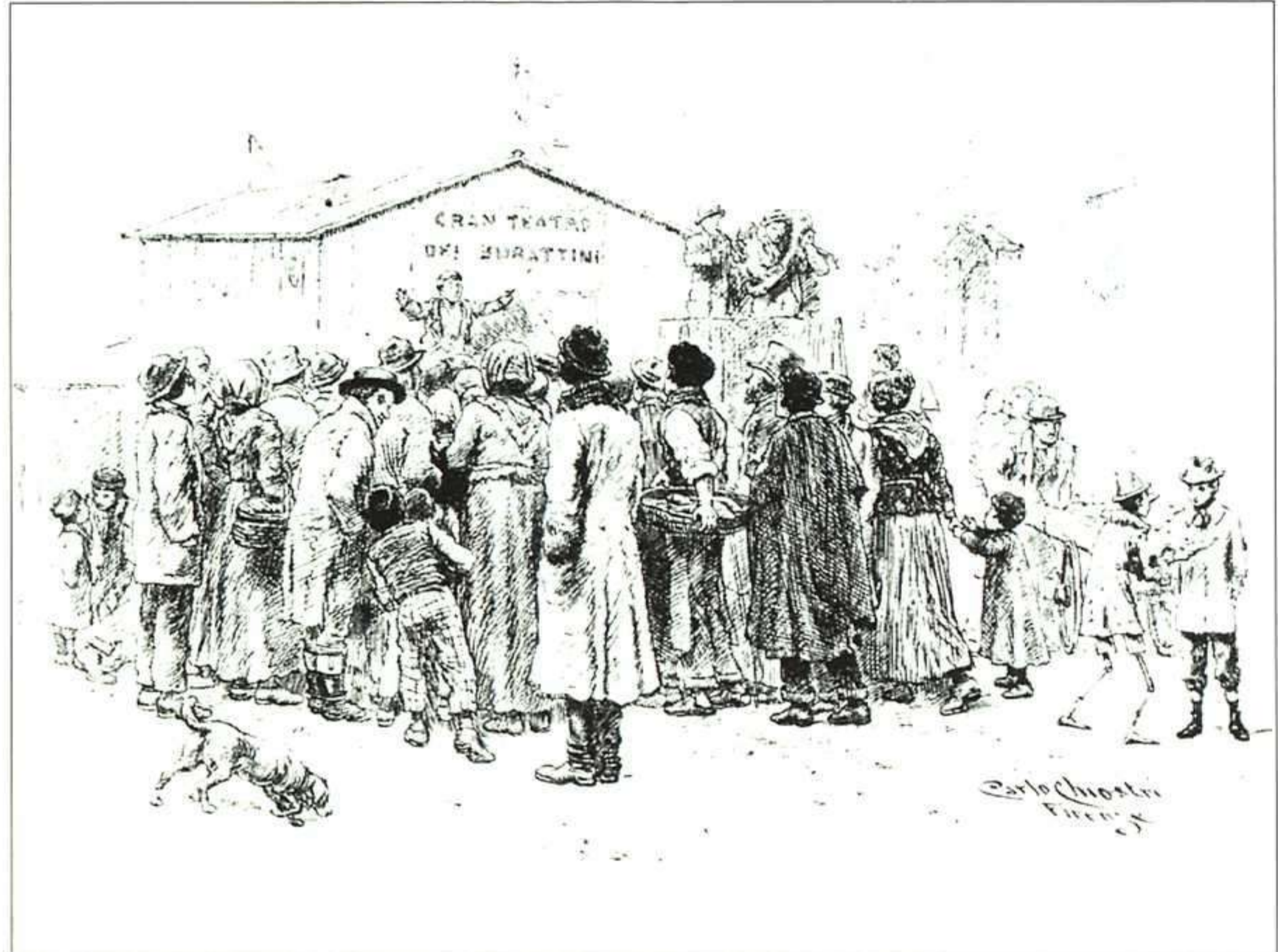
Las ilustraciones de Chiostrri han adquirido renombre universal por su capacidad para transmitirnos la vida de su época. Como muestra, esta imagen callejera en el cap. IX.