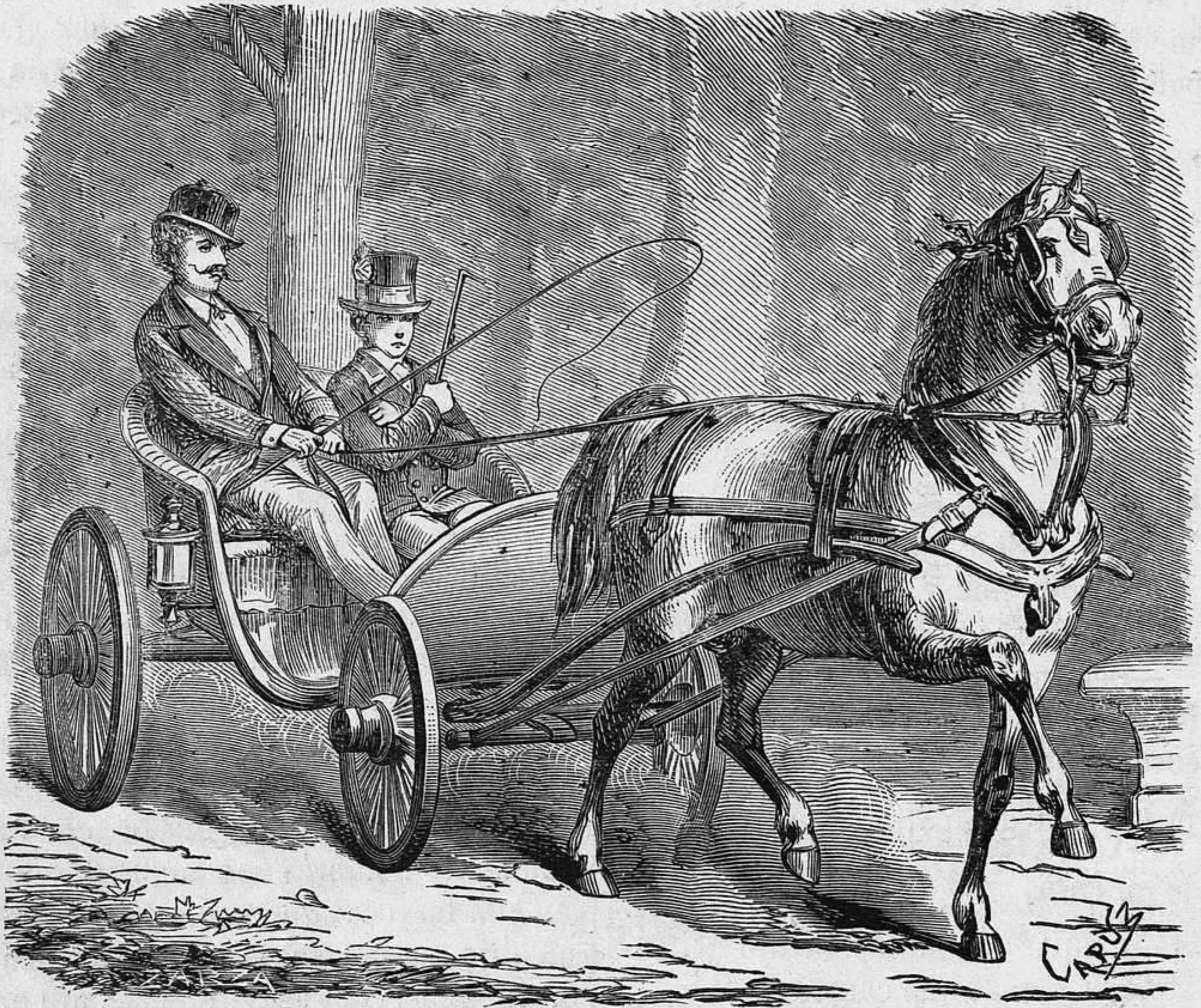
El marido de Rosita.

Cuando Rosita, del brazo de su marido, y acompañada de la marquesa, su madrina, y un gran personaje muy serio que habia sido padrino de la boda, iba á subir á la soberbia carretela que habia de conducirla á su nueva casa, doña Martina llegóse á ella, y le dijo, pudiendo apenas contener los sollozos: