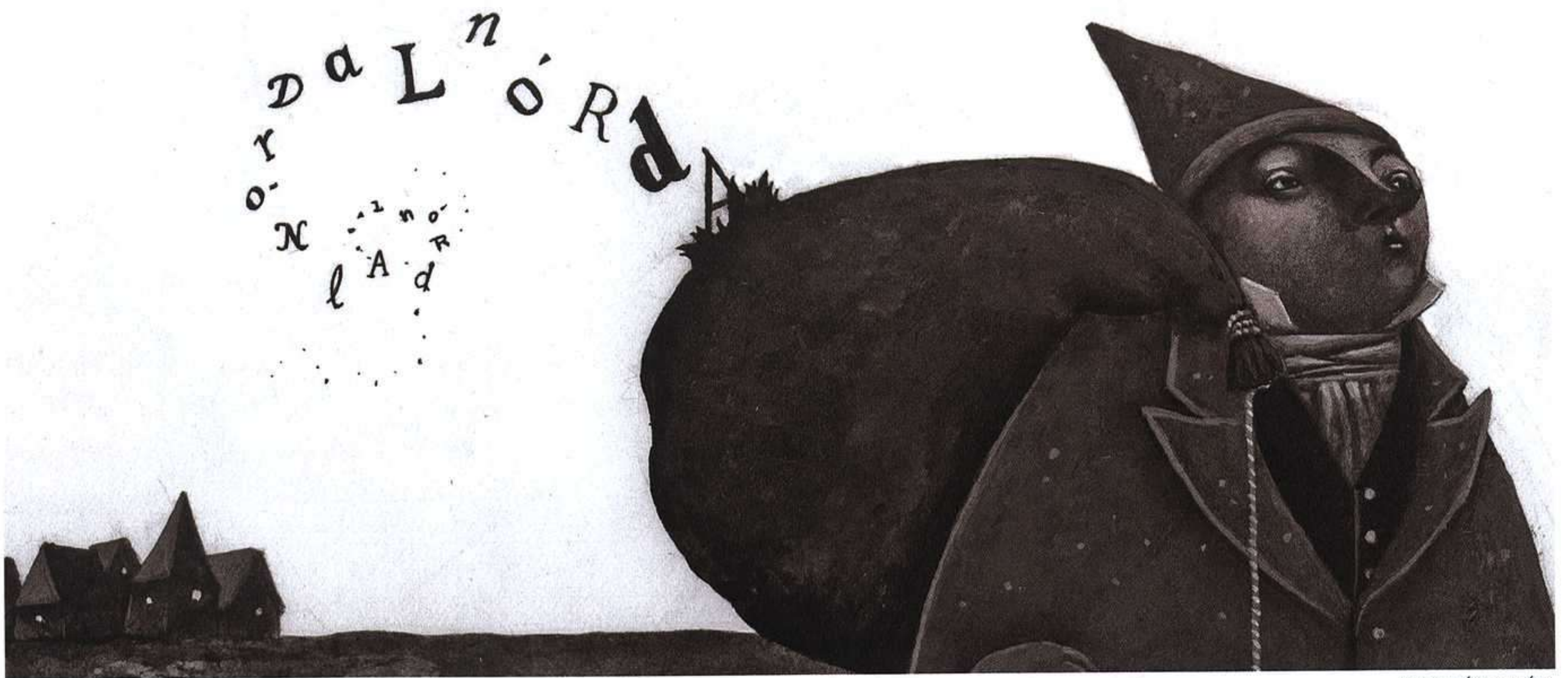
MIGUEL ÁNGEL DÍEZ.

dio a probar su mejor pastel, hecho con toda clase de hierbas.