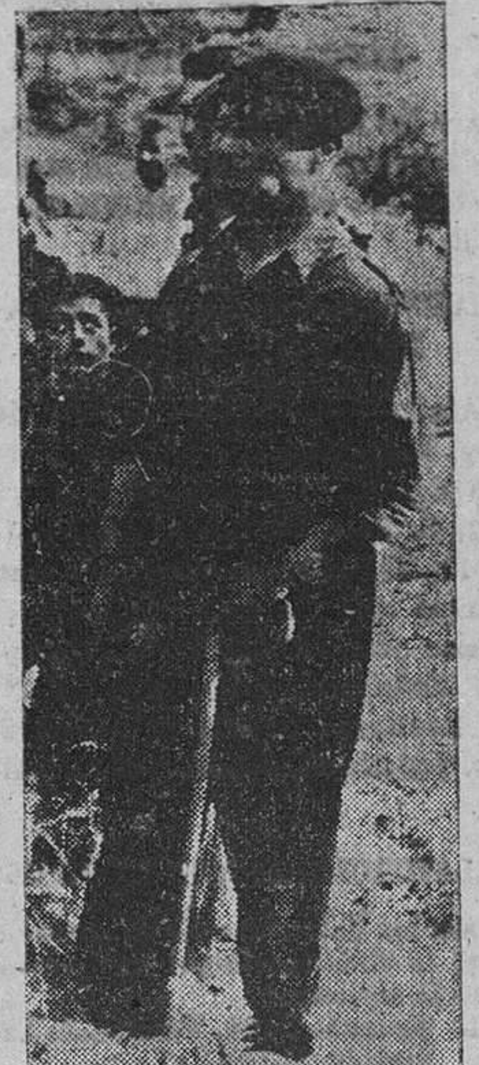
Con su camisa azul y apoyándose en la garrota, este vecino de San Pedro de las Herrerías sigue, embebecido, el desarrollo del «Fuego de Campamento» con que se clausuró el primer turno en el soto de San Ignacio de Loyola, en presencia del delegado nacional del Frente de Juventudes y altas jerarquías provinciales.