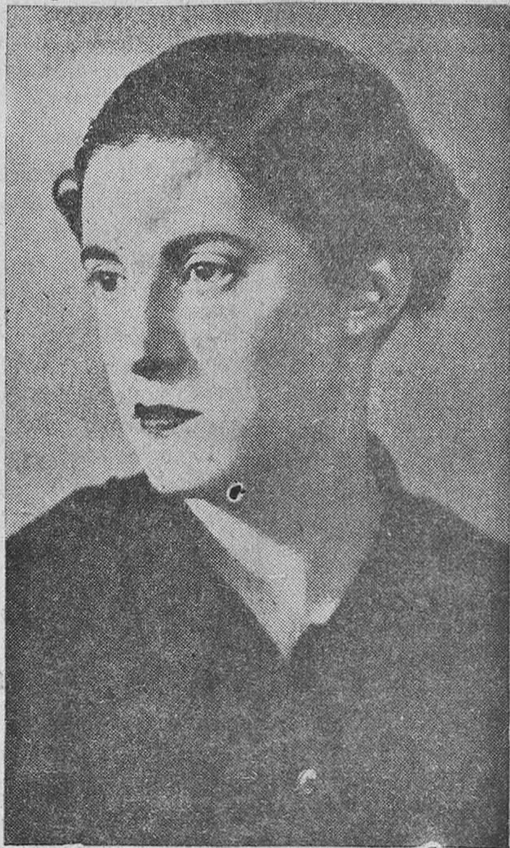
Parte de esta minoría que José Antonio le asignó una misión tan gloriosa, la formáis vosotras, camaradas de la Sección Femenina: vosotras, que no tenéis que desalentar, aunque todas las cosas se os pongan al revés; vosotras, que no tenéis más ambición que meter este espíritu nuestro bien dentro del alma de las generaciones venideras porque ésta es vuestra obra: vosotras, que no tenéis que tener más que obediencia, fortaleza y fe para que España, en gran parte por vosotras, sea falangista.

Si alguna vez tenemos un momento de desaliento, para levantar nuestro espíritu y conseguir la fuerza necesaria para seguir bajando no tenemos más que recordar las alentadoras palabras pronunciadas por el Generalísimo Franco en Medina del Campo. Dijo así el salvador de España: «Es necesario el patriotismo que formais vosotras en los hogares, es necesario esa disciplina que hacéis con vuestras canciones o con vuestras cosas juveniles, es preciso levantar a España, y vosotras vais a ser las adelantadas de la paz. Tengo fe en vuestra obra. Yo ayudaré, yo haré que a todos los hogares españoles pueda llegar la luz y la alegría. Yo haré, que en éstos vetustos muros, se forje la primera escuela de las Secciones Femeninas, donde se prepare a las mujeres al conjuro y al recuerdo de aquella Reina ejemplar, de aquella mujer sublime que marcó de un modo solemne los derroteros para España».