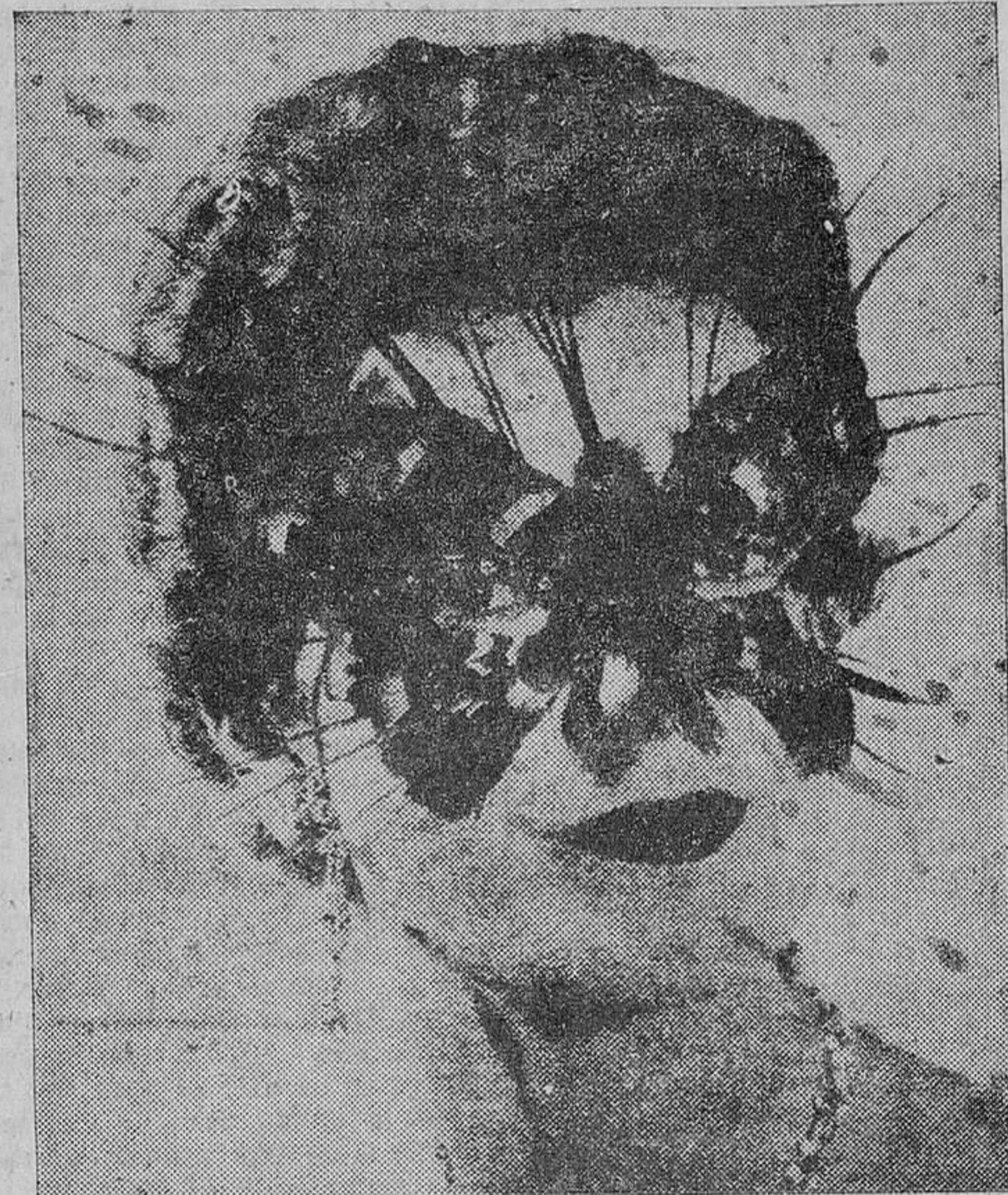
A veces los disfraces y bromas de Carnaval derivan hacia lo extravagante, aunque no desagradable, como este modelo de mariposa -antifa- llevado en Niza ocultando la indiscutible —aunque medio oculta— belleza de su portadora.

técnica de las bromas en el tiempo de los proyectiles dirigidos, de la penicilina, de la televisión, del satélite artificial... en la era atómica, en una frase? Yo no lo sé. No apreciaba la aparición de una modalidad a la que debiera saludarse como una innovación luminosa y representativa.