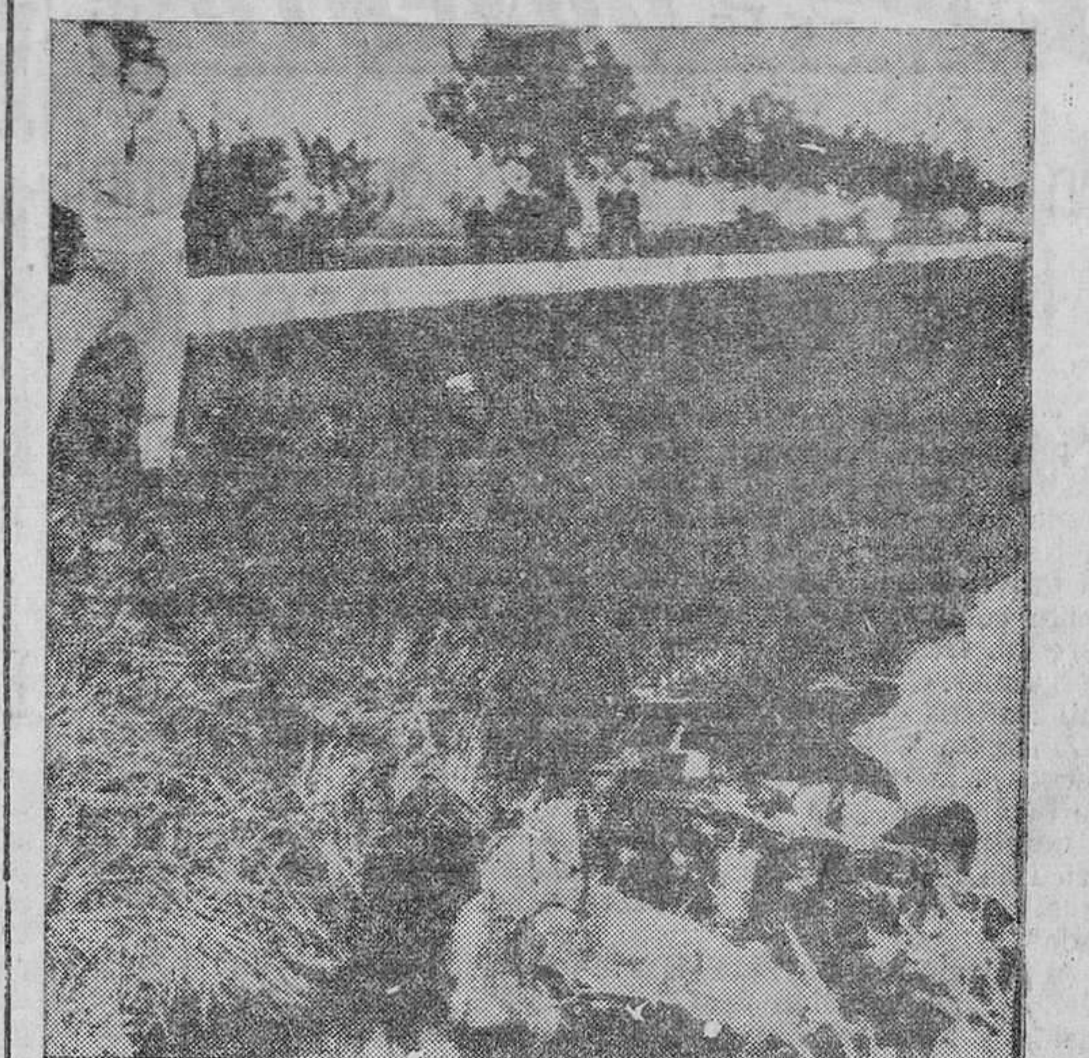
Ofrecemos dos nuevas fotos del trágico accidente que costó la vida al gran deportista español el marqués de Portago: La primera muestra bien claramente el lugar, la posición y el estado en que quedó su coche, y la segunda, su cadáver y el de su copiloto, conducidos, después de la catástrofe, a la capilla del Cementerio de la localidad del mortal accidente.