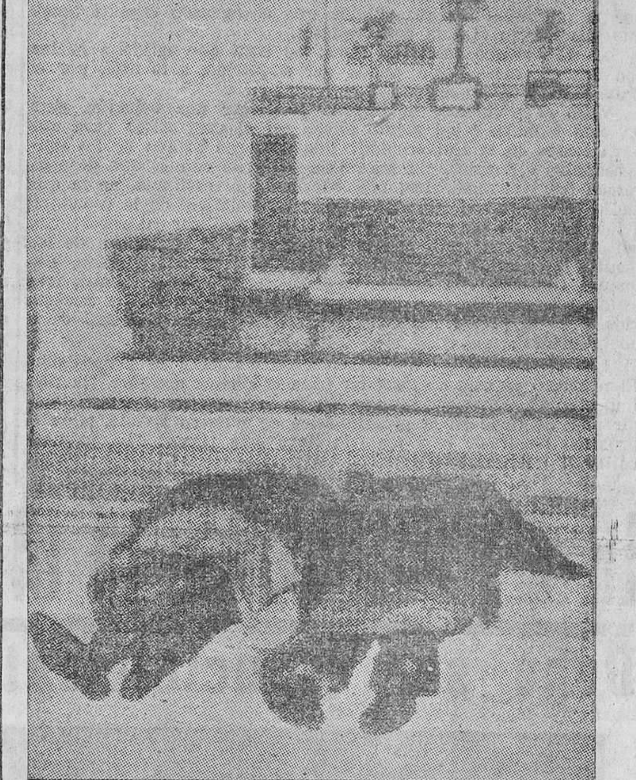
Ofrecemos dos nuevas fotos del trágico accidente que costó la vida al gran deportista español el marqués de Portago: La primera muestra bien claramente el lugar, la posición y el estado en que quedó su coche, y la segunda, su cadáver y el de su copiloto, conducidos, después de la catástrofe, a la capilla del Cementerio de la localidad del mortal accidente.