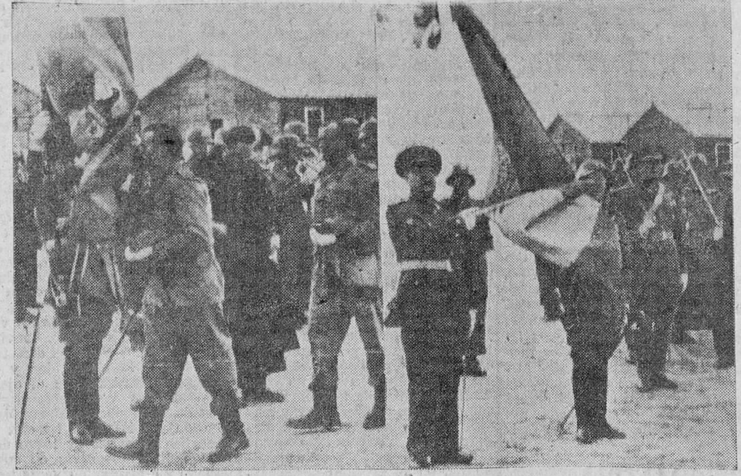
Los reclutas besan con unción la Bandera.