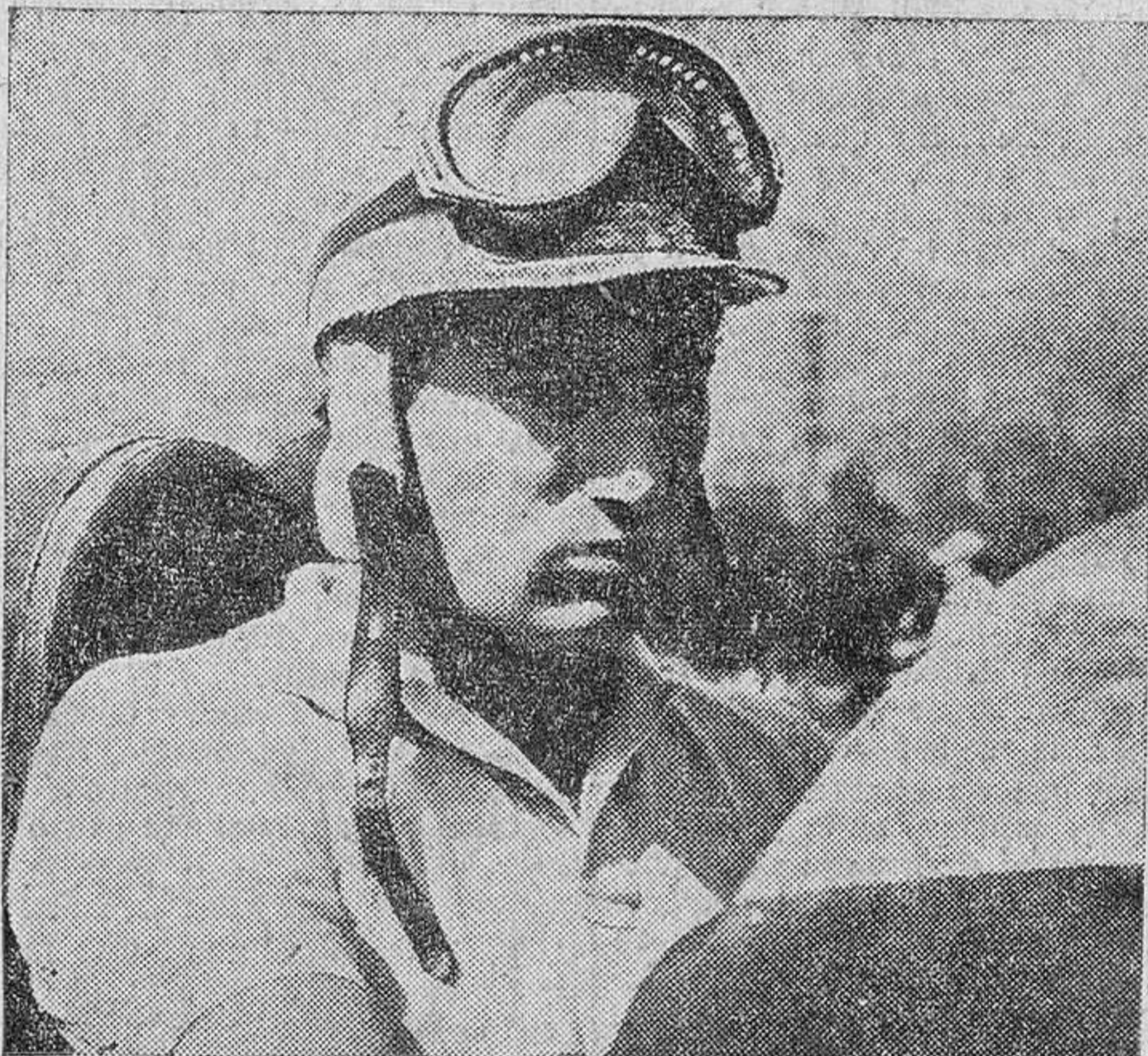
El marqués de Portago, que, víctima de fatal accidente, se mató ayer en la carrera de "Las mil millas".

Ultimamente, en las pruebas de trineos, destacó por sus triunfos