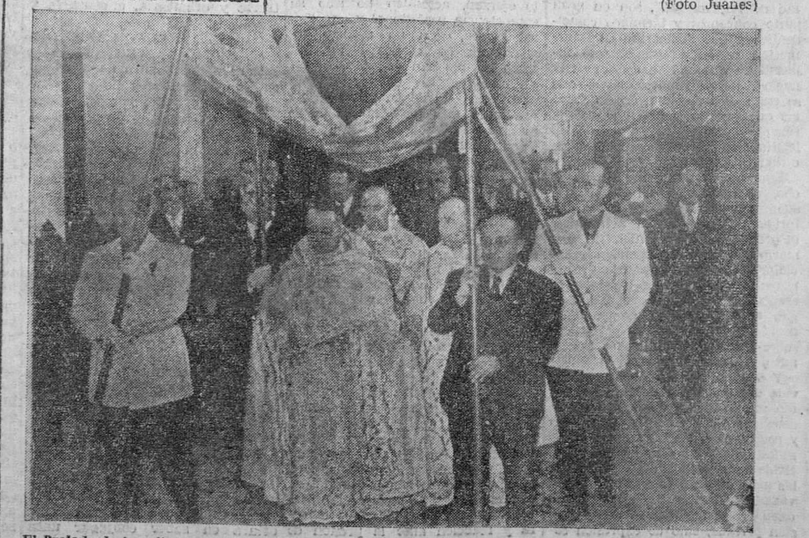
El Prelado, bajo palio, se dispone a llevar la comunión a los enfermos.