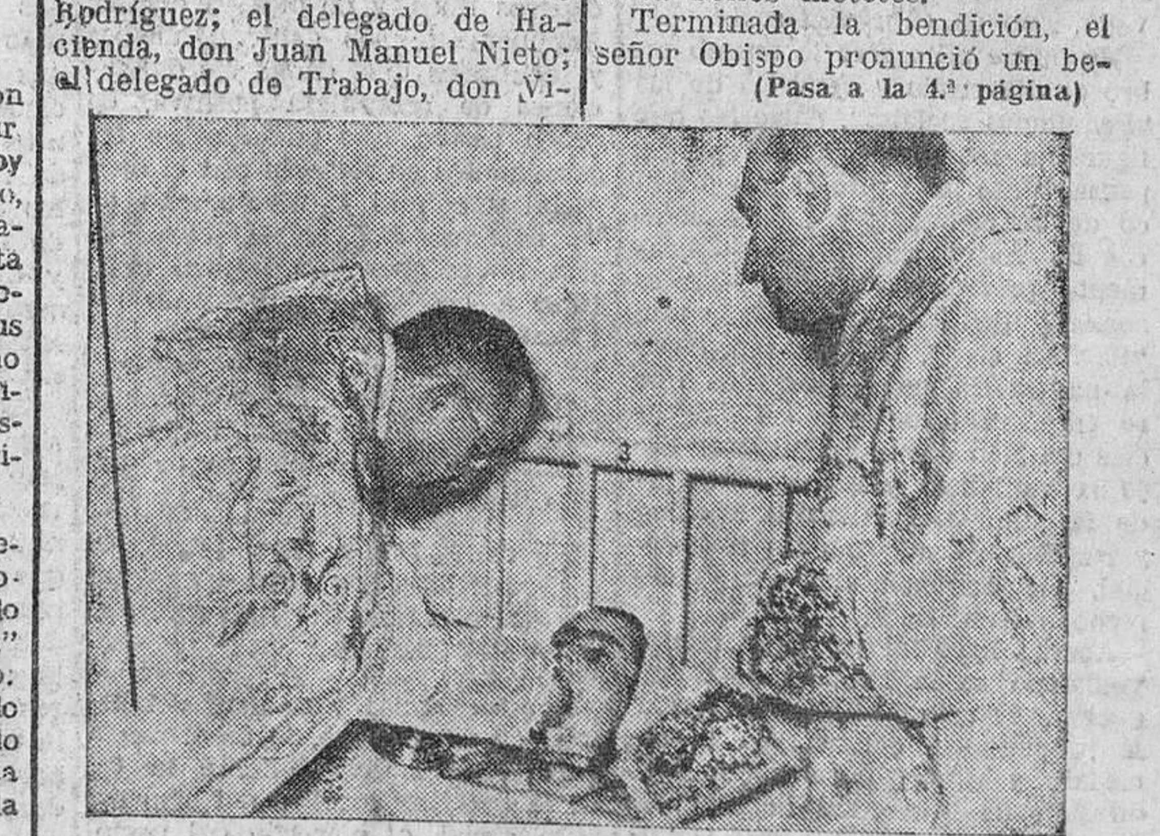
Una enferma recibe el Pan de los Angeles.

terminada la bendición, el señor Obispo pronunció un bendito (Pasa a la 4.ª página)