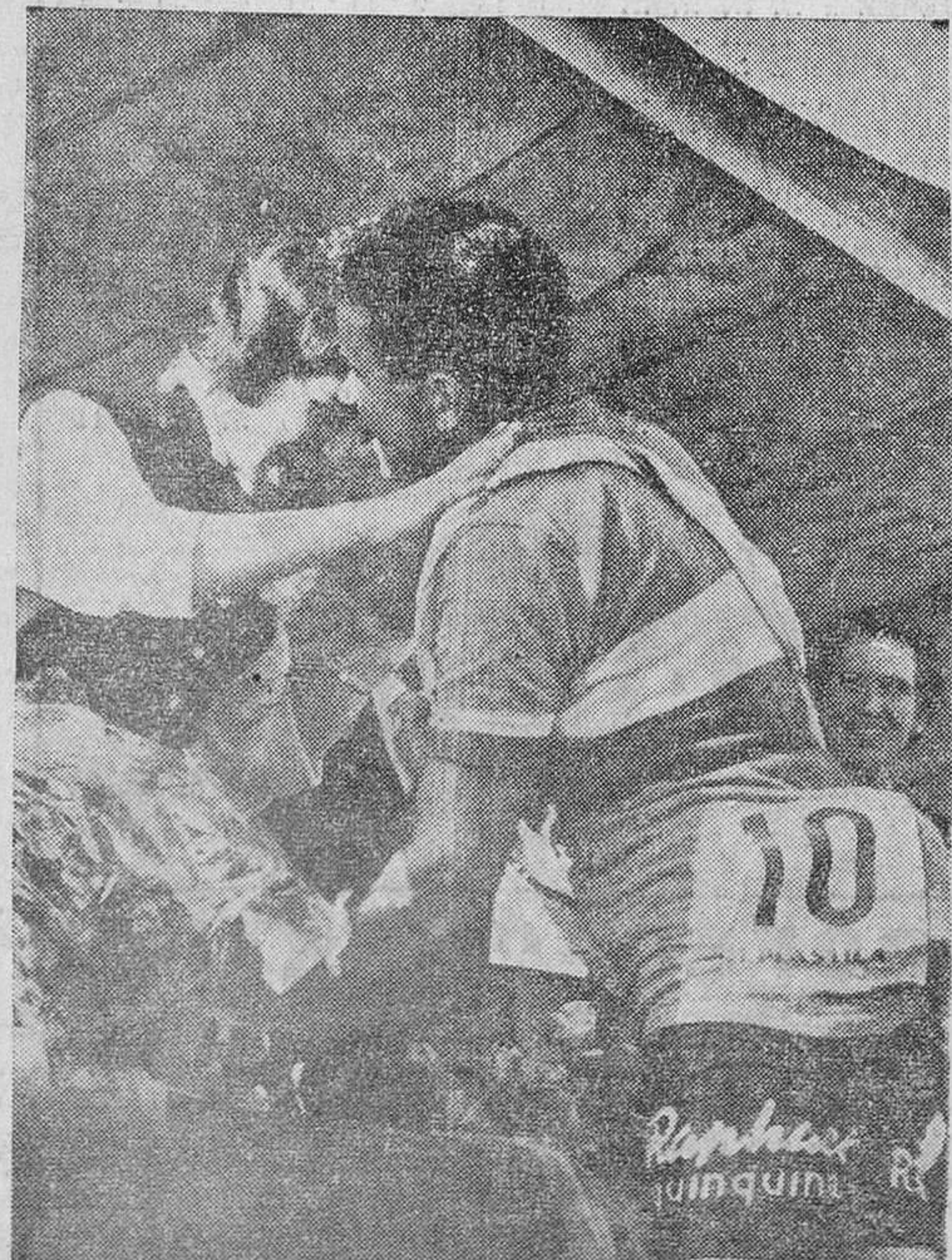
Walkowiak, ganador del Tour de Francia en 1956, que en la Vuelta a España sólo ha conseguido clasificarse en el lugar decimoquinto.

gamo y todos atrás y él el primero. Ya tiene ganado virtualmente el premio de la Montaña. Le basta vigilar únicamente a Carmelo Morales. El descenso se inicia rápidamente, ya que inmediatamente después de terminado éste nos encontramos con el alto de San Miguel, también puntuable para la Montaña y de igual categoría que el anterior.