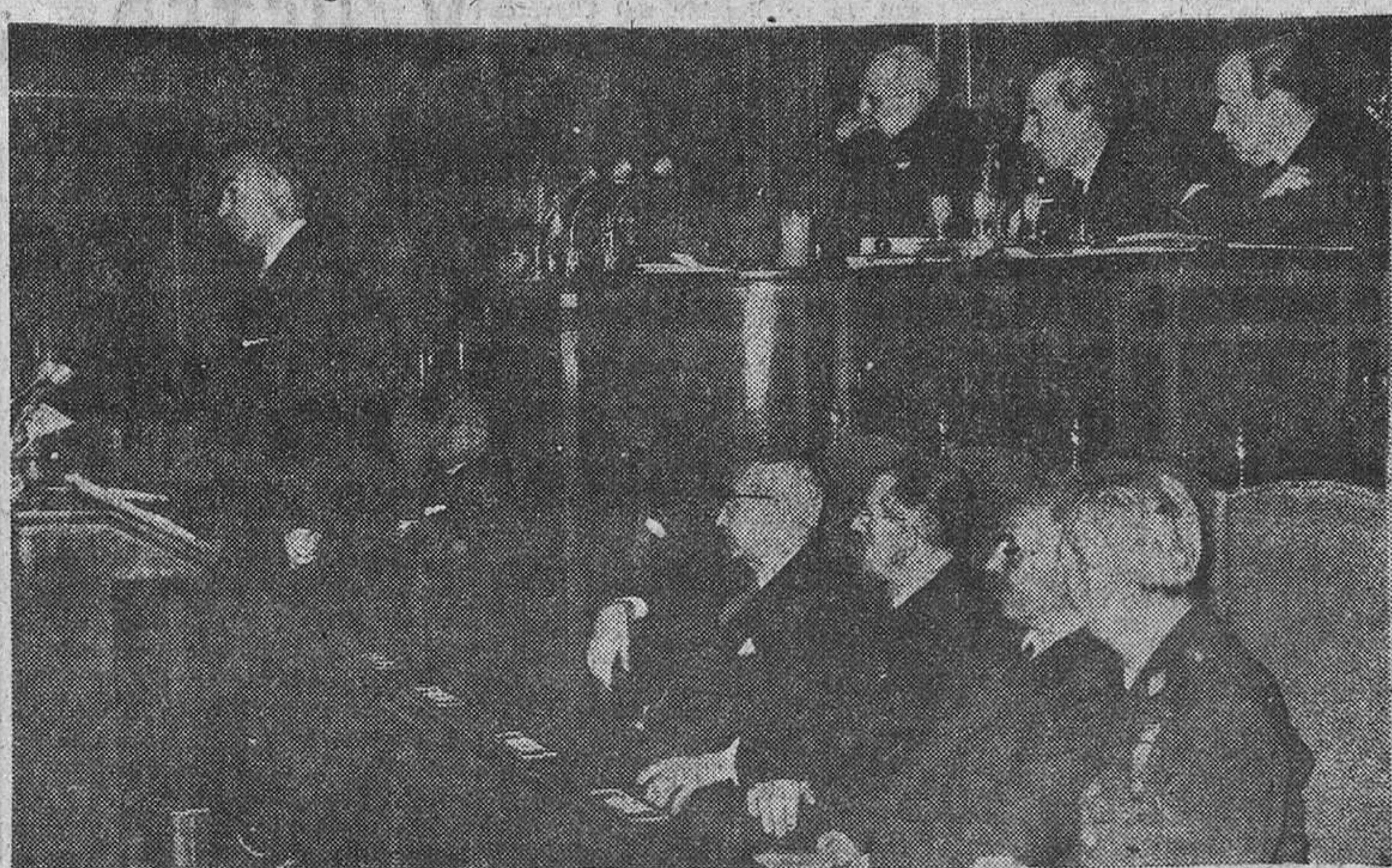
MADRID.—El ministro de Hacienda, señor Navarro Rubio, durante el discurso con motivo del Pleno de las Cortes españolas, que presidió don Esteban Bilbao.

Subrayó que a nadie podía escandalizar la nacionalización del