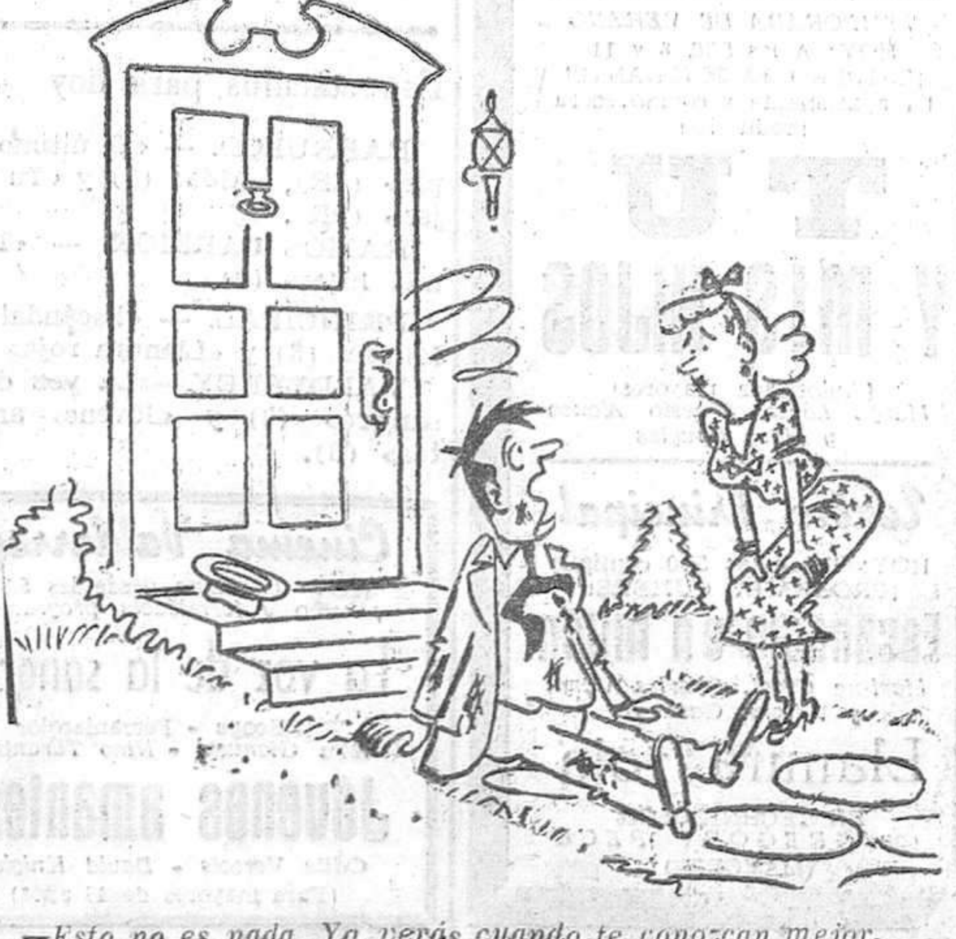
—Esto no es nada. Ya verás cuando te conozcan mejor.