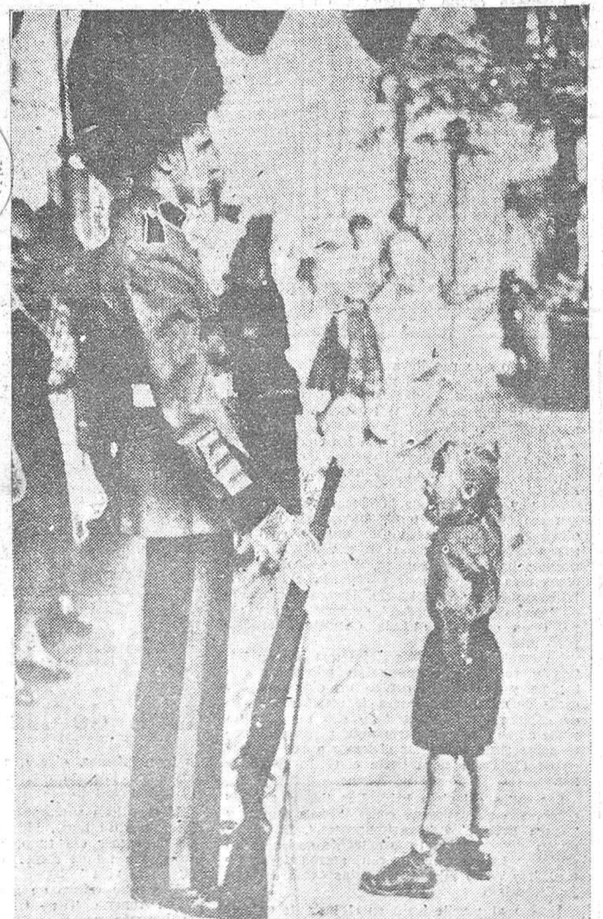
Inmóvil, impasible por completo a las muecas del niño, este soldado monta la guardia, que no tiene nada que ver con la del palacio inglés de Buckingham, ni con la del Kaisertoff de Viena. Se trata sencillamente de un almacén de los Estados Unidos, en la localidad de Cleveland, que p/ene este reclamo para vender los productos ingleses a los habitantes de la región.