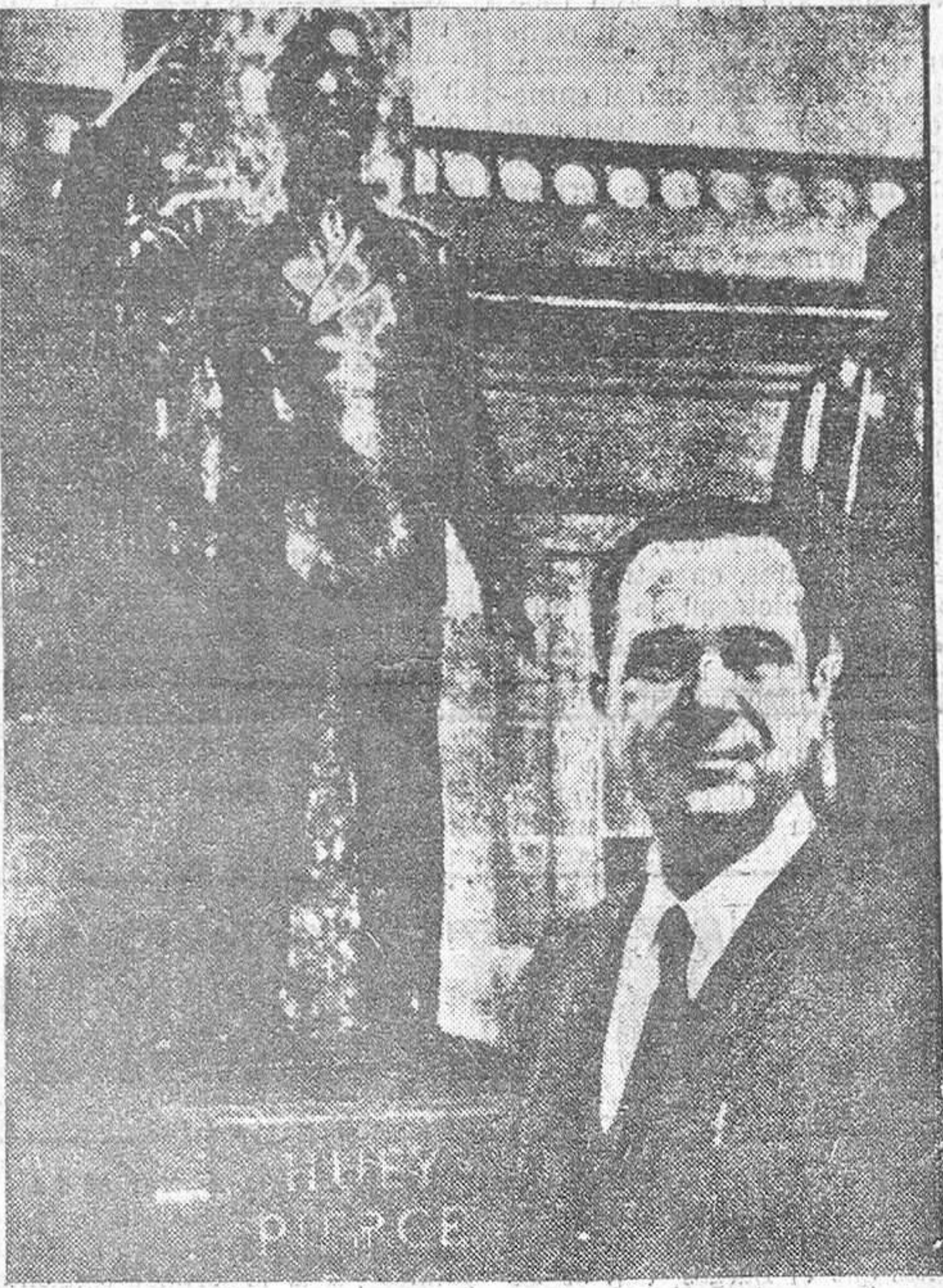
Junto a la estatua de Huey, su hijo Russell, senador americano y uno de los promotores para que Earl ingresara en el Hospital.

Se señala asimismo que la ciencia cuenta en la actualidad con una gran variedad de recursos para combatir las enfermedades de los ojos, como son, por ejemplo, la terramicina y otros antibióticos, y que es por tanto, absurdo, sufrir un accidente por no haberlo cuidado de manera adecuada.