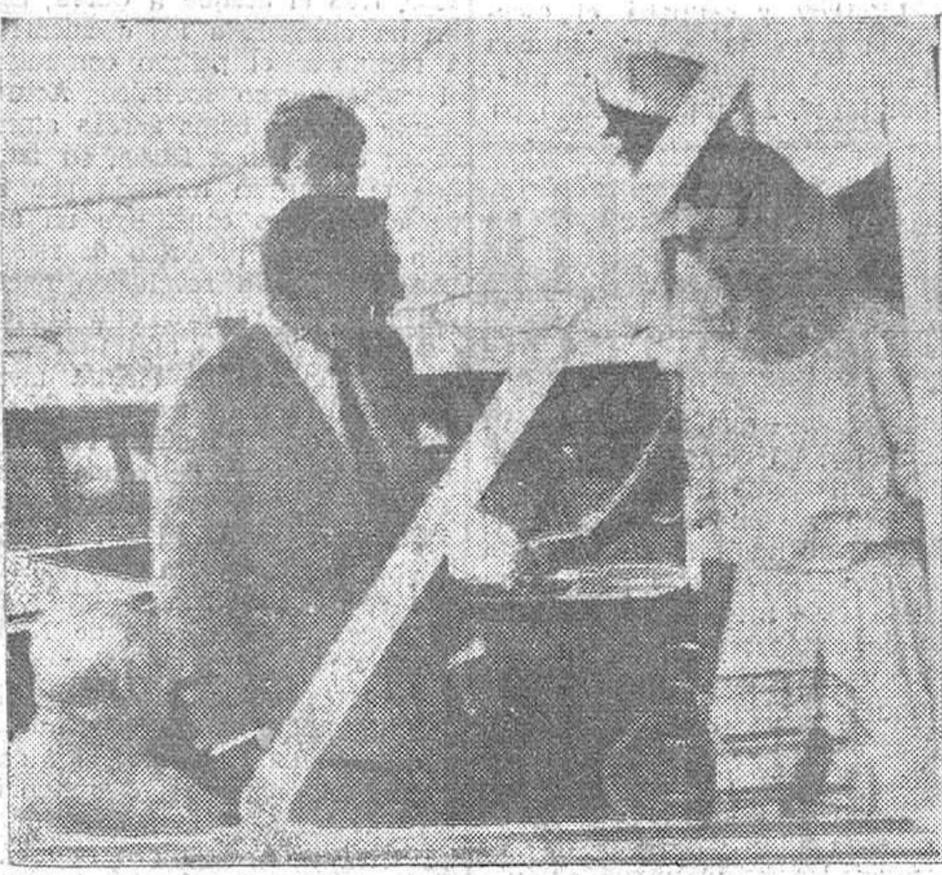
En la fotografía podemos apreciar el momento en que la famosa cantante María Callas se encuentra al lado de Randolph Churchill, a bordo del yate perteneciente al magnate del petróleo, Onassis. La diva está haciendo un cruceo en compañía del hijo del expremier británico.