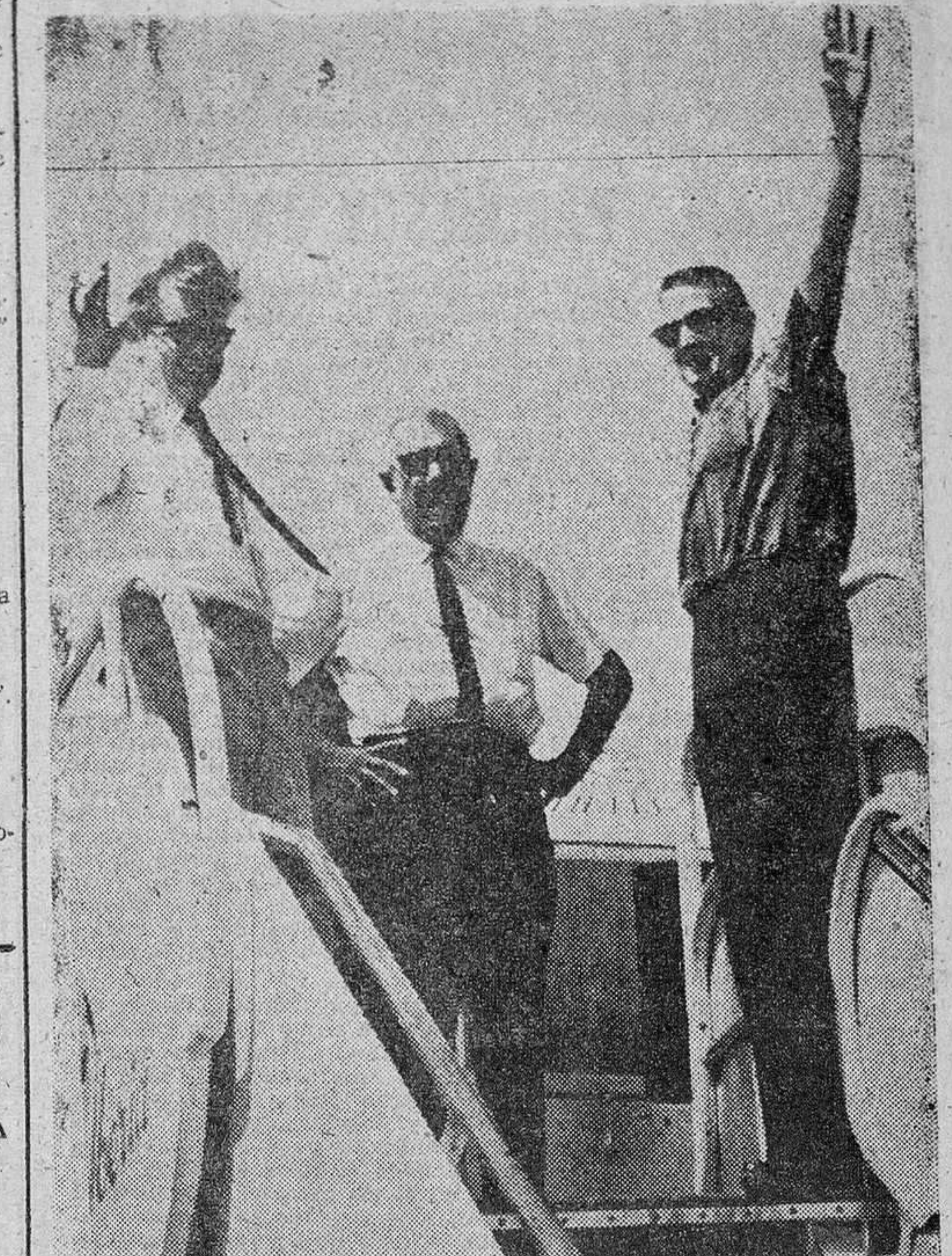
Madrid.- (Servicio especial).- Las coproducciones españolas tienen un gran porvenir en el mundo.