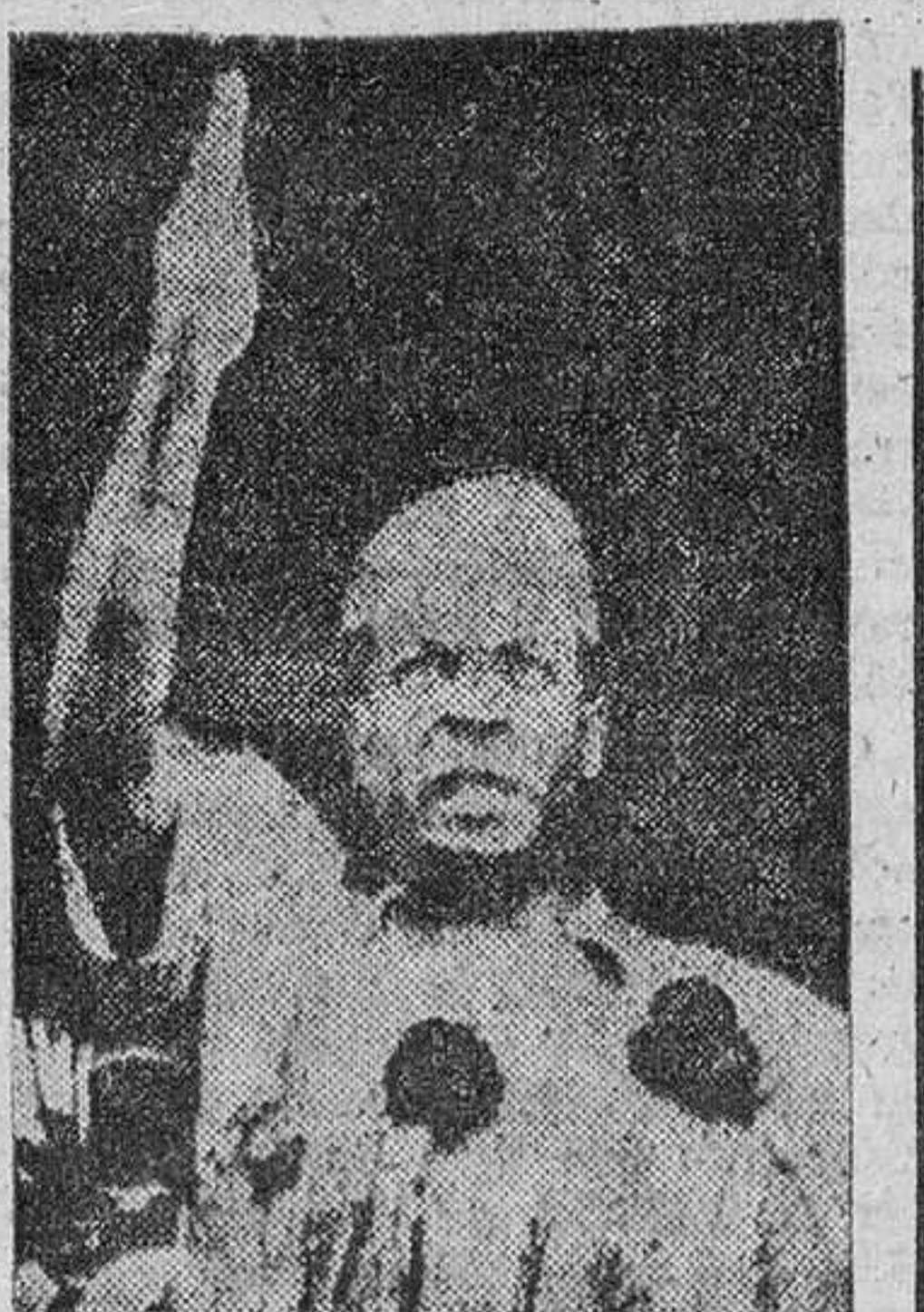
La bomba fue arrojada cuando el Presidente, que cuenta cincuenta y dos años de edad, abandonaba su vehículo para saludar a un grupo de niños...