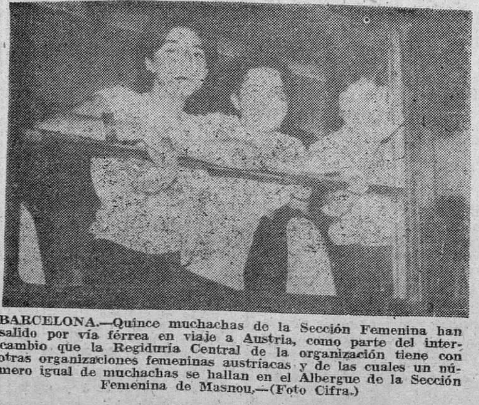
BARCELONA.—Quince muchachas de la Sección Femenina han salido por vía férrea en viaje a Austria, como parte del intercambio que la Regiduría Central de la organización tiene con otras organizaciones femeninas austriacas y de las cuales un número igual de muchachas se hallan en el Albergue de la Sección Femenina de Masnou.