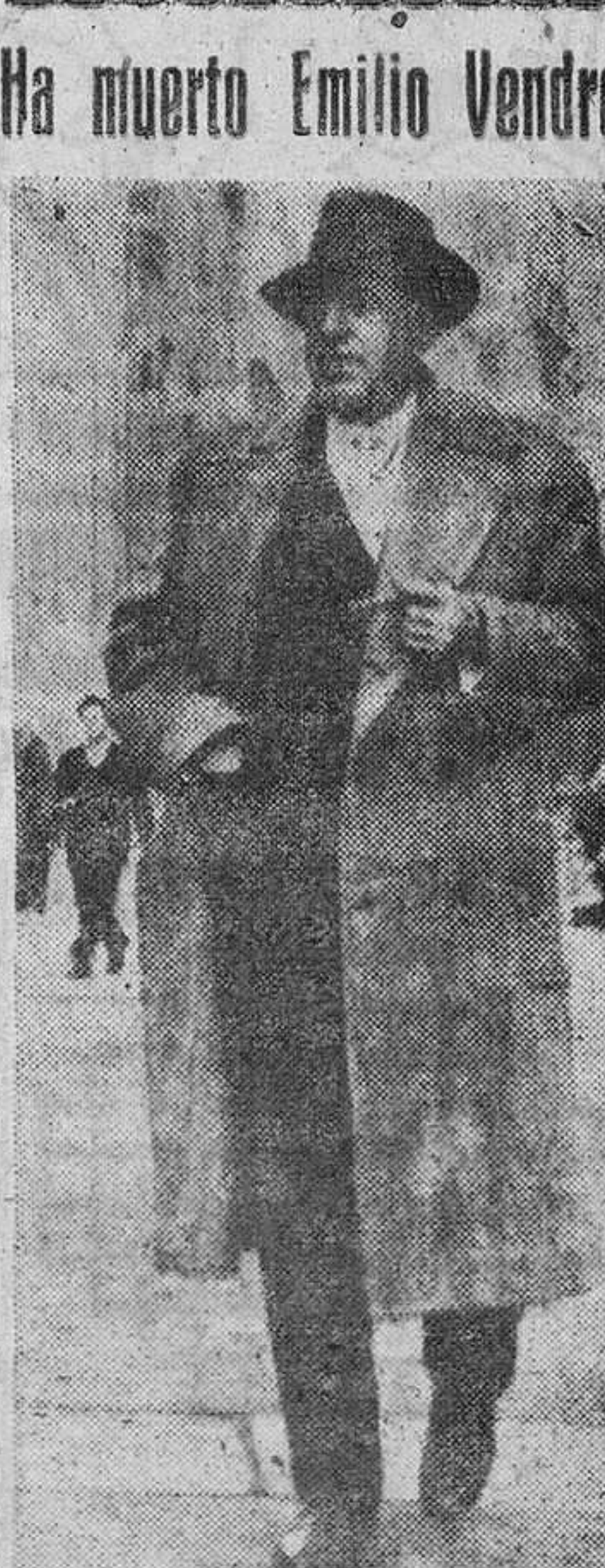
BARCELONA.—Fotografía del notable tenor Emilio Vendrell, que acaba de fallecer en esta capital.—(Foto Cirra).