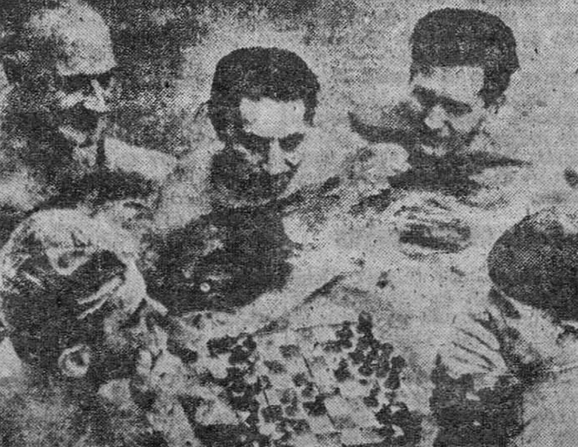
Seguramente estos sentidos jugadores de ajedrez empezaron la partida en enero, y como esto del ajedrez es tan entretenido...