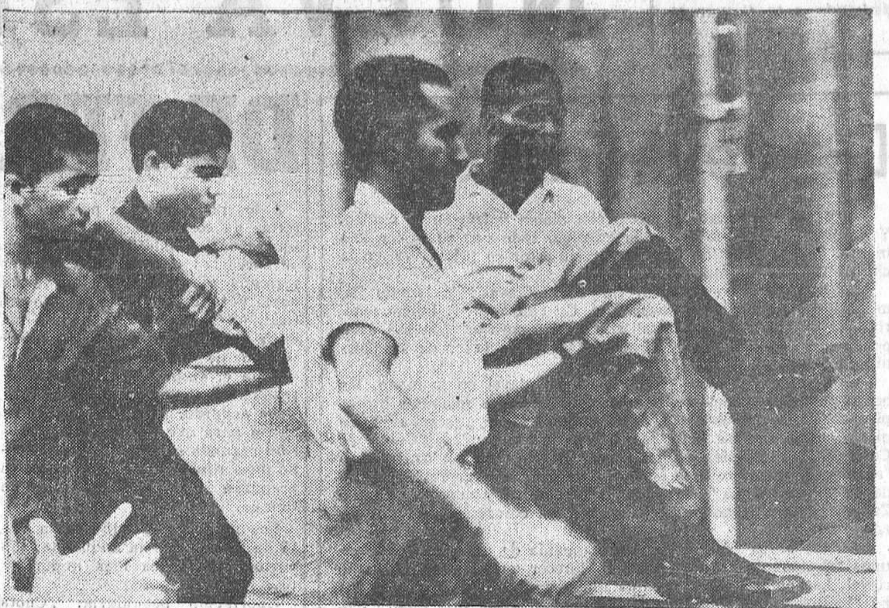
SANTO DOMINGO (República Dominicana). — Un joven no identificado es conducido por sus compañeros a un hospital, después de que fue herido y muerto por disparos en un choque con tropas de Santo Domingo, el pasado 17 de enero. Fue una de las dos personas que resultaron muertas durante las luchas callejeras que siguieron a la instalación de un régimen gobernado por una Junta Militar, y que más tarde fue derribada por un Consejo de Estado.