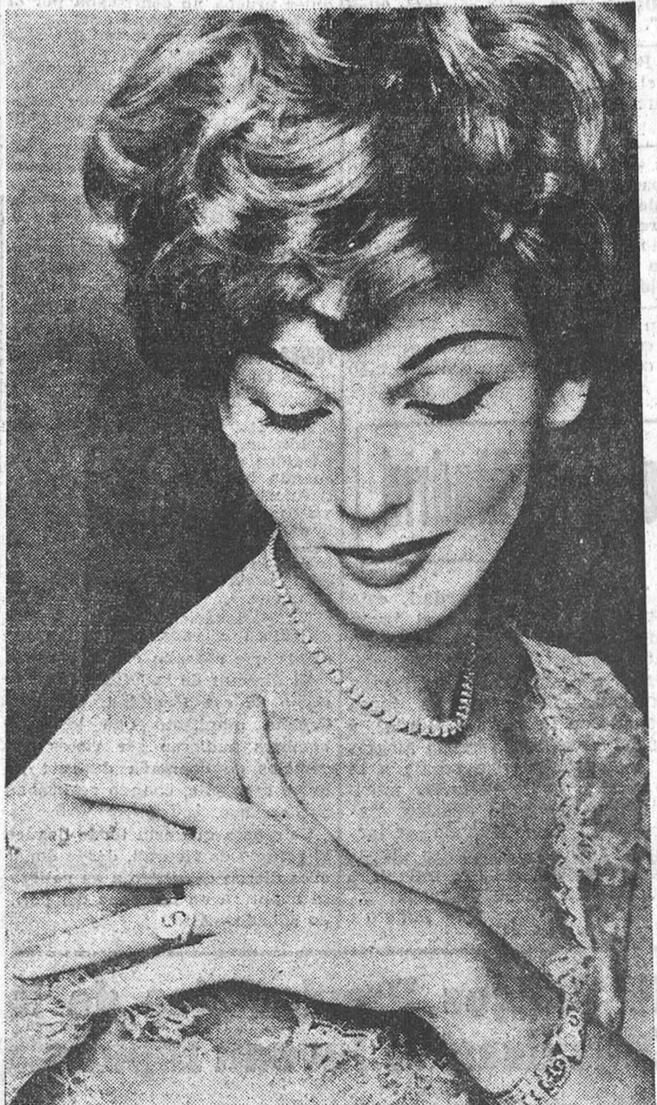
Con piedras de tamaño medio, pueden hacerse valiosas alhajas. Véase el ejemplo en esta «foto»: collar, sobre platino, en brillantes; anillo, de lo mismo, en forma de nudo; brazalete de brillantes tallados en formas ondeadas...