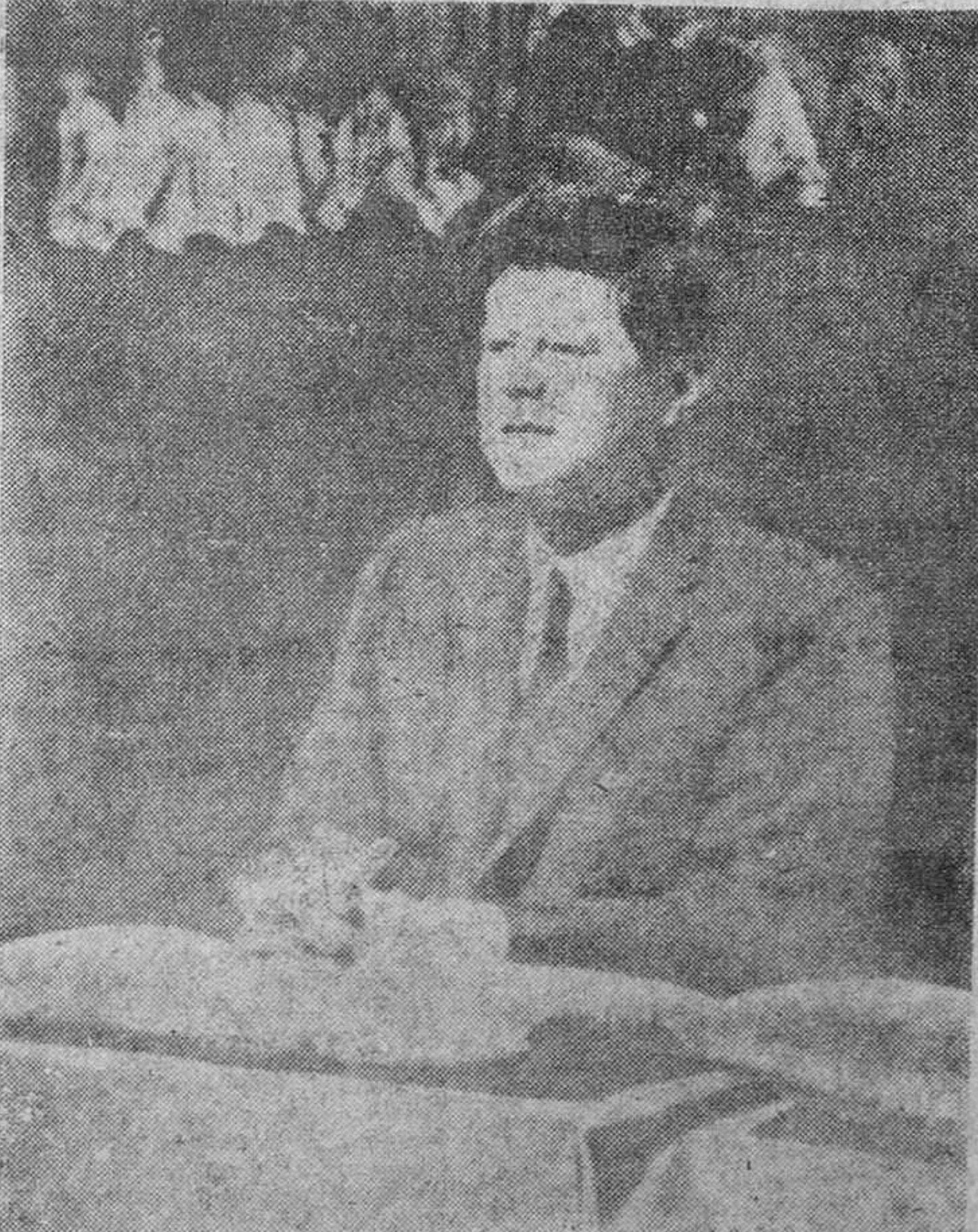
Un fotógrafo de «La Prensa Libre», de San José de Costa Rica, consiguió obtener esta foto del Presidente de los Estados Unidos. Por primera vez Kennedy ha sido retratado ante un comulgatorio, el de la Catedral de San José.