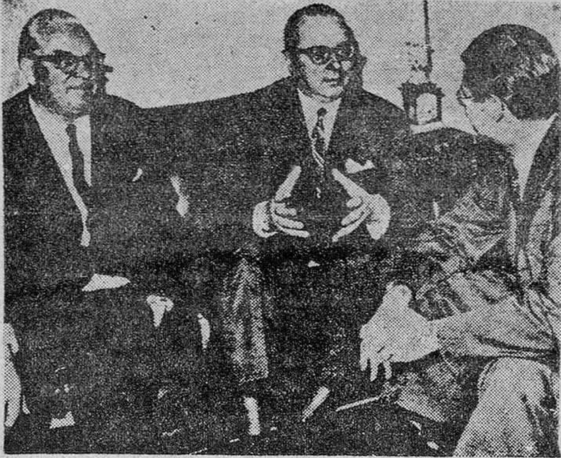
El jefe de la mayoría en el Bundestag de la República Federal Alemana se ha entrevistado en Washington con el secretario de Defensa de los Estados Unidos, con quien le vemos en el Pentágono. Con ellos, el embajador alemán.