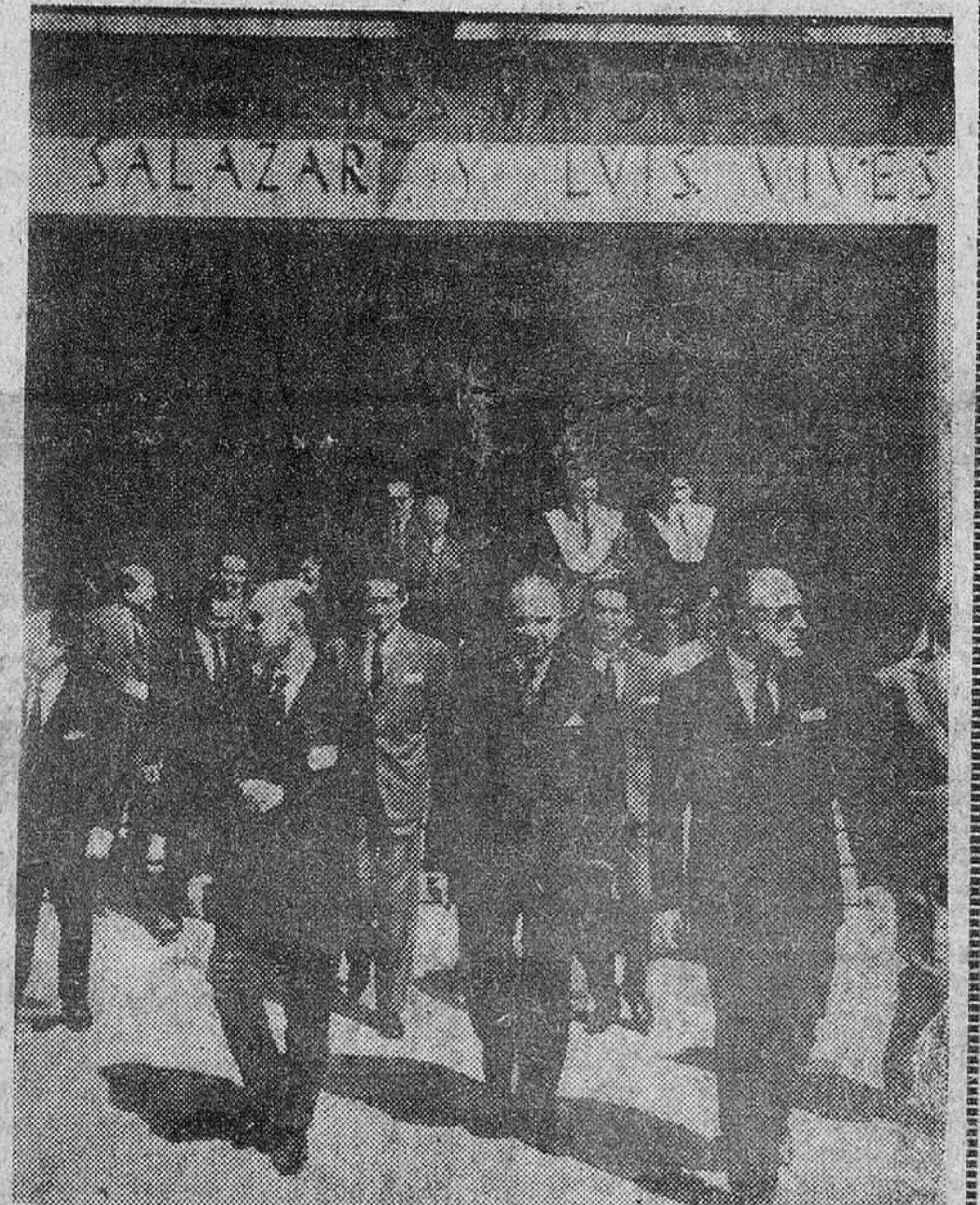
VALENCIA.—Con motivo de su estancia en la capital del Turia, el ministro de Educación Nacional, señor Lora Tamayo, visitó los Colegios Mayores «A. Salazar» y «Luis Vives». Le acompañaban las primeras autoridades valencianas.