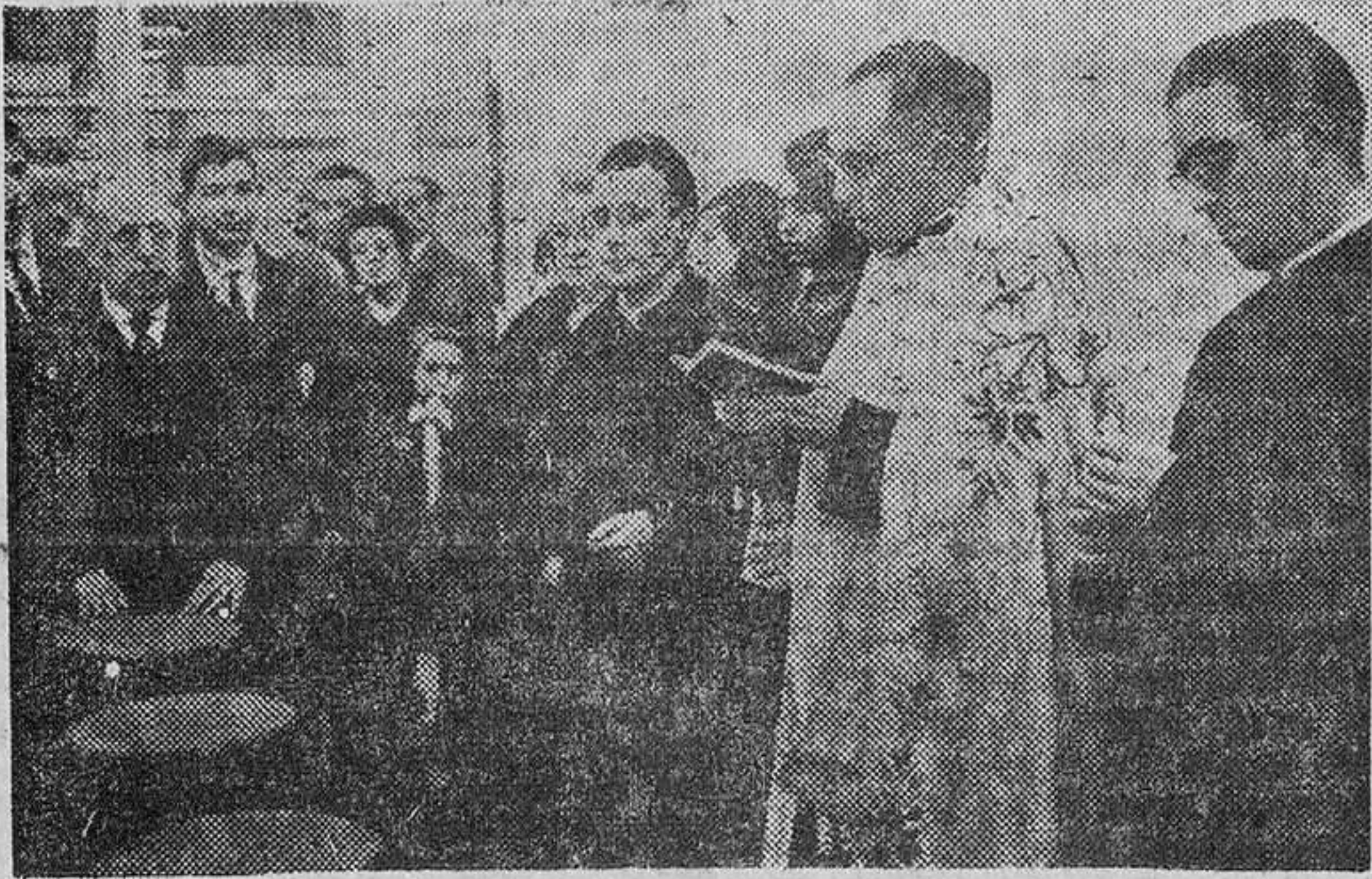
Bendición de la Cafetería.

inaugural fueron atendidos espléndidamente por los propietarios del establecimiento, los cuales recibieron innumerables testimonios de felicitación, a los que unimos la nuestra más sincera con los votos por su prosperidad.