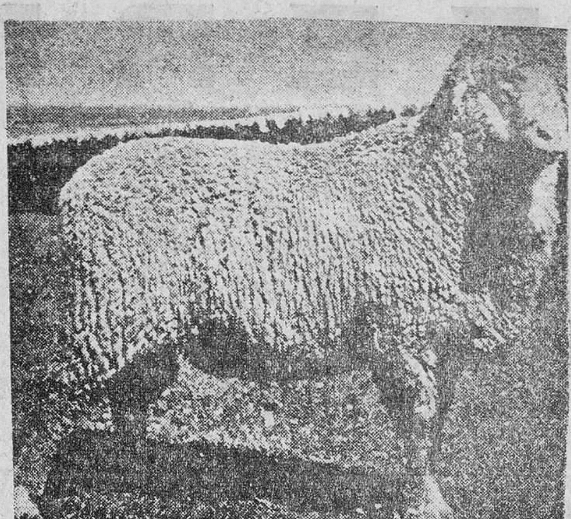
millones de pesetas, inferior al de 1961 en 105 millones por la baja de los precios de cotización en la mayoría de los tipos y clases de lanas.

Ya es conocida la atonía del mercado lanero español. Por el Servicio Comercial de Lanas del