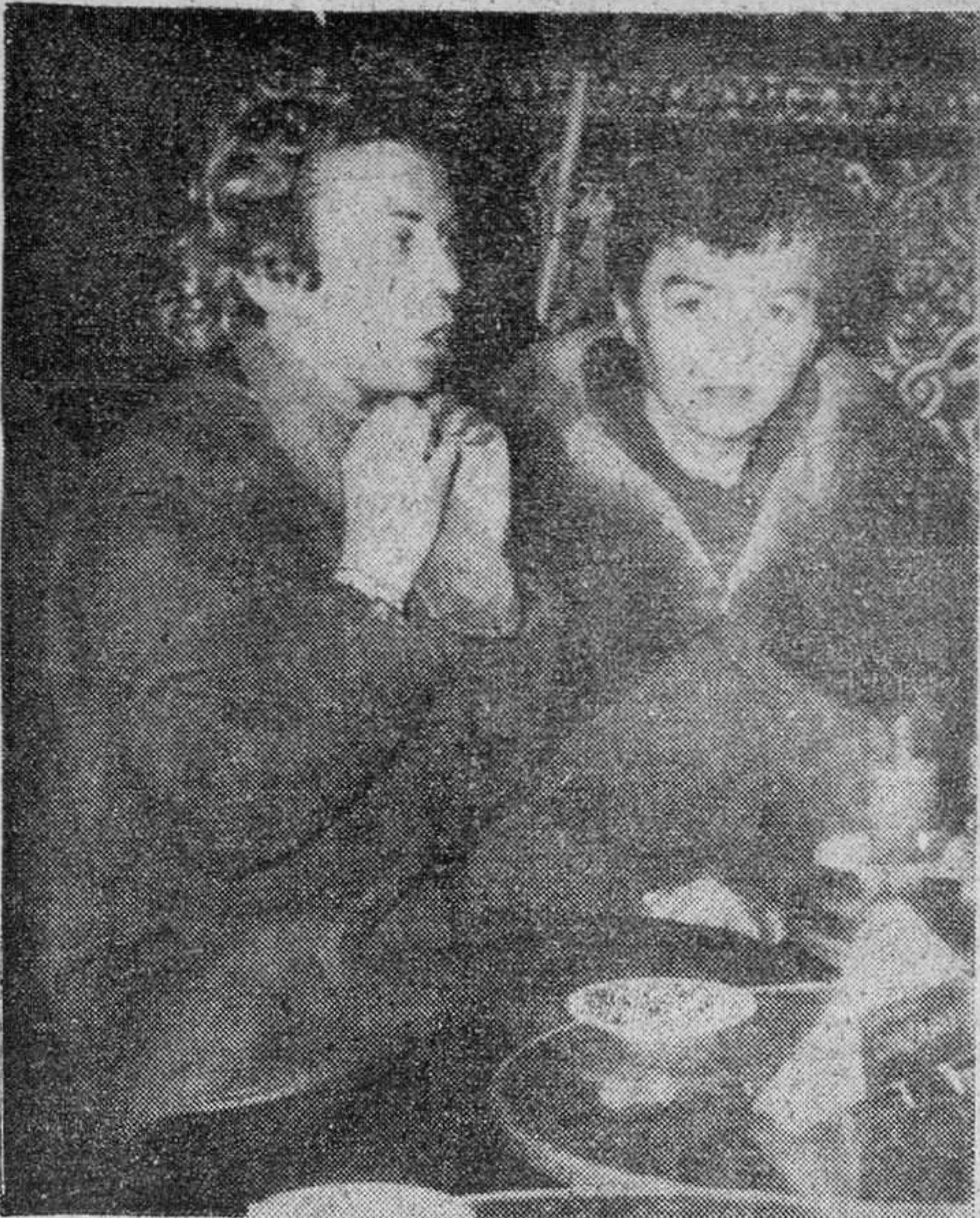
ALGECIRAS.—Tras haber desembarcado felizmente, los pasajeros del buque "Ciudad de Tarifa" fueron invitados a desayunar en uno de los bares de esta ciudad por la Compañía Transmediterránea. He aquí a dos subditas canadienses.