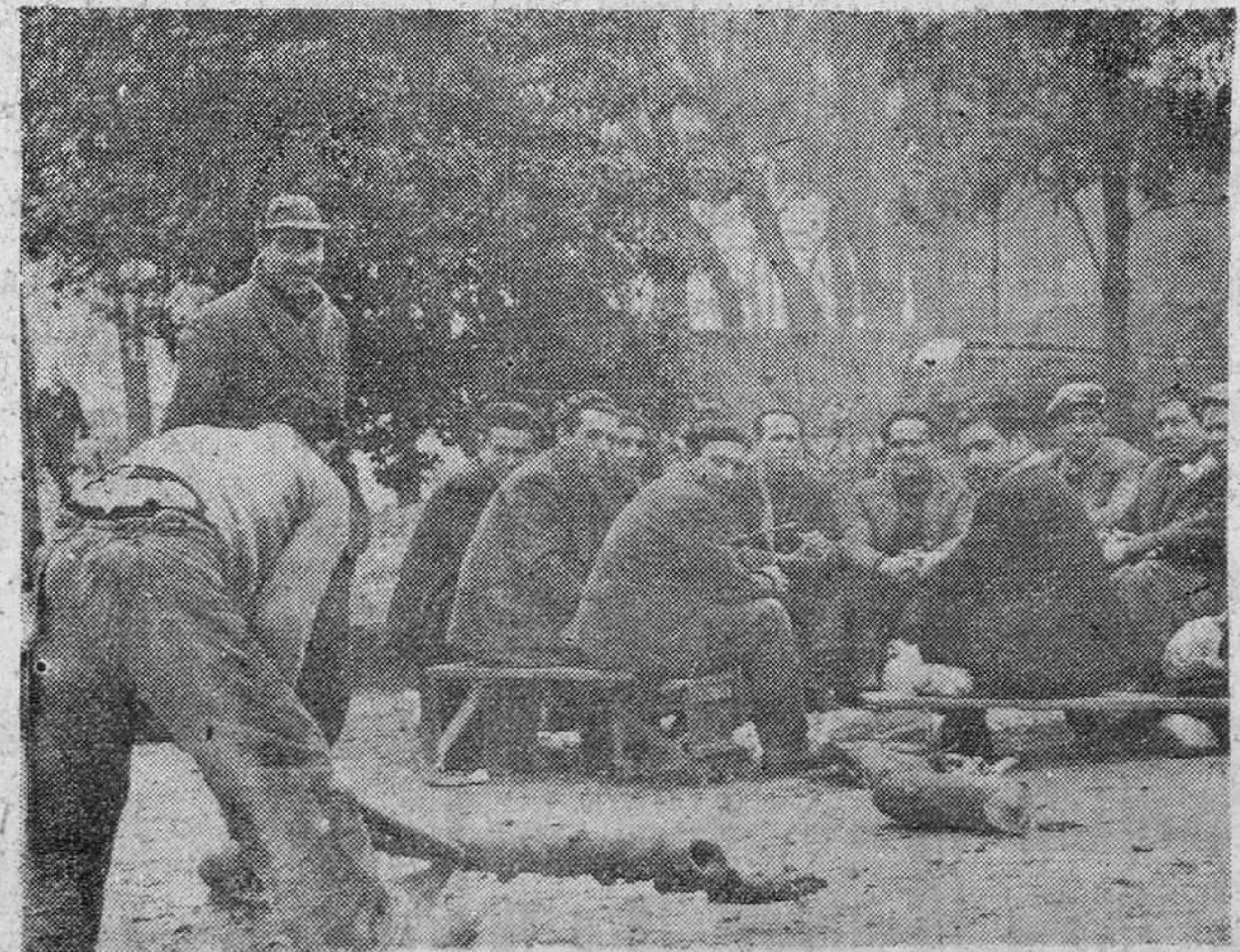
MADRID.—A la altura del Café Gijón, donde todo intelectual tiene su asiento y todo café con leche su razón, en el Paseo de Recoletos, la veterana y casi perpetua obra que hace años levantó allí sus reales, le da un aire extraño al paisaje urbano. Al mediodía, los obreros, con cierto aspecto de excursionistas, se toman un catarro. Y el alegre y elegante Recoletos adquiere un tono montañero, agreste, hasta ese punto en que cualquier parecido con lo que es, no será jamás otra cosa que una pura coincidencia.