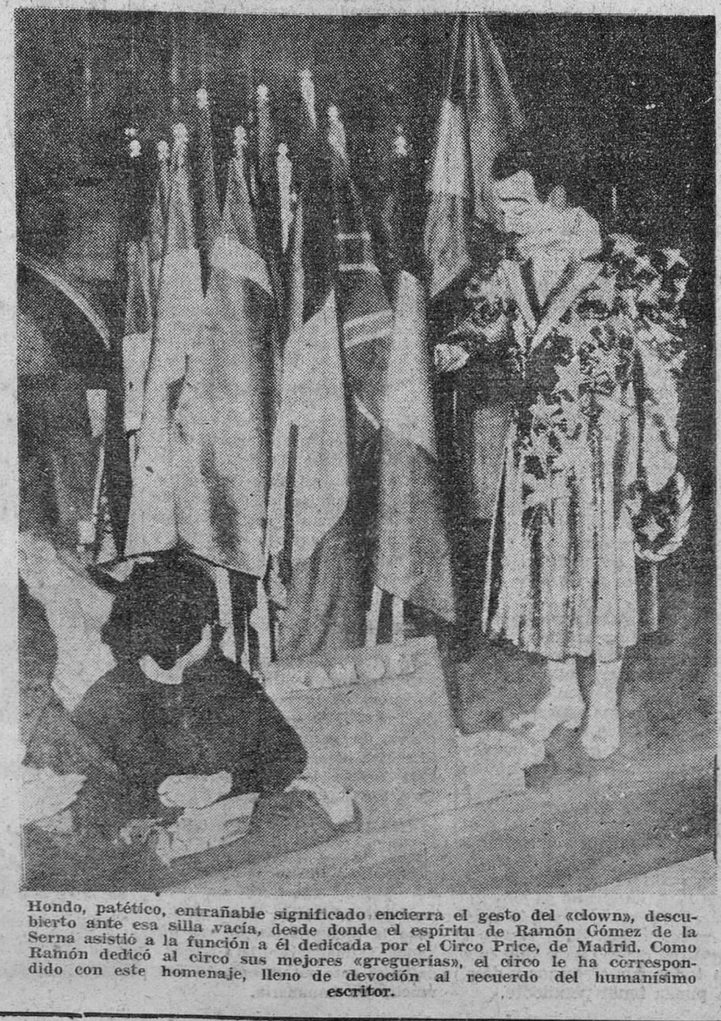
Hondo, patético, entrañable significado encierra el gesto del «clown», descubierto ante esa silla vacía, desde donde el espíritu de Ramón Gómez de la Serna asistió a la función a él dedicada por el Circo Price, de Madrid. Como Ramón dedicó al circo sus mejores «greguerías», el circo le ha correspondido con este homenaje, lleno de devoción al recuerdo del humanismo escritor.