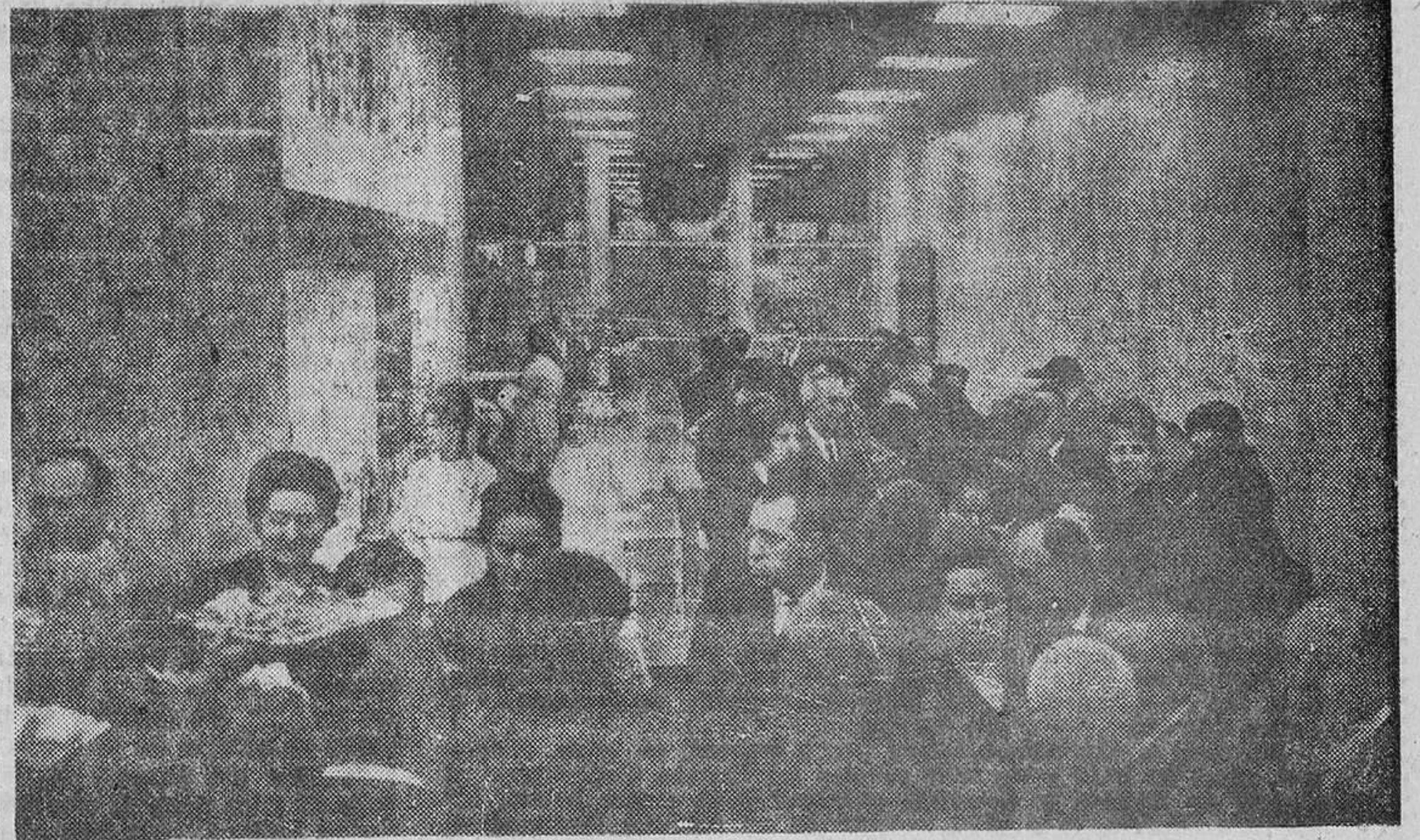
Un aspecto de los nuevos locales durante la inauguración.