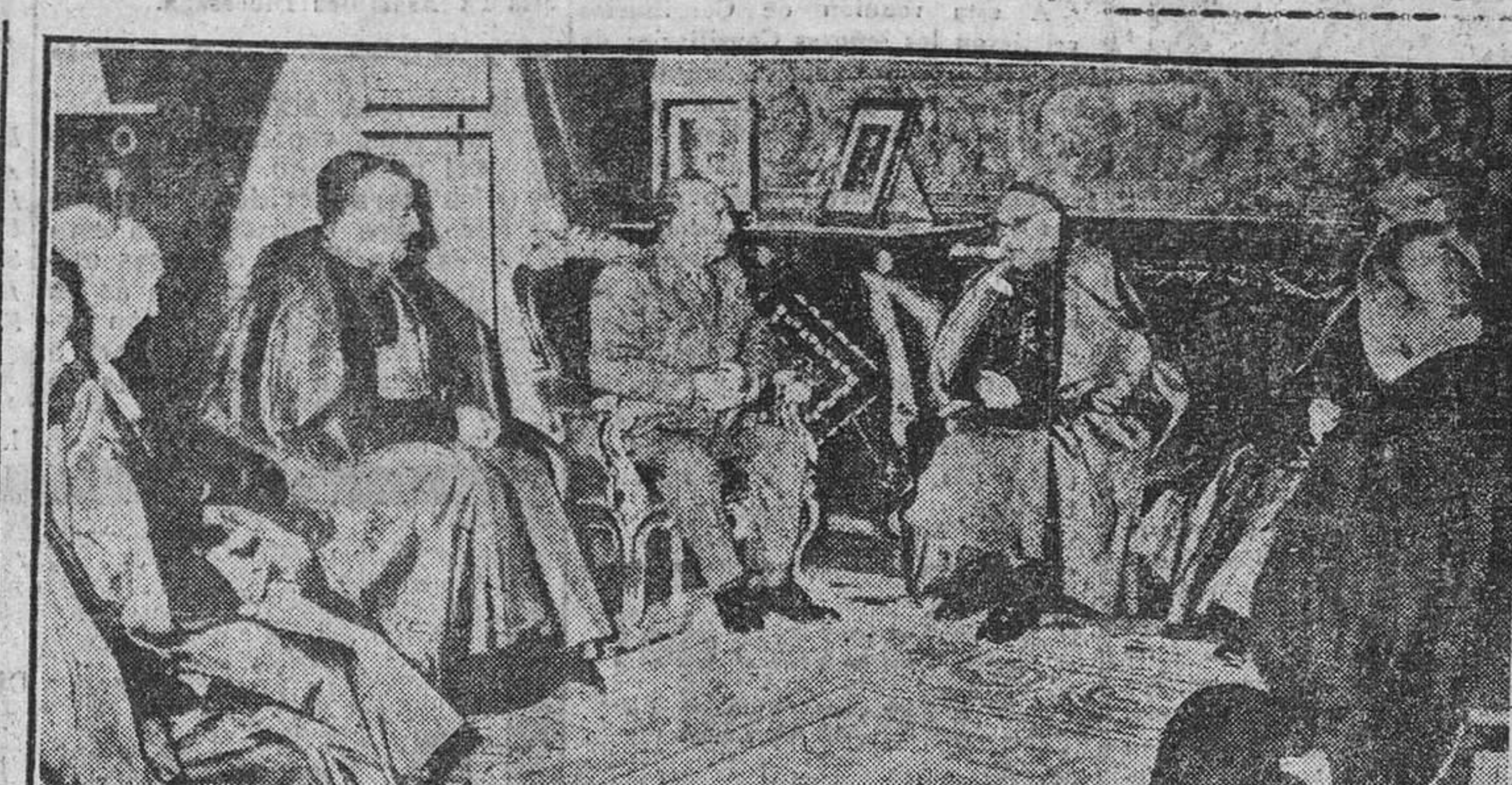
El Jefe del Estado recibió en el Palacio de El Pardo a los representantes de las sedes arzobispales que se hallan en Madrid con motivo de la tradicional conferencia de Metropolitanos. Junto al Caudillo aparecen los cardenales Pla y Deniel, Quiroga Palacios y Arriba de Castro.